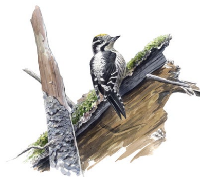
Tretåig hackspett. Ill: Niklas Johansson