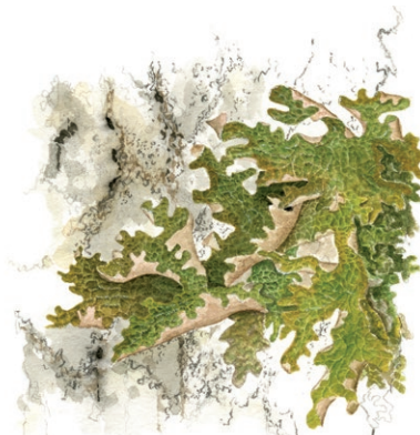
Lunglav. Ill: Lennart Molin

Skogens många ihåliga träd är idealiska boträd för hackspettar och andra hålbyggande djur. Kanske ser du spår efter den sällsynta tretåiga hackspetten i form av ringade tall- eller granstammar. I sin jakt på trädens sav hackar den nämligen små hål som löper som ringar runt stammen, ofta i täta rader under varandra.