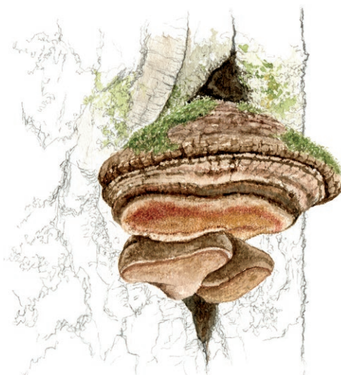
Stor aspticka. Ill: Lennart Molin