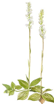
Knärot. Ill: Jonas Lundin

Vänd blicken från de resliga träden till markens små underverk. En av alla arter som är typisk för gamla skogar är den lilla orkidén knärot. Trots att den hör till våra vanligaste orkidéer förbises den lätt. Undersöker du den på närmare håll lägger du märke till de rutmönstrade bladen och de små håriga blommorna.