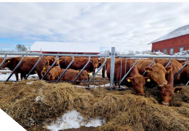
Några av rödkullorna och deras fina kalvar.