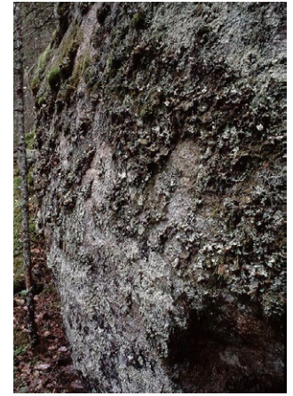
Utsikt över Sävälven (t.v.), tjäderrede (mitten) och norsk näverlav på block (t.h.).

I naturreservatet Nedre Sävälven möter du en mosaik av gamla artrika skogar, myrar och blockrika marker. I skogen berättar kolade stubbar om forna skogsbränder. Den markerade stigen leder dig ut i vildmarken, där en lång rad sällsynta växter och djur har sitt hem.