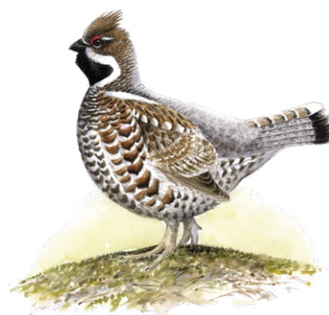
Järpe Illustration: Jonas Lundin

Skogen har klarat sig undan dagens storskaliga skogsbruk men är knappast orörd. Här finns bland annat flera kolbottnar, som berättar om traktens långa historia av bergsbruk. Traktens hyttor slukade stora mängder av träkol, som framställdes genom sakta förbränning av ved i milor. Kolbottnarna är det som idag finns kvar efter milorna. Tillverkningen av träkol pågick en bit in på 1900-talet, då en stor del av hyttorna i området lade ner sin verksamhet.