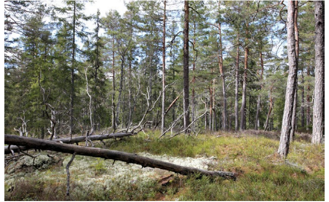
Hällmark i reservatets norra del.

Naturreservatet Alntorps storskog är en trolsk gammelskog strax öster om Nora. Bergslagsleden passerar genom reservatet.