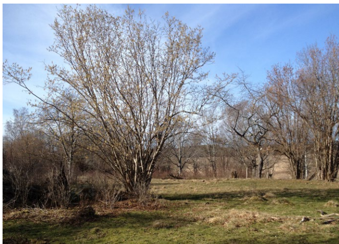
Tomta hagar.

Tomta hagar är en gammal betesmark med många spår efter de människor som bott här under lång tid. Här finns även tydliga strandvallar som bildades för ca 8000 år sedan, då den så kallade Ancylussjöns vågor svallade mot sluttningen.