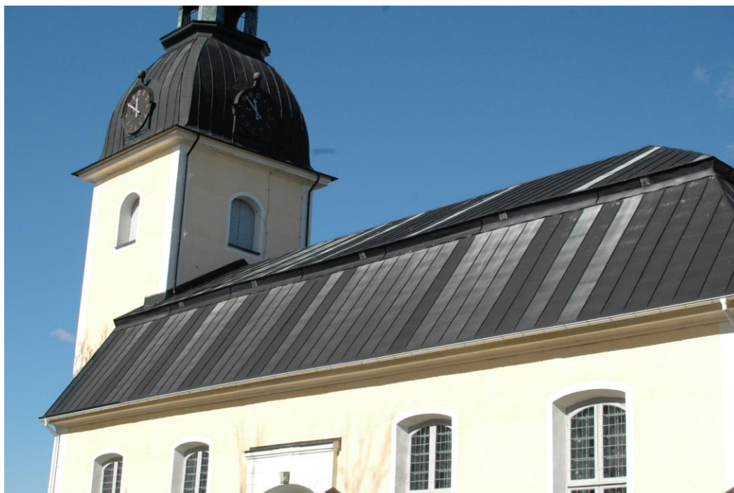
Taket före ommålning.

Sedan några år tillbaka hade färgen bleknat markant på stora delar av taket. Det fanns även några andra smärre skador.