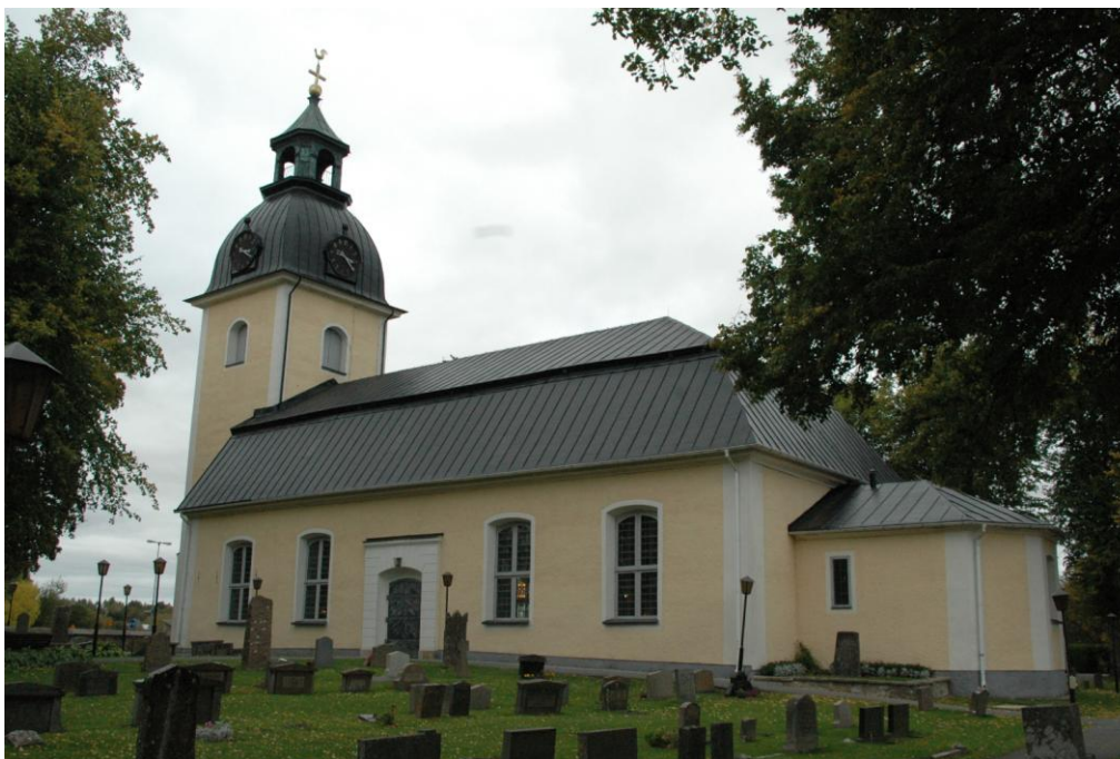
Taket efter ommålning.