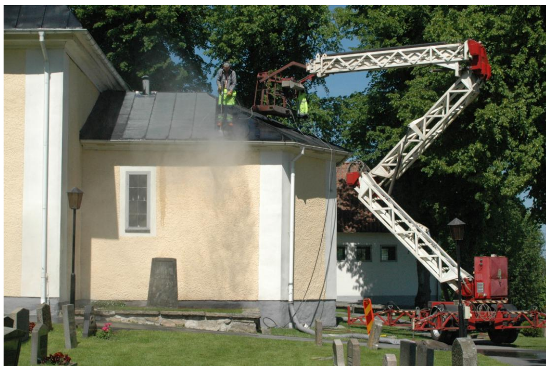
Ekeby kyrkas tak under rengöring före ommålning