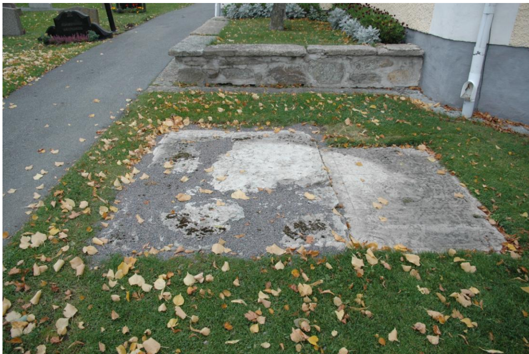
De intakta delarna av den skadade gravhällen återlagda på plats. Foto från öster.

Att döma av läget borde graven ha tillhört någon i kyrkan verksam präst. Men förvånansvärt nog är alltså stenramen för kort för en normal kista. Har hällen hört samman med den nuvarande kyrkans föregångare? Är hällen utflyttad från kyrkan (det finns och har funnits många påkostade gravhällar i Ekeby kyrka, ovanligt många för en kyrka i Örebro län)? Eller har den alltid legat här ute på kyrkogården? Och i detta läge? Det är fler frågor än svar!