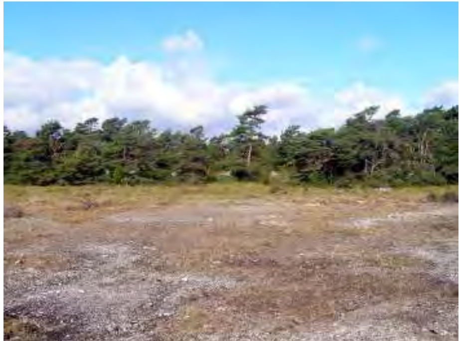
Alvarmark och lågvuxen tallskog uppe på Grogarnsbergets norra del.