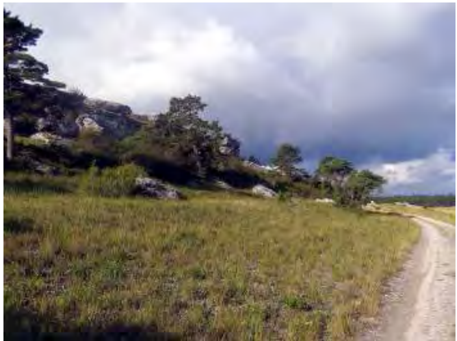
Strandtallar och nedrasade block nedanför Grogarnshuvud.