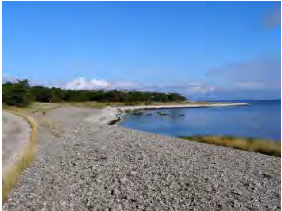
Stenig strand söder om Skånerevet.