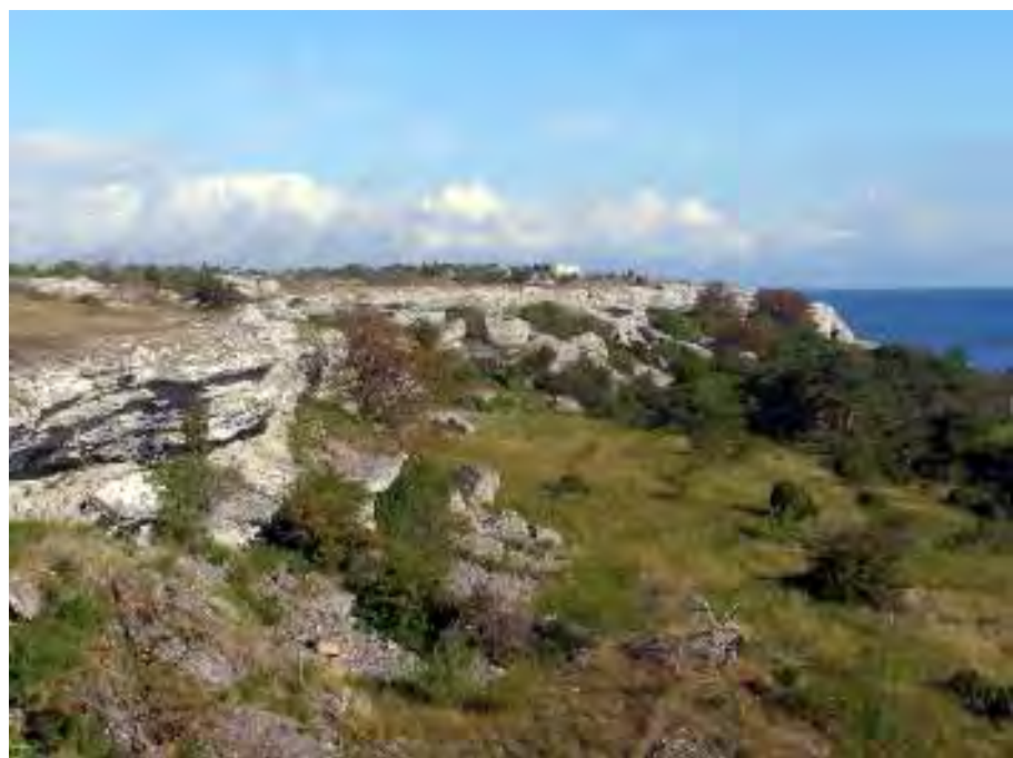
Grogarnsbergets östra brant. Nedanför branten ligger stora nedrasade stenblock. I buskagen nedanför klinten häckar bl.a. höksångare.