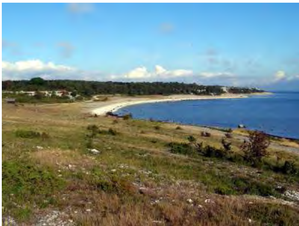
Kusten längs den östra delen av Grogarnsberget.

Området har betats sedan urminnes tider. Delar av Grogarnsberget betas idag av får, men betetrycket har under senare tid varit svagt. Det medför att slån, en, hagtorn, nypon, tall och oxel växer upp i täta dungar. Branterna mot klapperstensstränderna betas endast svagt. Den s.k. Skåneskogen i öster (fastigheterna Östergarn Grogarns 1:22, 1:43 och 3:1) har dock en klar betesprägel och saknar buskskikt. Beteshävdnen är mycket viktig i hela området och en förutsättning för att bergets stora naturvärden ska kunna behållas.