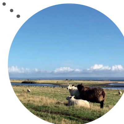
JONSTORP-VEGEÅS MYNNING □