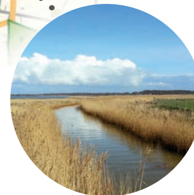
GÖRSLÖVSÅNS MADER □