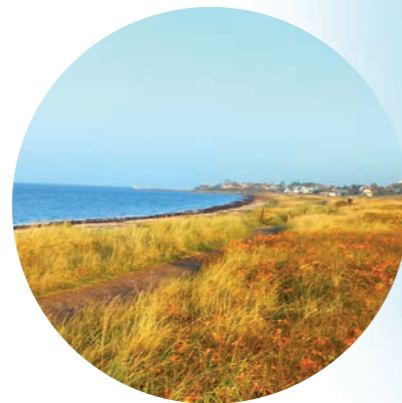
VÄSBY STRANDMARK □