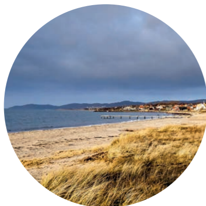
NYHAMNSLÄGE STRANDBADENS KUSTHED □