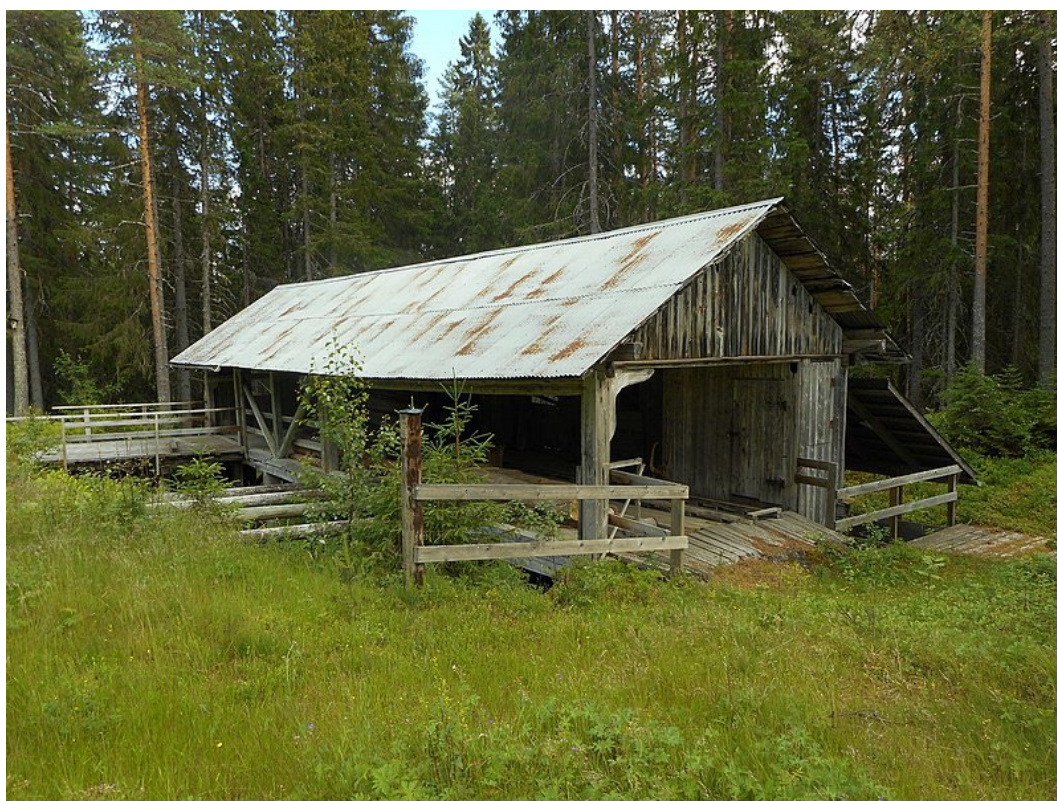
Figur 2. Bolsågen, norra långsidan.

Vattenhjul, axel och vevstake är gjorda av trä men delvis förstärkta med järnbeslag. Axelns lager vilar i rotvirke och smörjs med vatten. Kraftöverföring sker även till en slipmaskin för slipning av sågblad. Byggnaden har numera tak av sinuskorrugerad plåt. Under år 2006 renoverades Bolsågen med hjälp av bidrag från Riksantikvarieämbetet varvid bland annat vattenrännan av stabilitetsskäl förstärktes.