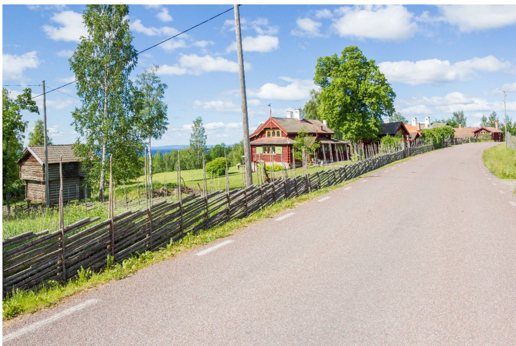
Figur 1. Sjurberg, belägen i en södersluttning ner mot Siljan.