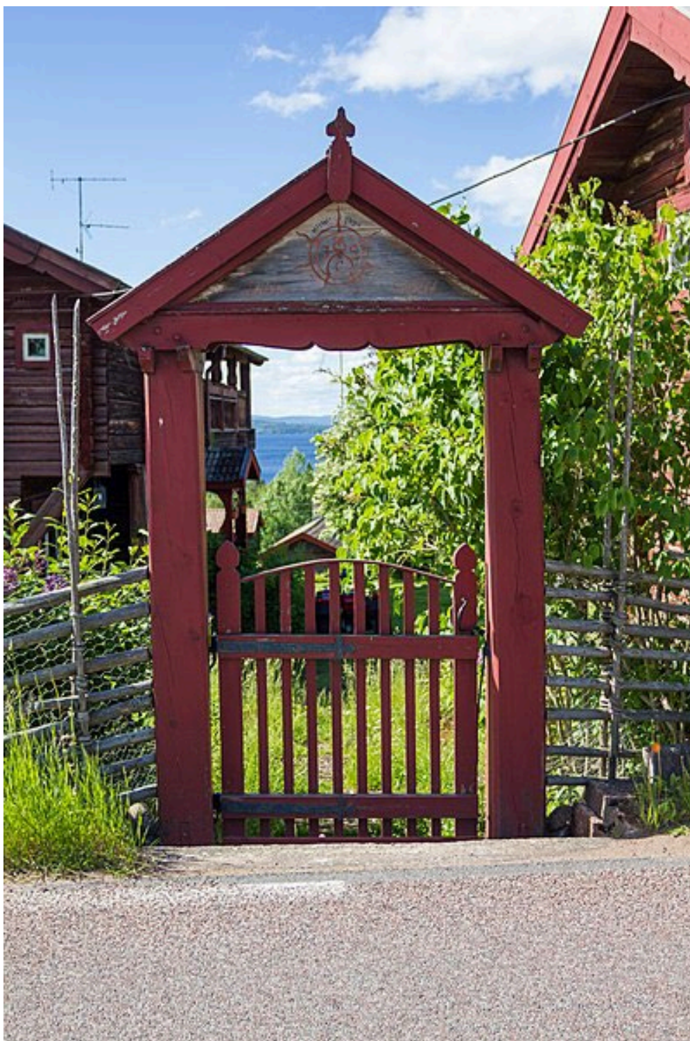
Figur 2. Grinden in till gården har texten Tång gårn 1909, J C S målade på överstycket.