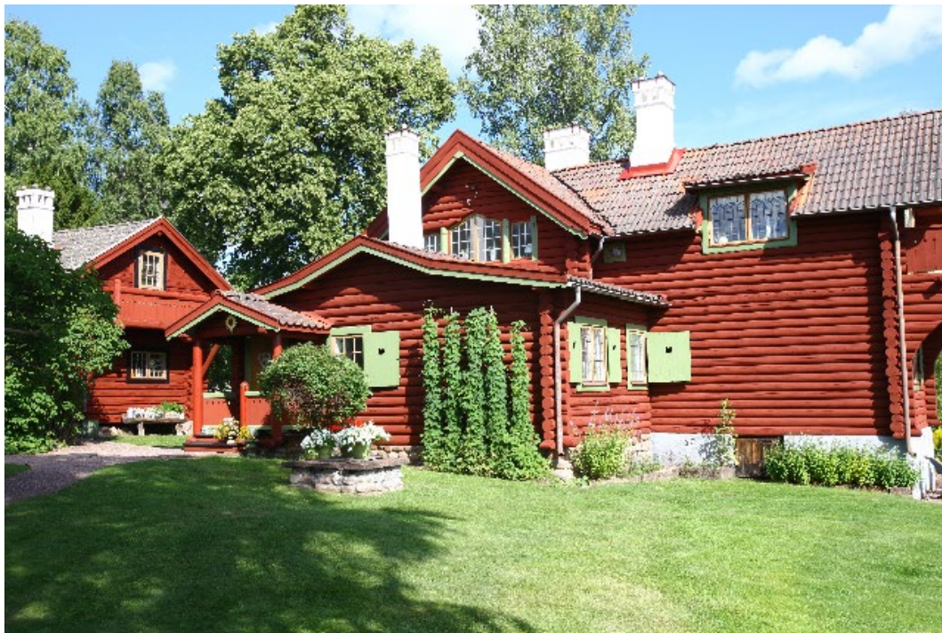
Figur 4. Fönstren är små med blyspröjsade rutor.