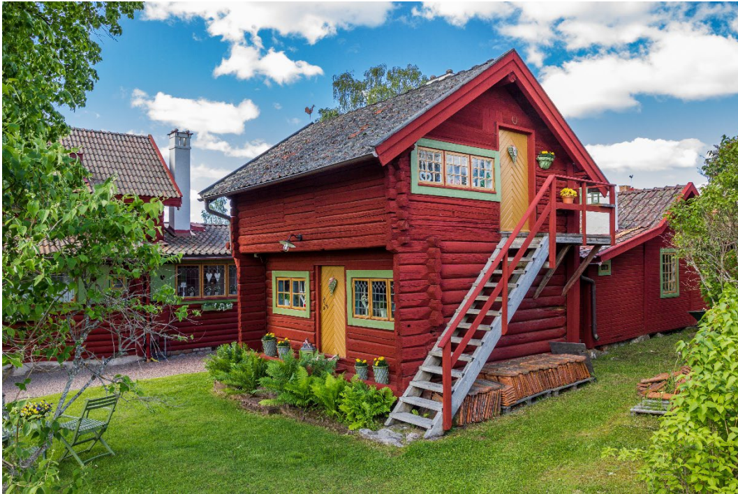
Figur 5. Inrett härbre.