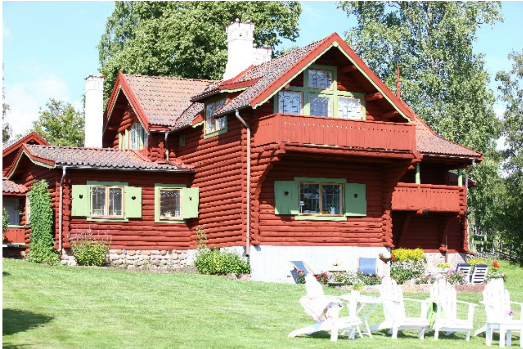
Figur 3. Huvudbyggnadens många takfall och vitkalkade skorstenar ger en pittoresk helhetsverkan.