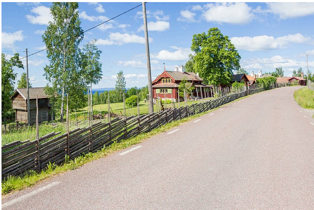
Figur 1. Byn Sjurberg där Solgården, med granngården Tånggården i bakgrunden, ligger.

Kring huvudbyggnaden på Solgården och östra delen av fastigheten breder en trädgård ut sig med gräsmattor, grusgångar och rabatter. Växligheten består bland annat av stora björkar och syrenbuskar. På sluttningen mot Siljan övergår trädgården till ängskaraktär och lövskog. Tomten omges i öster, väster och norr av en traditionell trägårdsgård.