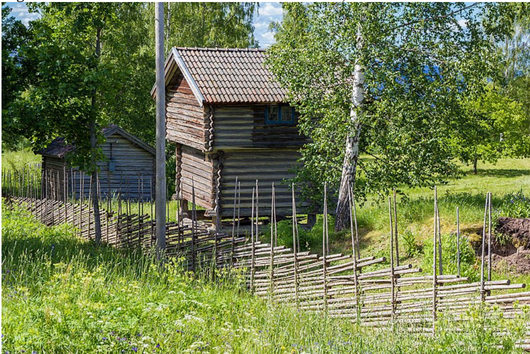
Figur 6. Gården omges av gärdesgård och det finns flera grånade timmerbyggnader på området.