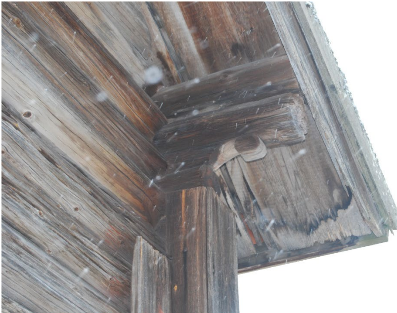
Figur 3. Dekorativt kavelkrus i härbrets nordöstra hörn.