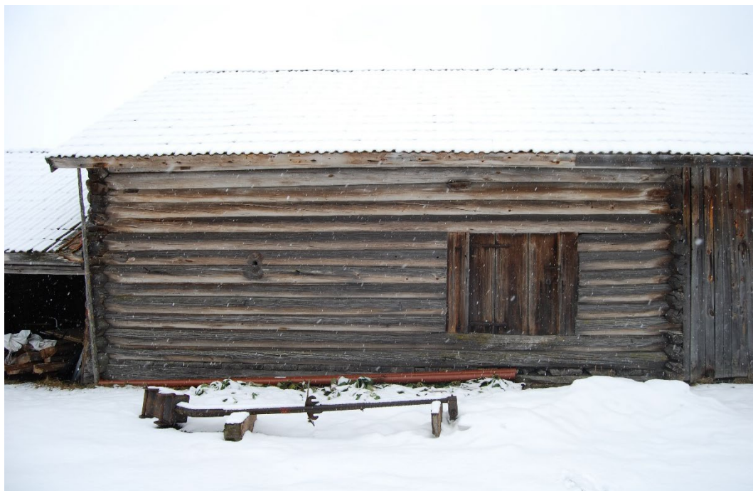
Figur 4. Trösklogen, daterad till 1600-tal.

På gavelväggens insida på den plats där ljuset faller in då dörren öppnas förekommer ett flertal skyddsbränningar.