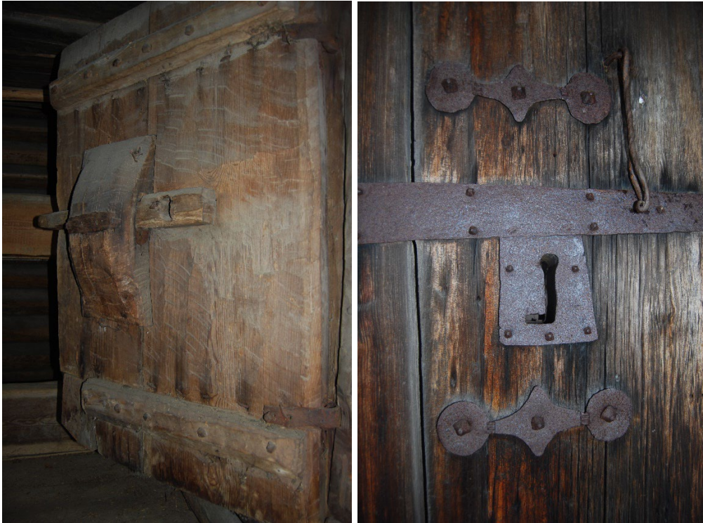
Figur 1-2. Bräddörren har bearbetats med sprättäljning, och detaljer såsom järnbleck och spik är typiska för medeltiden.