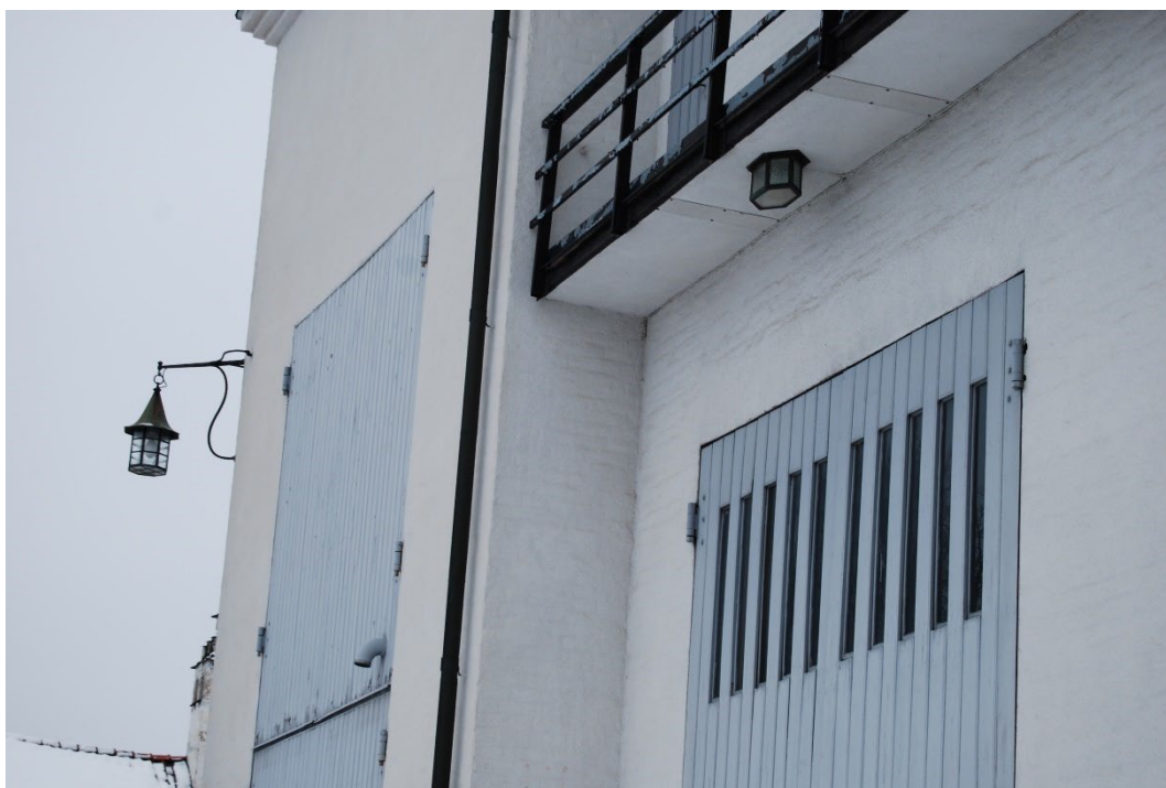
Figur 4. Byggnaden har många ursprungliga detaljer bevarade såsom armaturer och garageportar.