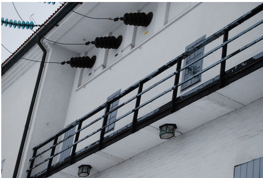
Figur 5. Utvändiga ursprungliga el-tekniska installationer och loftgångar.