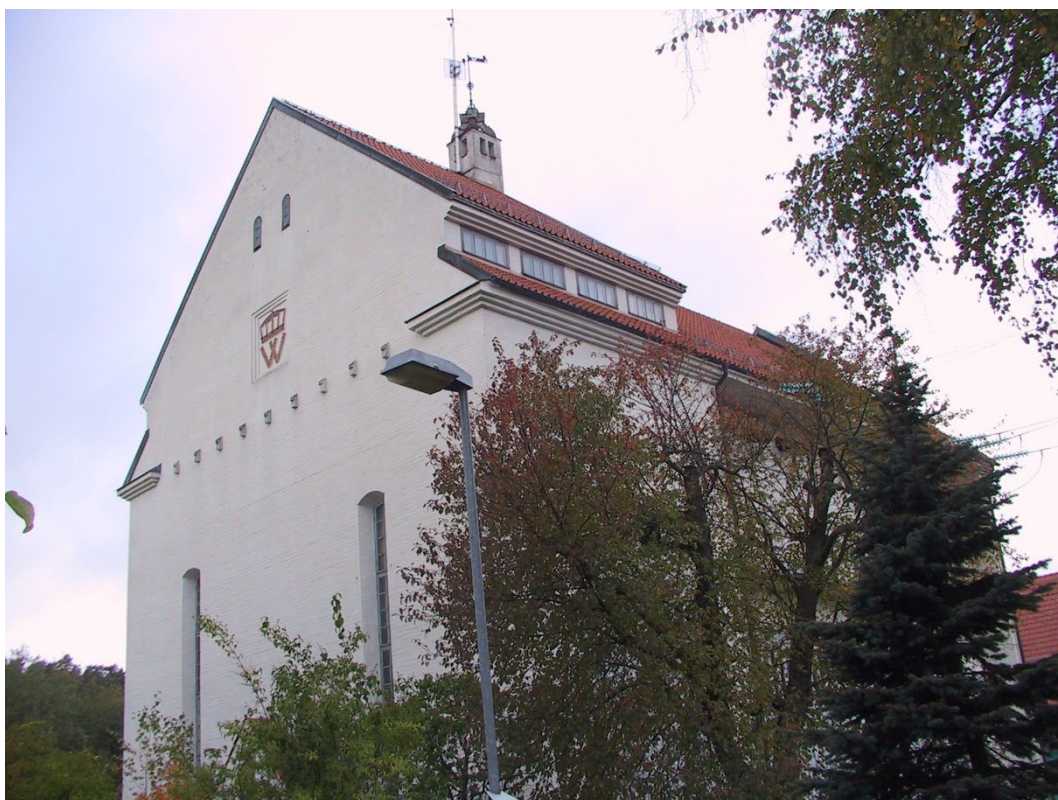
Figur 1. Södra gaveln med Vattenfalls symbol i tegel.