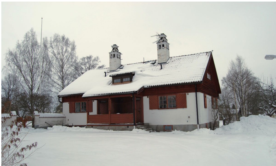
Figur 2. Byggnad med tjänstebostäder. Notera kronskorstenarna.