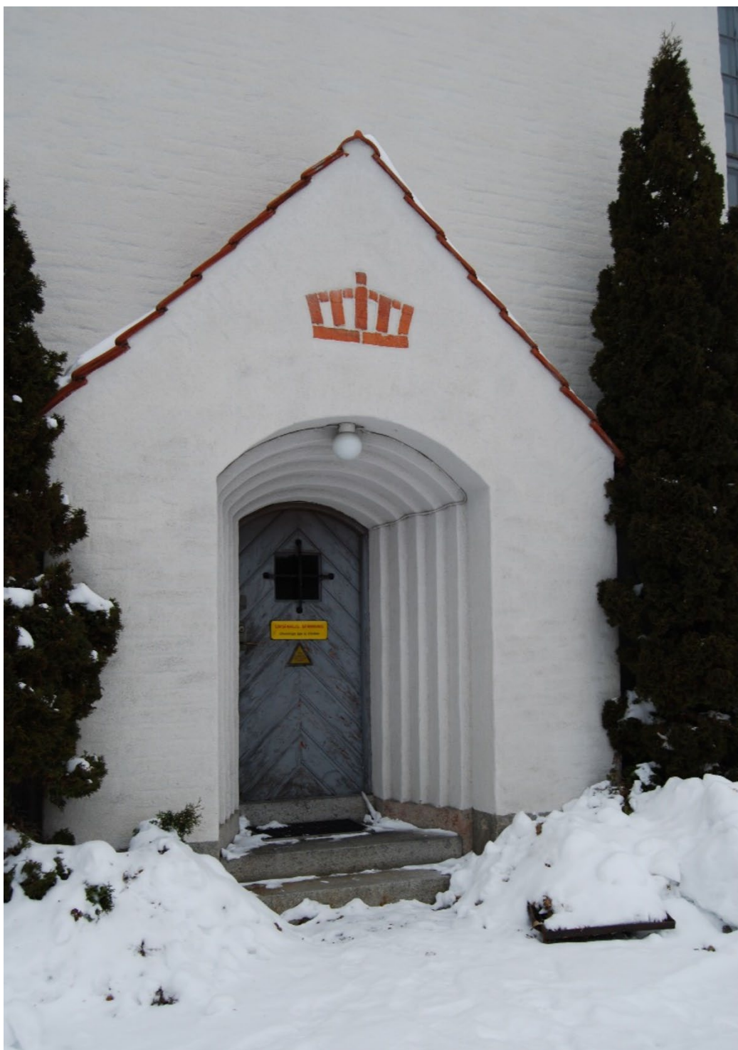
Figur 3. Personalingången på södra gaveln med prägel av medeltida vapenhus.