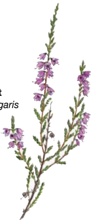
Heather Heidekraut Calluna vulgaris Ljung