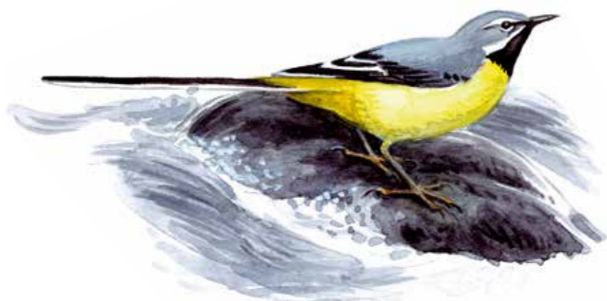
Grey wagtail Gebirgsstelze Motacilla cinerea Forsårla