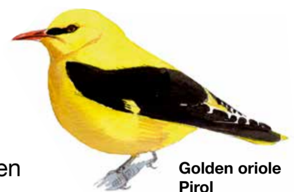
Golden oriole Pirol Oriolus oriolus Sommargylling

Uralte Kulturlandschaft. Die Heiden des Naturschutzgebietes sind Reste einer uralten Kulturlandschaft. Auf den trockenen Sandböden wurde jahrtausendlang Wanderackerbau mit langen Brachperioden betrieben, während denen das Brachland beweidet wurde. Diese