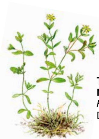
Trailing St John's Wort Niederliegendes Johanniskraut Hypericum humifusum Dvärgjohannesört

Species-rich fauna. In the autumn, a great number of butterflies are attracted to the nectar-rich heather flowers. The unique heaths provide habitat for many rare species, such as silver-spotted skipper and large blue. There are also many rare beetles. Golden oriole is a regular visitor to the beech forests in the reserve. Other colourful birds include common kingfisher and grey wagtail, which can be seen along the river Julebodaån.