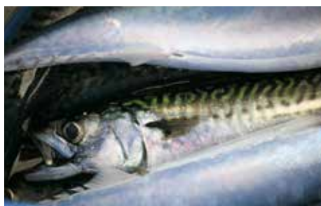
Gornja slika: morska pastrmka. Donja slika: skuša, bohus riba.

stalnim mestom boravka u Švedskoj podležu istim zakonima kao i državljani Švedske.