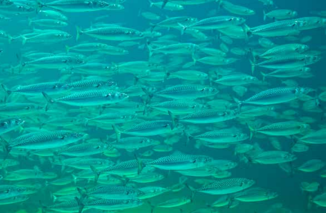
Jato skuša.