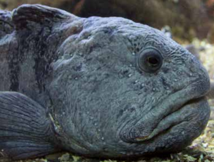
Ovih dana pojava soma u „Skagerrak“-u je neobična.

Kavez (vrša) smije se koristiti na vodnoj dubini plićoj od 30 m jedino ako je ista opremljena s najmanje jednim cirkularnim otvorom za bijeg s najmanjim dijametrom od 75 mm postavljenim u donjem kutu vanjskog zida svake pregrade. Ovo ne vrijedi za vrše za jastoge (vidjeti gore), ili za kaveze za ulov školjaka. Lov s kavezima na školjke smije se obavljati jedino nakon dozvole od starane upravne vlasti; Havs- och vattenmyndigheten.