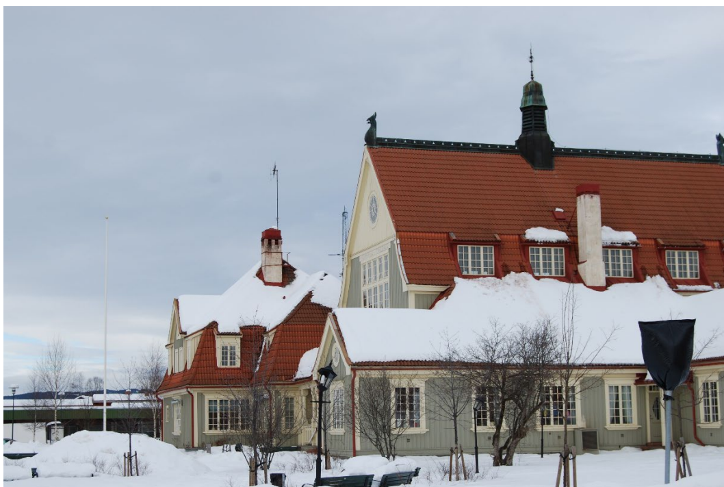
Figur 3. Tingshusets södra fasader.