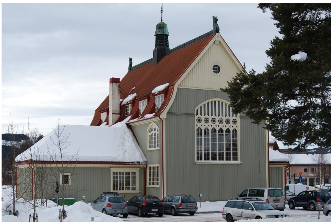
Figur 2. Tingshusets östra fasader.

Den nationalromantiska arkitekturstilen var ett rådande fenomen i Europa som påverkades av idéströmningar om nationalism, nationsbyggande och skapandet av nationella identiteter. Arkitekturen i Europa hämtade vid denna tid inspiration från gamla traditioner och nationella särarter.