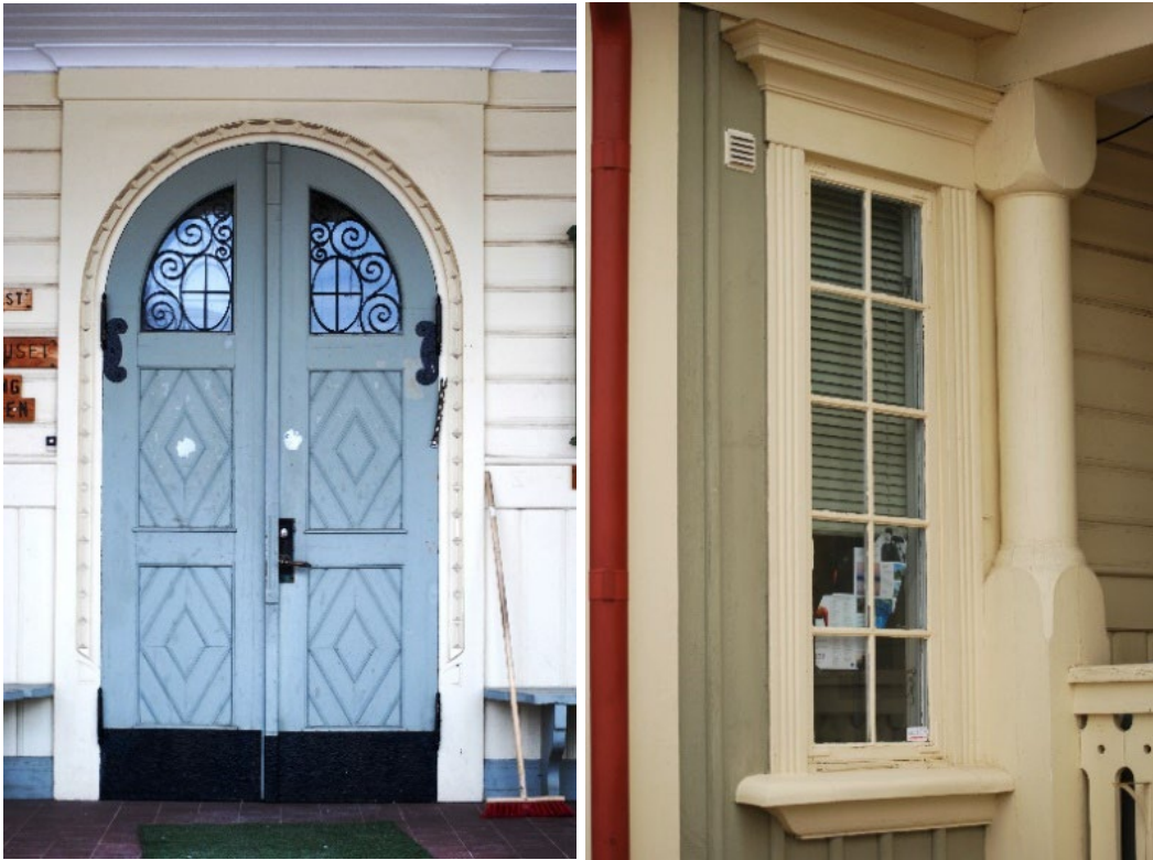
Figur 5 - 6. Fasadens snickerier är omsorgsfullt utformade.