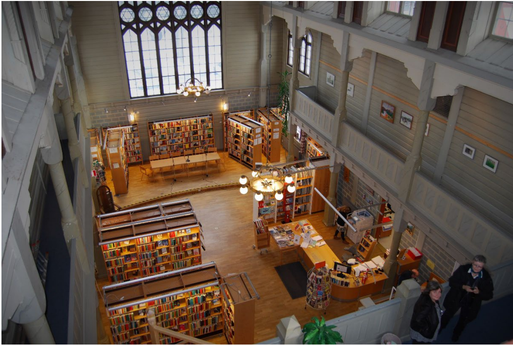
Figur 7. Interiör tingssalen.