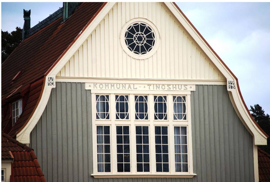
Figur 4. Västra fasaden. Brant takfall, lunettfönster i gavelröset.