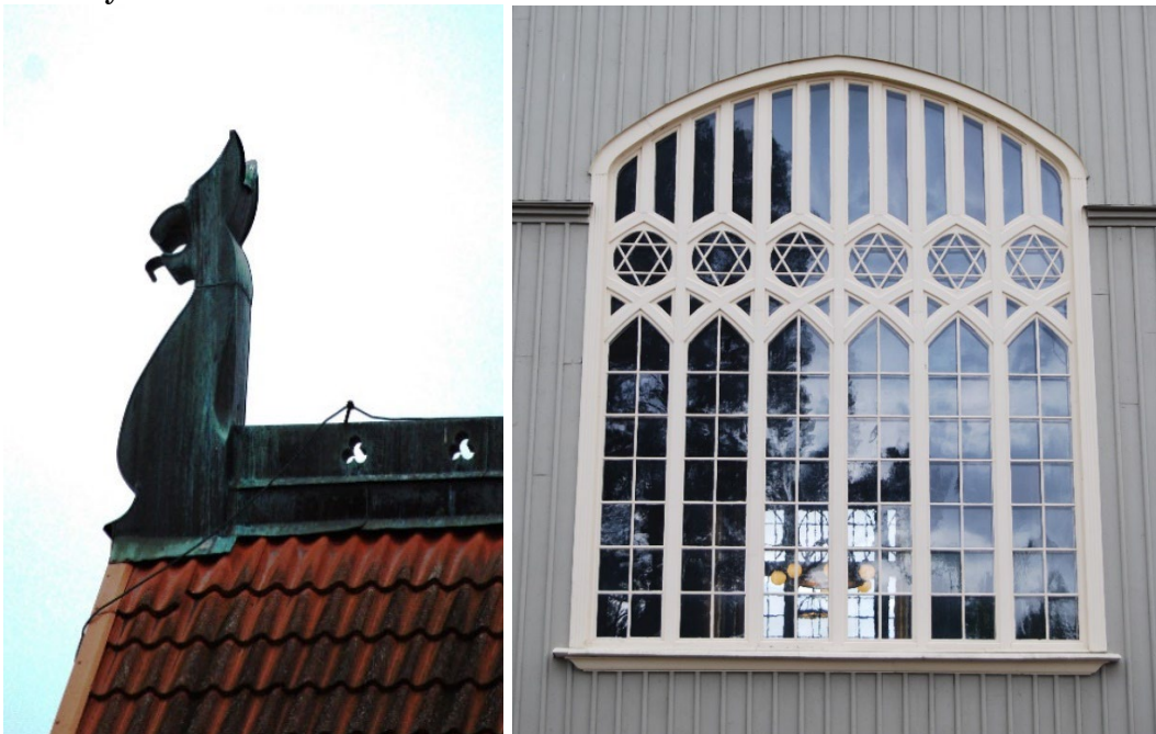
Figur 6 - 8. Stiliserad drake i koppar. Till höger tingssalens stora fönsterparti.