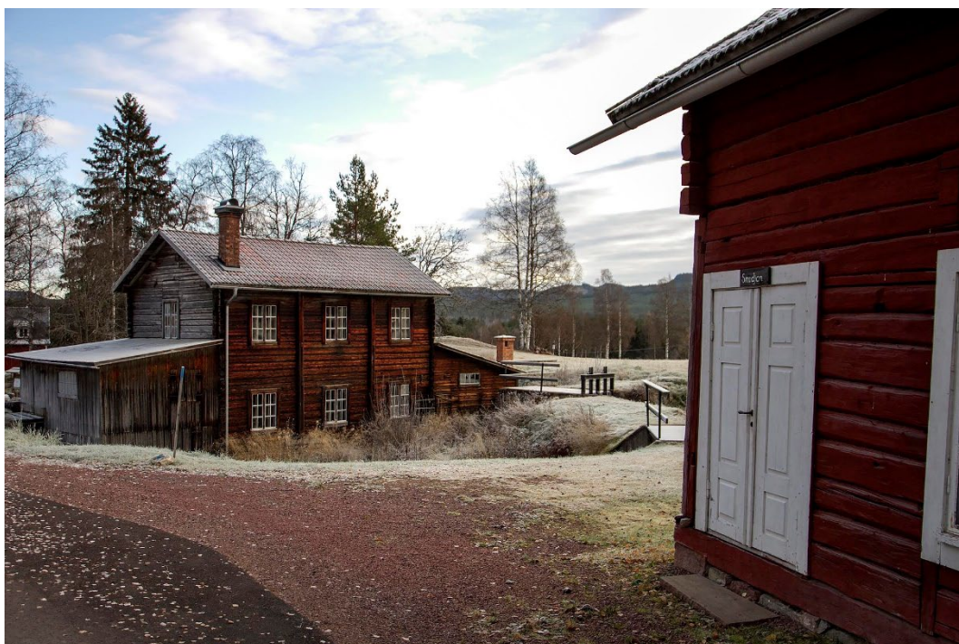
Figur 4. Smedjan till höger i bild, sliperiet i bakgrunden.