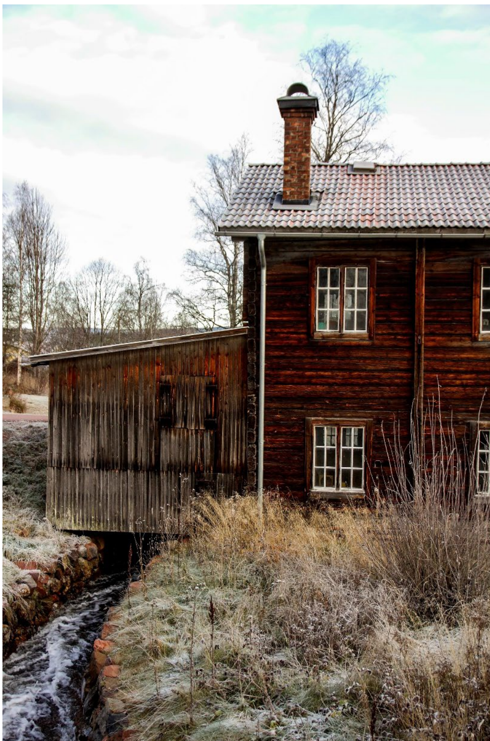
Figur 6. Sliperiets västra utbyggnad över kanalen.