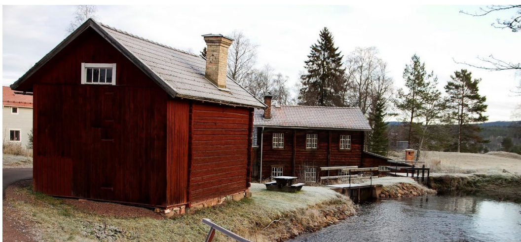
Figur 3. Sliperiet sett från söder, med dammen och smedjan i förgrunden.

Porfyrverket ligger i Västäng i utkanten av Älvdalens tätort, på Österdalälvens västra sidan. En förutsättning för sliperiets anläggande var den vattenkraft som kunde utvinnas ur Kuttbäckens forsande vatten. Närområdet präglas av skog och öppen åkermark, och bebyggelsen utgörs huvudsakligen av bostadshus och gårdar. Timmer- och trähus med sadeltak dominerar.