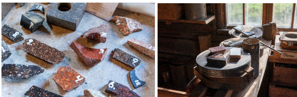
Figur 1 – 2. Interiörer från sliperiet.