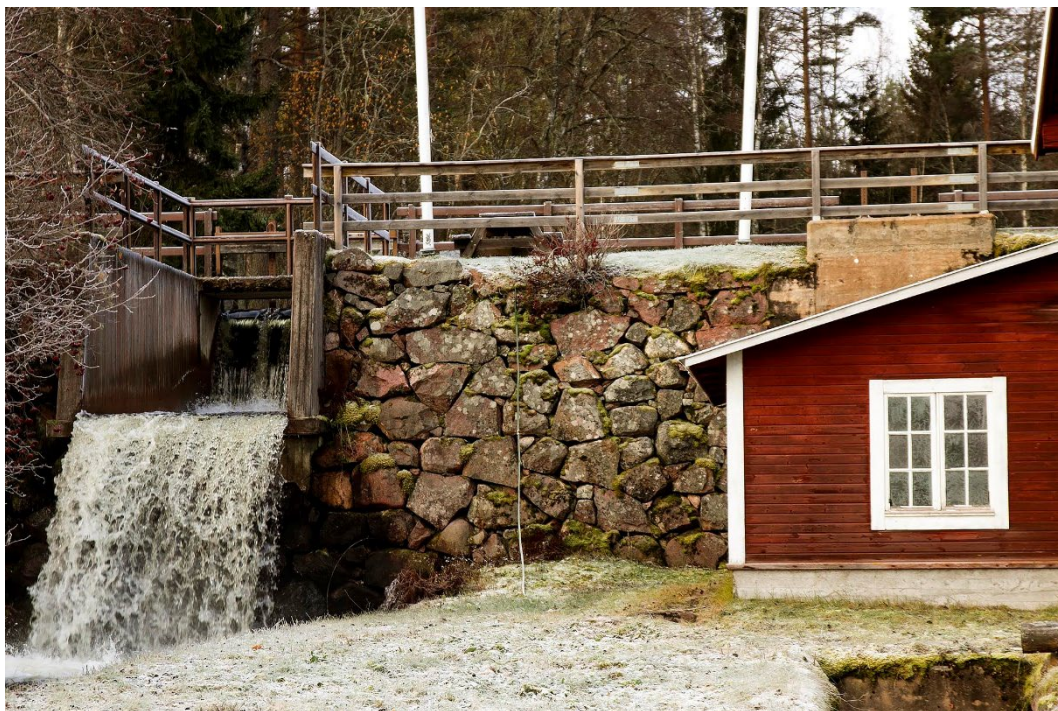
Figur 5. Dammen och del av kvarnbyggnaden.