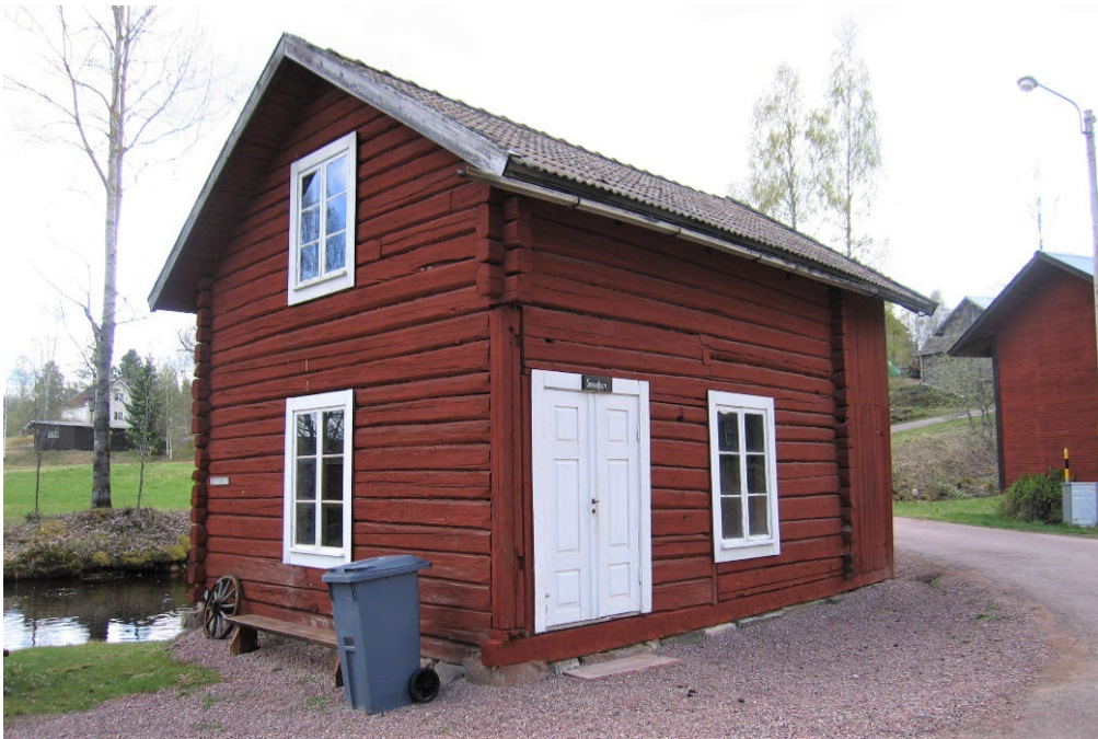
Figur 8. Smedjan. Länsstyrelsen i Dalarnas län