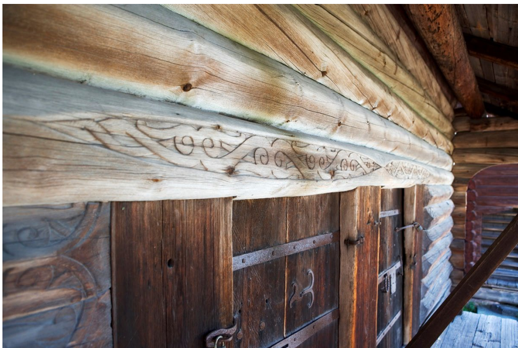
Figur 1. Sniderier på stocken ovan dörrarna på loftboden.

På både härbret och loftboden förekommer så kallad dalruneinskrift från äldre tid.