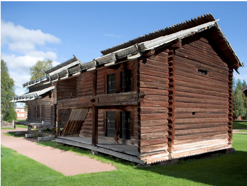
Figur 3. Loftboden.