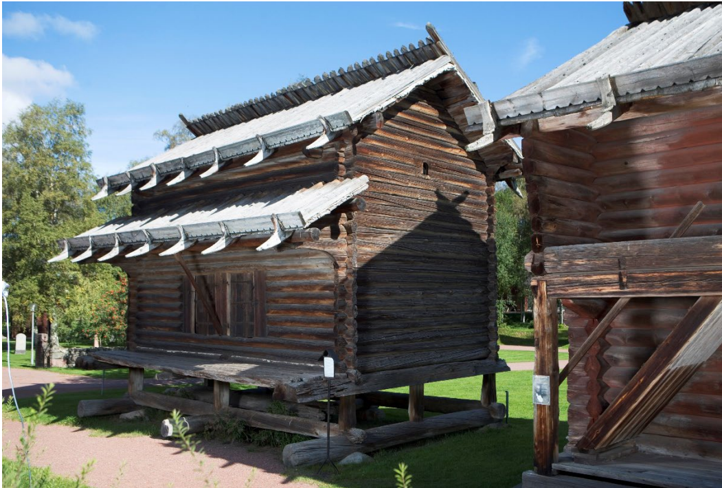
Figur 2. Kyrkhärbret till vänster i bild.