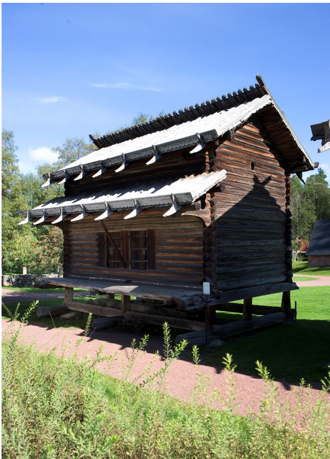
Figur 4. Kyrkhärbret sett snett framifrån. Till vänster skymtar muren till kyrkogården.