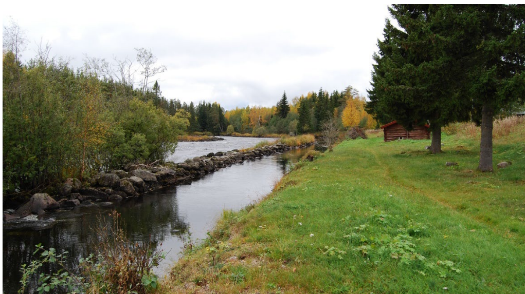
Figur 3. Vy från kvarnbyggnaden västerut.