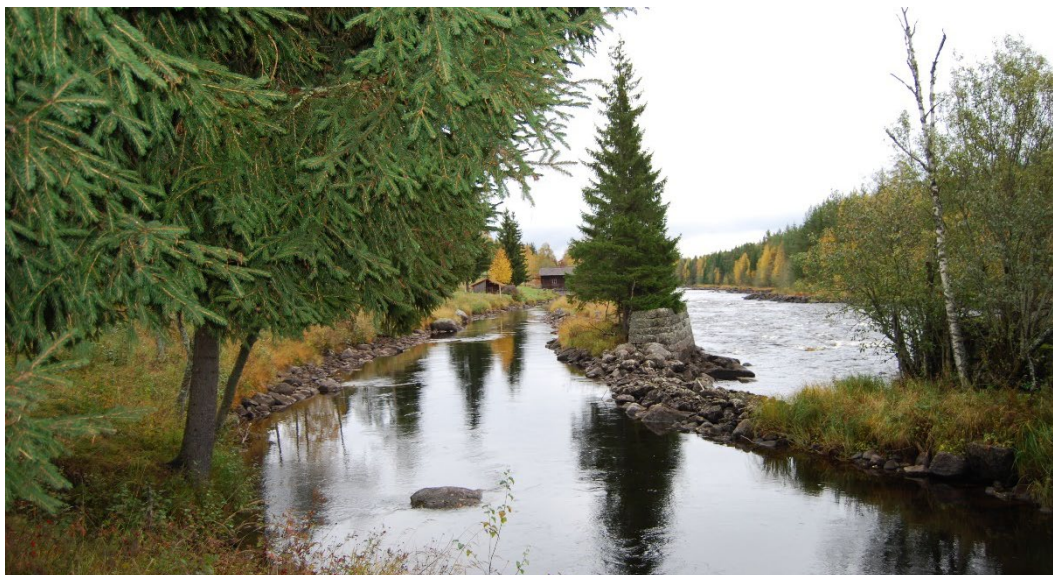
Figur 2. Tilloppskanalen som löper parallellt med älven.

Utanheds såg och kvarn är placerad precis intill Västerdalälven som här bildar Utanhedsforsen. En tilloppskanal parallellt med älven, ca 300 meter lång och fyra meter bred anlades för att leda vattnet till kvarnbyggnaden.