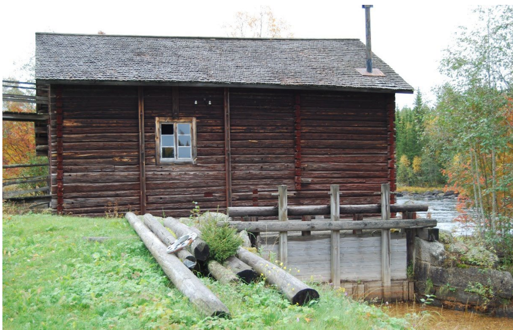
Figur 6. Kvarnhusets västfasad med dammluckorna och tilloppskanalen.