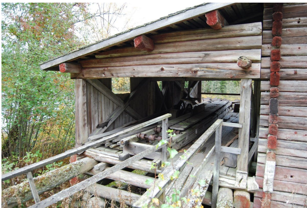
Figur 5. Såghuset på kvarnens östra sida.