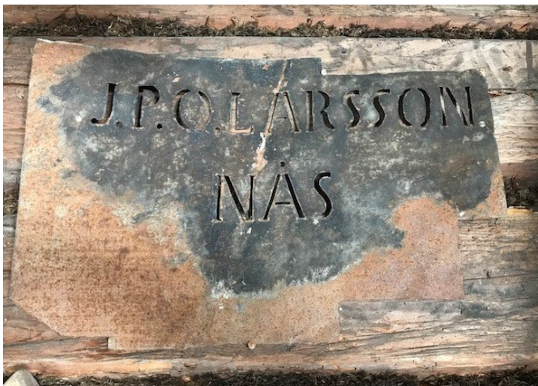
Figur 1. En bevarad skylt ingår i kvarnens inventarier.

Åren 1984–1986 genomfördes en omfattande restaurering med medel beviljade av Riksantikvarieämbetet. Efter restaureringen kunde man åter mala mjöl i kvarnen. Även 2020 genomfördes en större restaurering av byggnaden, där bland annat taket byttes.