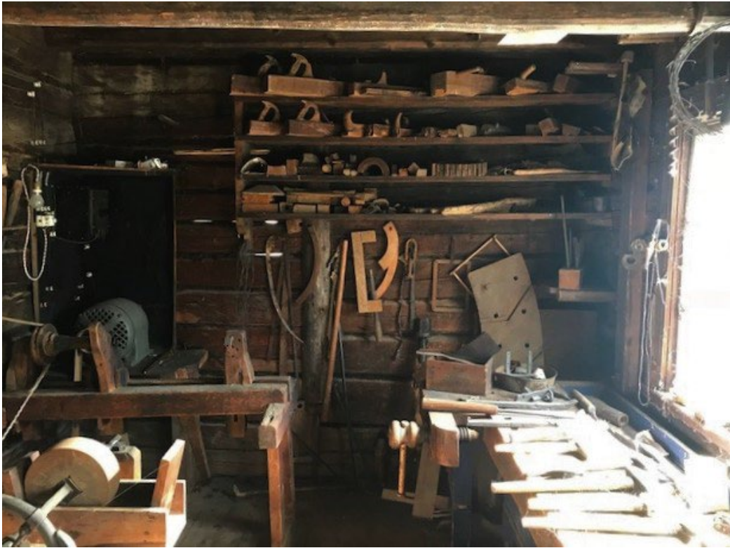
Figur 7. Snickeriverkstaden.