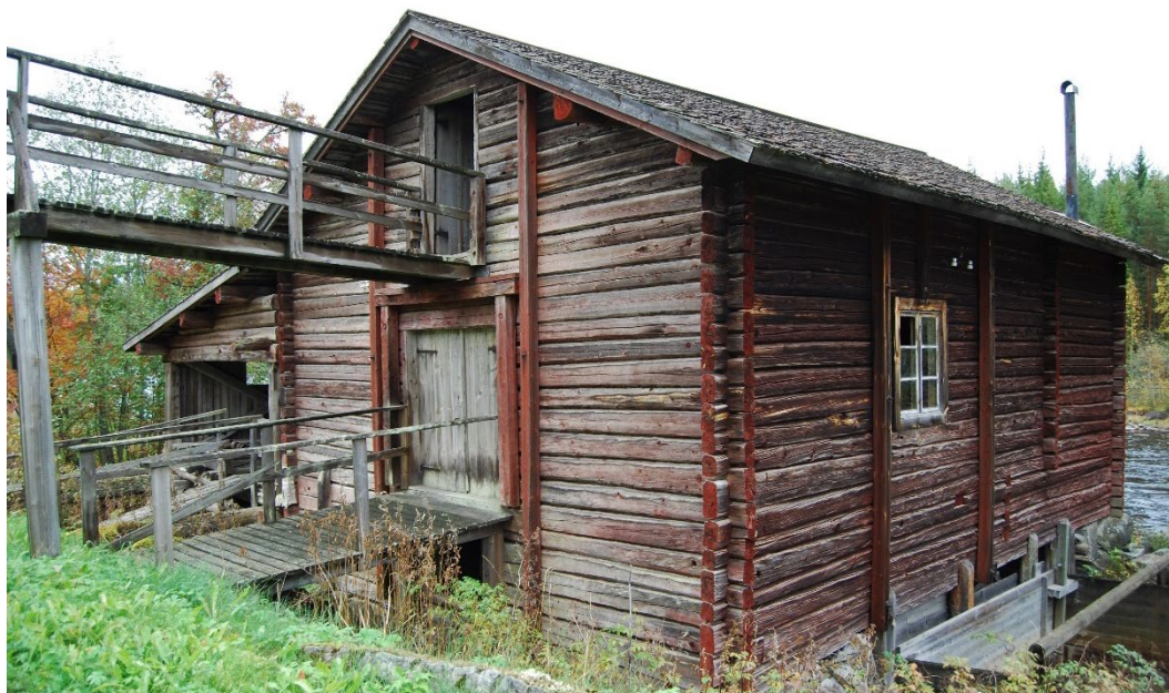
Figur 4. Kvarnbyggnadens norra gavel.

Mitt emot kvarnarna finns delar av hjulmakeriverkstad, en riktbank för vagnshjul kvar som vittnar om att annan verksamhet också förekommit här. I själva kvarnlokalen finns också en ramsåg upphängd i taket som kan sänkas ner och användas vid snickeriarbeten.