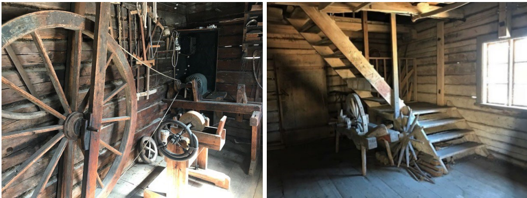
Figur 8-9. Kvarnbyggnadens interiör.