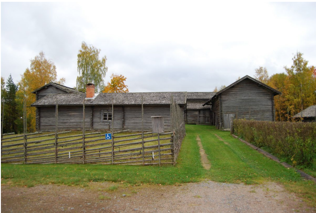
Figur 3. Lisskvarngårdens slutna fyrkantsform sedd från parkeringen.

Lisskvarngårdens mangårdsbyggnad utgörs av en envånings parstuga, och det finns också pig- och drängstuga i två våningar, ett dubbelloft med härbre samt stall och portlider och höskulle. Det finns också en källarstuga med ytterligare ett portlider och ett fristående stolphärbre. Alla byggnader på gården är knuttimrade och omålade. Samtliga har pärt- eller brädtak.