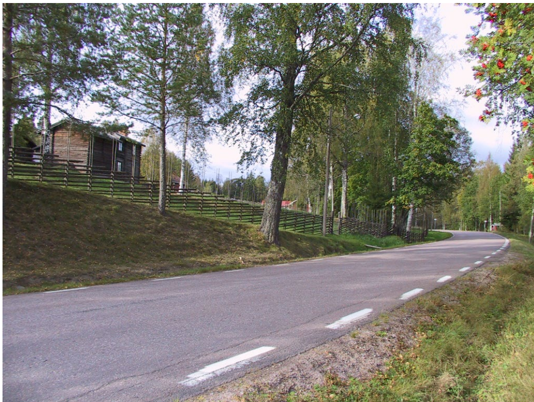
Figur 2. Lisskvarngården sedd från väg 533.

Malmsta där Lisskvarngården ligger är beläget mellan sjön Stor-Nåsen och Västerdalälven, på den västra stranden. Bebyggelsen i området är väl samlad med åkermarken ned mot älven. Kontakten med älven och de öppna fälten präglar kulturlandskapet. Malmsta-Kvarnnäset utgör en väl bibehållen bymiljö, där särskilt Lisskvarngården bidrar till områdets ålderdomliga och genuina prägel. Gården ligger i ett karaktäristiskt läge på en höjd och väl exponerat från väg 533.