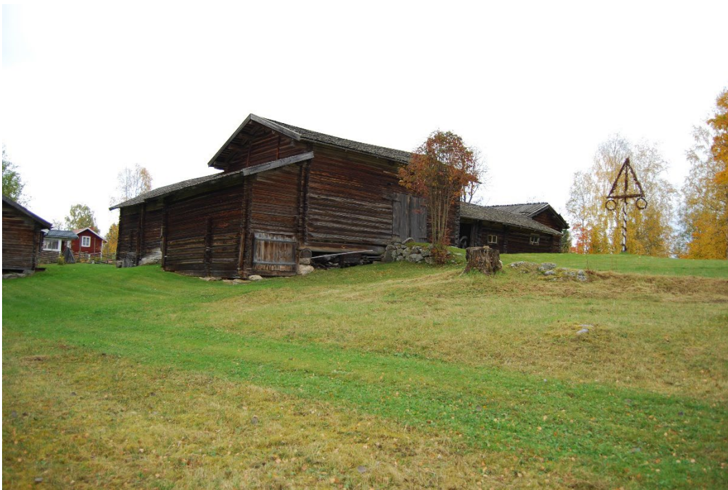
Figur 1. Lisskvarngården sedd snett nedifrån vägen.

Lisskvarngården uppfördes kring sekelskiftet 1700. Samtliga byggnader, utom den på 1970-talet rekonstruerade ladugården, stod färdiga 1702. Virket är dendrokronologiskt daterat till 1695. Gården är en välbevarad ålderdomlig kringbyggd gård i sluten fyrkantsform. Den var fram till 1950-talet fortfarande bebodd och i drift. Gården består av tio byggnader varav åtta på ursprunglig plats. På gården förvaras Nås Hembygdsgilles samlingar, ca 800 föremål.