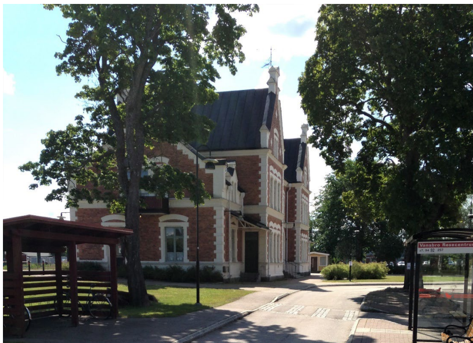
Figur 2. Stationshuset omges av träd, och nya tillägg i stationsmiljön ses i förgrunden.

Vansbro stationshus ligger på Järnvägsgatan i centrala Vansbro invid bangården. Närmiljön utgörs av ett karaktäristiskt järnvägssamhälle från sekelskiftet 1900, med enhetlig och tidstypisk affärshusbebyggelse. Det finns också ett bevarat magasin och lokstallar på området.