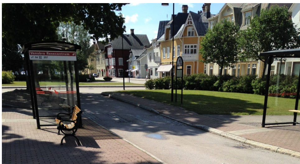
Figur 3. Bebyggelsen kring stationshuset, typisk för järnvägssamhällen uppkomna i slutet av 1800-talet.