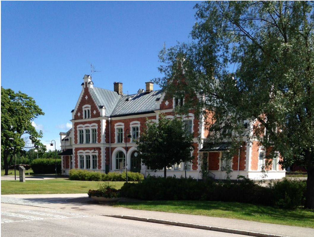
Figur 6. Stationshuset ligger indraget från gatan med en liten park framför, vilket förstärker intrycket av dess betydelse i samhället vid tiden för uppförandet.

Vansbro station uppfördes 1899 i nyrenässansstil, i rött tegel med vita putsorneringar. Byggnaden gavs en påkostad och monumental gestaltning som speglar Vansbros betydelse som järnvägsknutpunkt vid sekelskiftet 1900. Från början inrymde stationen telefonväxel, telegraf och poststation såväl som gods- och biljettexpedition. Byggnaden fick flera väntsalar och bostad åt stationsinspektör och konduktörer. Idag finns tre äldre väntsalar bevarade.