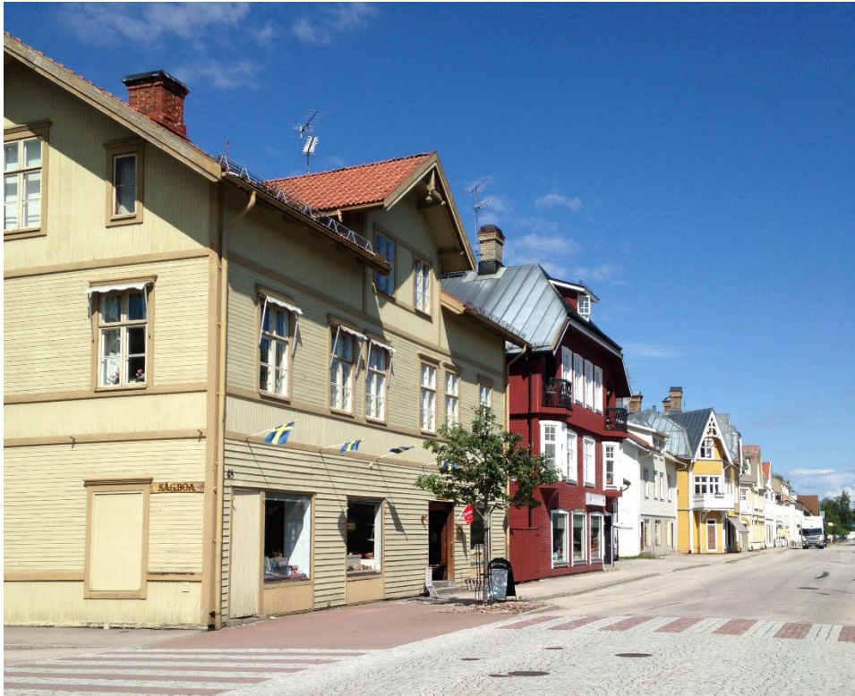
Figur 4. Järnvägsgatan i Vansbro kantas av affärshusbebyggelse från 1800- och 1900-talet.