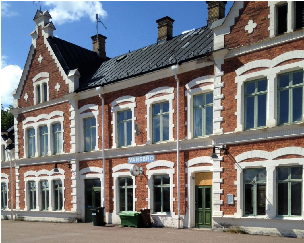
Figur 1. Stationshuset invigdes 1899.

Vansbro stationsbyggnad blev statligt byggnadsminnesmärke enligt beslut av regeringen 1975.05.15. Skyddsföreskrifter för byggnadsminnet, enligt förslag av Riksantikvarieämbetet, beslutades av regeringen 1990.03.22. Ägandet av området har härefter övergått från Staten till Vansbro kommun.