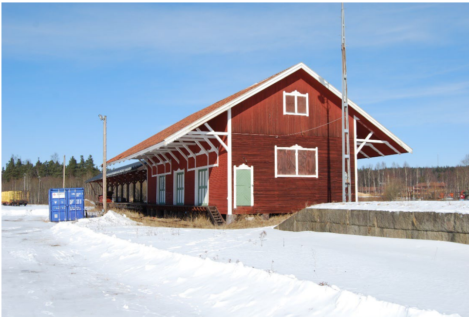
Figur 5. Ett bevarat magasin inne på bangården. Inte del av byggnadsminnet.