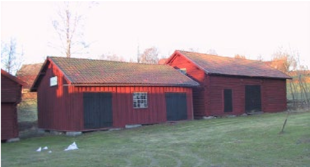
Figur 1. Äldre ekonomibyggnader kring gårdsplanen.

Kaplansgården i Stora Skedvi som ligger vid Dalälvens strand, ingår som en viktig del av miljön kring Stora Skedvi medeltida kyrka. Till den ursprungliga Kaplansgården finns några omgivande uthusbyggnader bevarade.