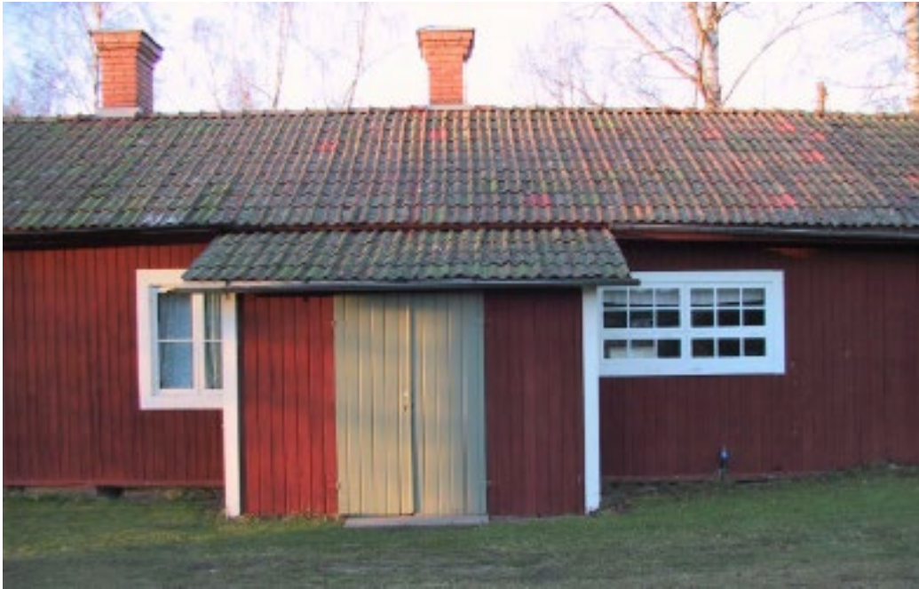
Figur 6. Ekonomibyggning på Kaplansgården.