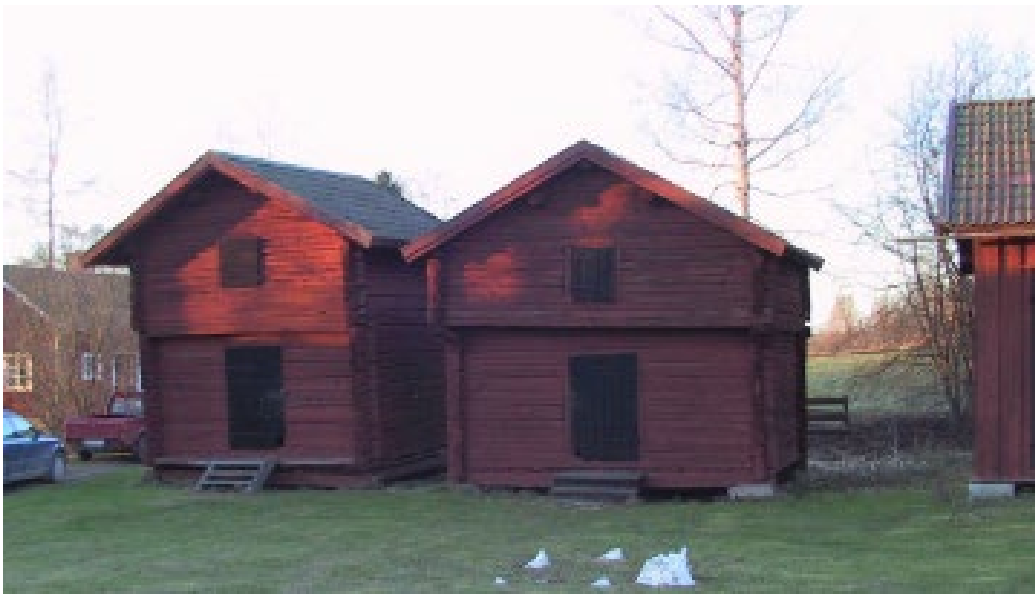
Figur 7. Gårdens två timrade härbren.