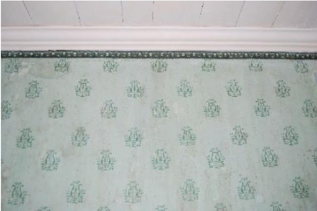
Figur 4. Den nytryckta tapeten efter äldre förlaga. Notera äggstavslisten.