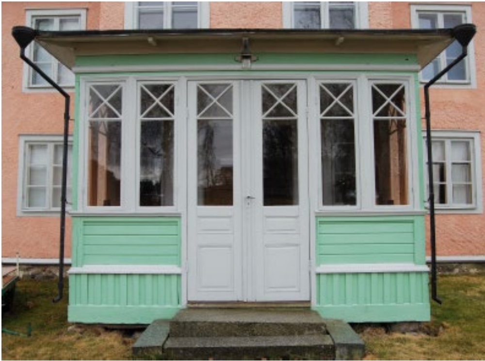
Figur 2. Glasverandan.