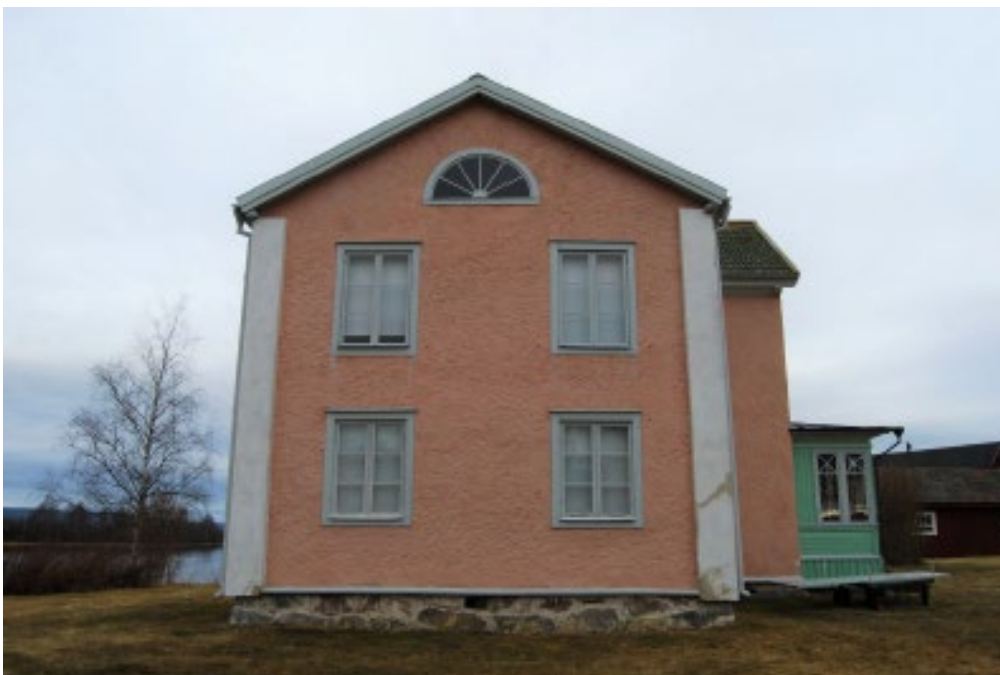
Figur 3. Huvudbyggnadens södra gavel. Notera blindfönstret under nocken.