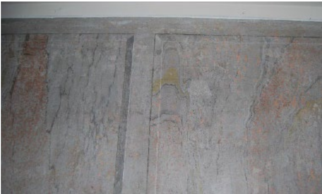
Figur 5. Framtagna ursprungliga marmorerade väggfält i övervåningens förstuga.