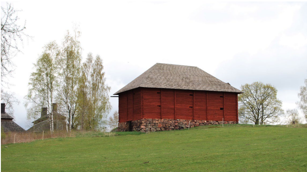
Figur 3. Magasinet ligger isolerat från gårdsbildningen vid huvudbyggnaden.