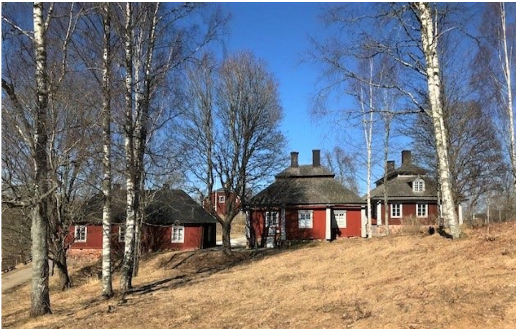
Figur 2. Herrgårdsanläggningen sedd från söder: från höger huvudbyggnad, köksflygel, handlarbostad.

Den karolinska herrgårdsanläggningen dominerar omgivningen genom den upphöjda placeringen på en grusås. Den utgör ett gott exempel på sin tids herrgårdsarkitektur, som präglas av både inhemska och europeiska influenser. Fördämningarna och de olika vattennivåerna i Hedströmmen visar kopplingen mellan herrgården och bruket. Bron mitt emot manbyggnaden ingår som en del i en axiell komposition av hela anläggningen. Gårdsanläggningen är symmetriskt uppbyggd.