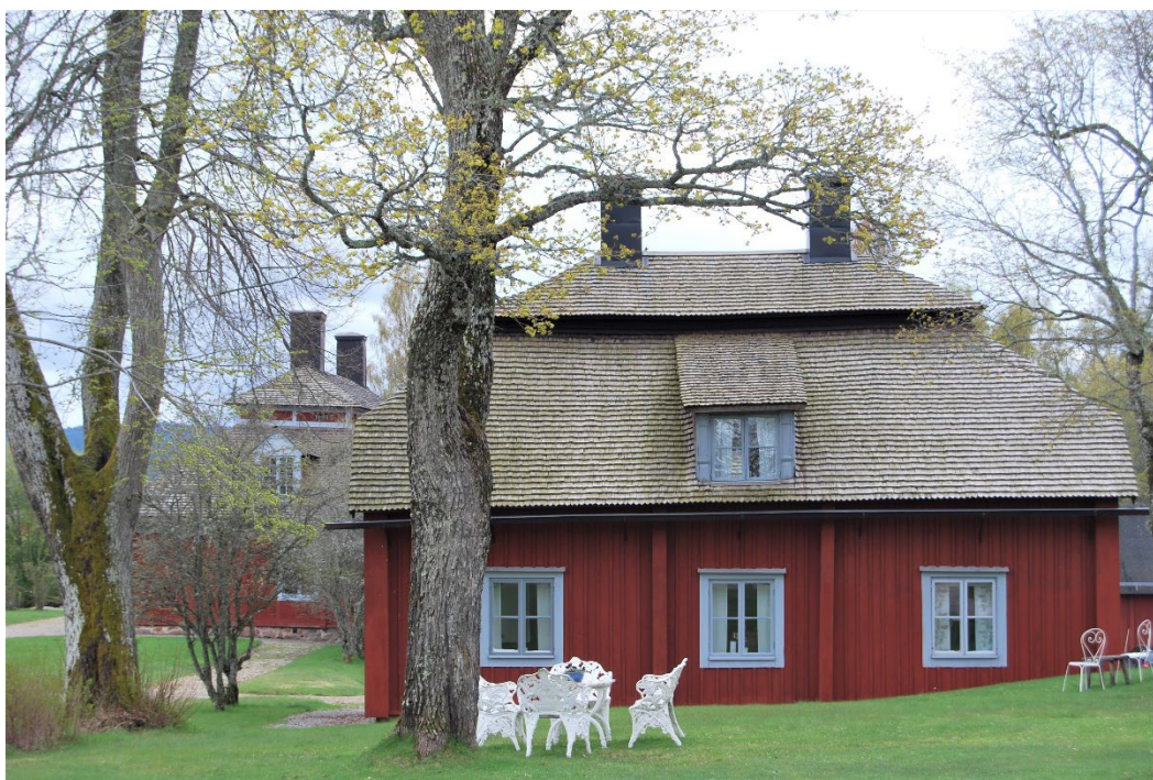
Figur 1. Professorsbostaden, byggnad nr 4. I bakgrunden skymtar huvudbyggnaden. Foto: Länsstyrelsen i Dalarnas län.