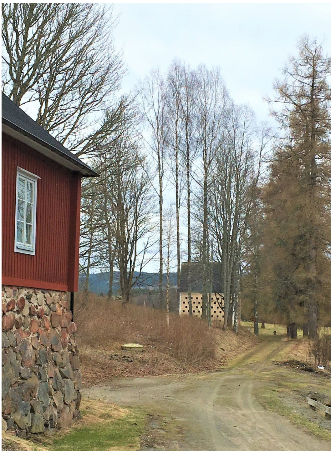
Figur 4. Kornskruven ligger intill vägen på en åker, även den isolerad från övrig bebyggelse på anläggningen. Länsstyrelsen i Dalarnas län.