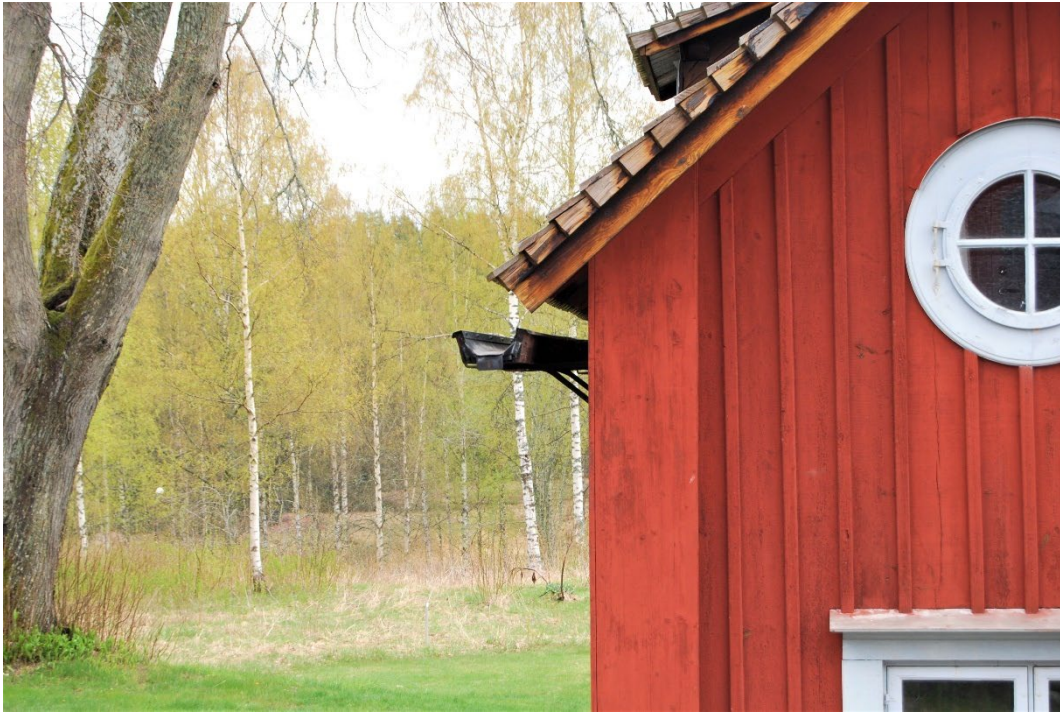
Figur 2. Byggnaderna har tjärade spåntak.