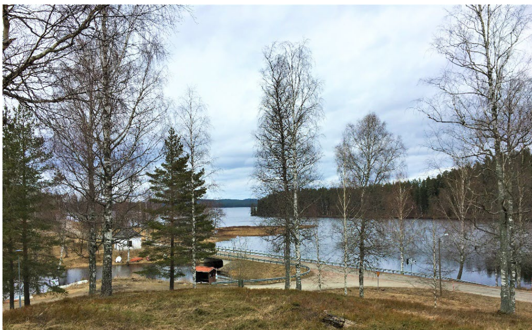
Figur 1. Arkivet skymtar bakom träden. Områdets vattendrag var en förutsättning för etableringen av bruket.

1935 blev Malingsbos herrgårdsanläggning statligt byggnadsminne. 2018 fick byggnadsminnet reviderade skyddsbestämmelser, inför försäljning. Idag är Malingsbo ett privatägt byggnadsminne.