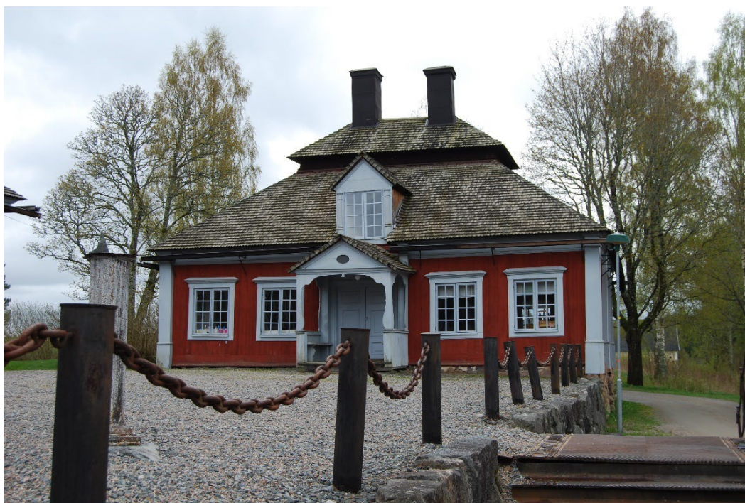
Figur 3. Köksflygeln, välbevarad sedan uppförandet på 1700-talet.