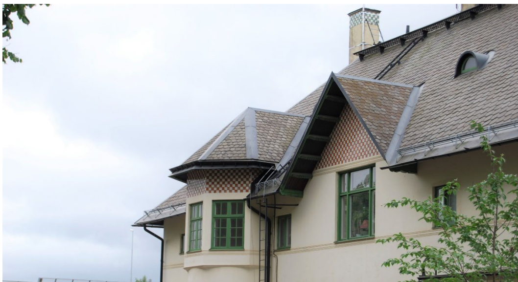
Figur 2. Skiffertaket med takutsprång och lunettfönster samt de dekorativa gavelfälten i rött och vitt.