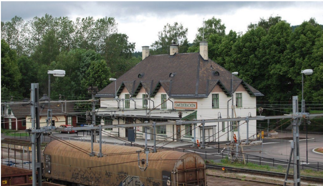
Figur 1. Stationsbyggnaden med bangården i förgrunden, avträdeshus och bodlänga till vänster. Stationsplan bakom huset.

Smedjebackens järnvägsstation är belägen söder om Kolbäcksås. Stationen omfattar stationshus, avträdeshus, bodlänga och bangård samt ett lokstall i den västliga delen av bangården. Stationsplan avgränsas av en enkelsidig allé mot en sluttning i norr. Tidigare har även funnits ett godsmagasin, som flyttats till Smedjebackens hamn. Ett ställverk, vattenhäst och en järnvägsstationspark är borttagna.