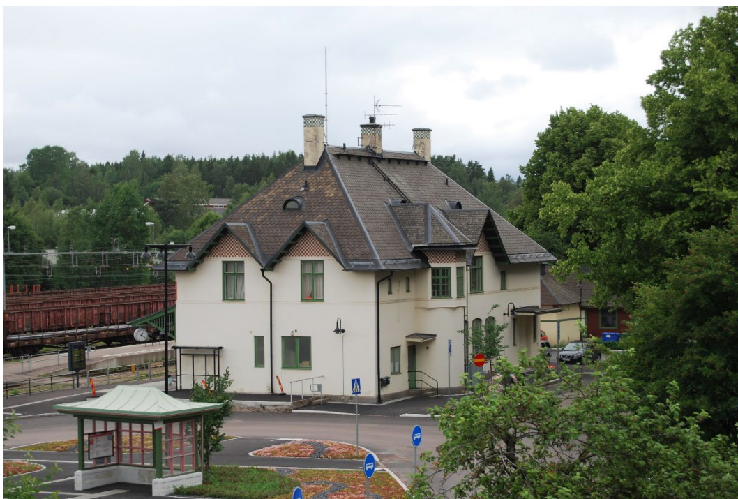
Figur 2. Stationshusets baksida med de två skärmtaken och stationsplan framför.