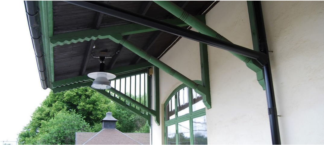
Figur 3. Skärmtakets delvis svarvade snedsträvor.