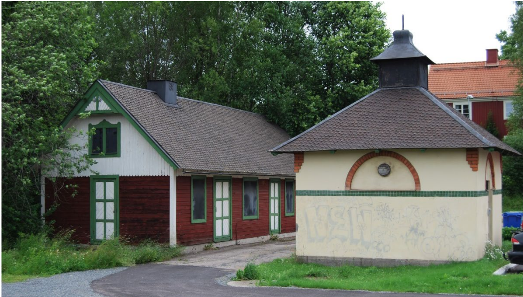
Figur 6. Till vänster bodlängan i tidsenlig panelarkitektur, med figursågade fönsteromfattningar och skiffertak. Till höger det slätputsade avträdeshuset med tälttak och lanternin.