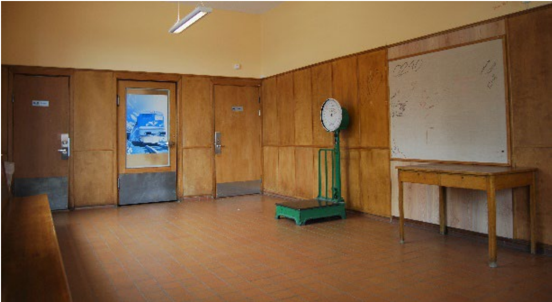
Figur 4. Bevarad inredning från 1940-talet i väntsalen.