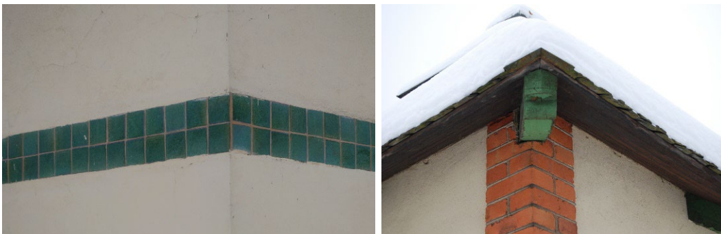
Figur 7-8. Den gröna kakelbården och taksparrarna på avträdeshuset.