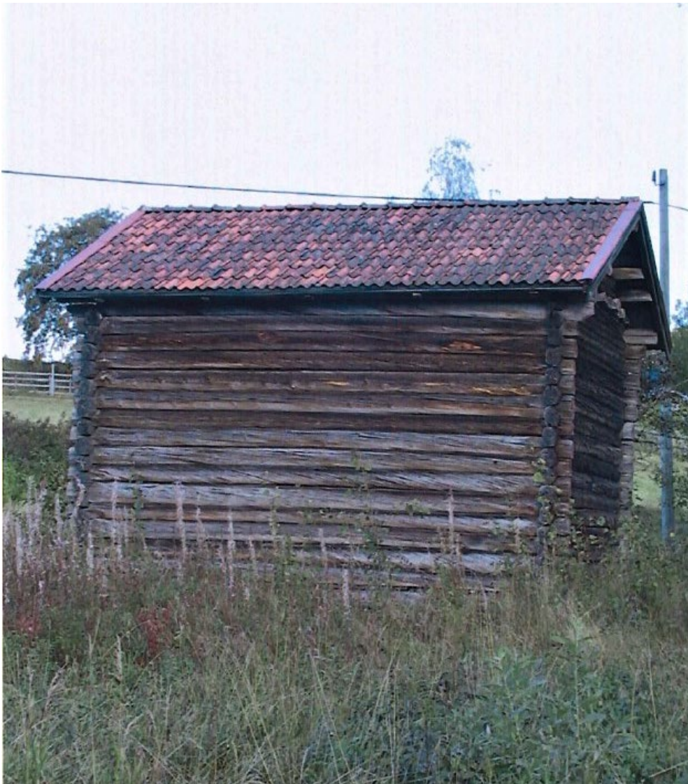
Figur 2. Rian är timrad med 17 stockar i långsidorna.

Timret på insidan är i stort sett naturligt rundat, men i vissa partier bilat några stockvarv uppåt från golvet. Eldstaden finns inte kvar, men det är uppenbart var den en gång funnits. Högt uppe vid rösten finns öppningar för röken att ta sig ut. Halsningen i knutarna är kort och skallarna sexkantiga, även om den ej är så tydlig. Knutarna har en karaktär av 1600-tal.