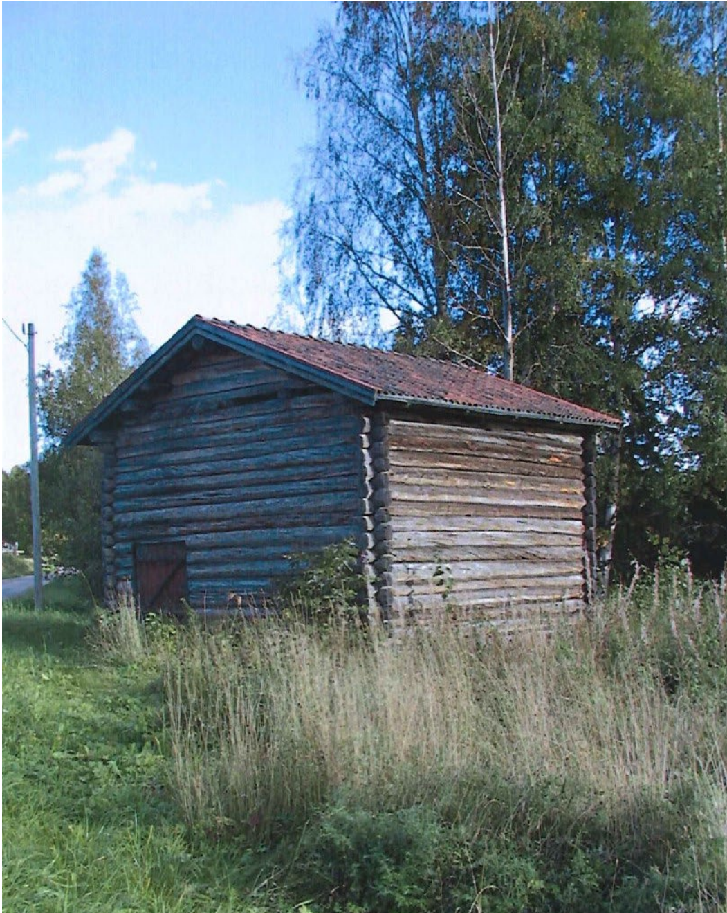
Figur 1. I röset syns öppningar för röken att ta sig ut. Byvägen skymtar till vänster om rian.

Ria tillhörande Klockargården i Bingsjö. Byggnaden står enligt uppgift på ursprunglig plats men finns dock ej markerad på storskifteskartan från 1828. Rian är belägen i anslutning till gårdens byggnader och avskiljs genom byvägen som löper dem emellan.