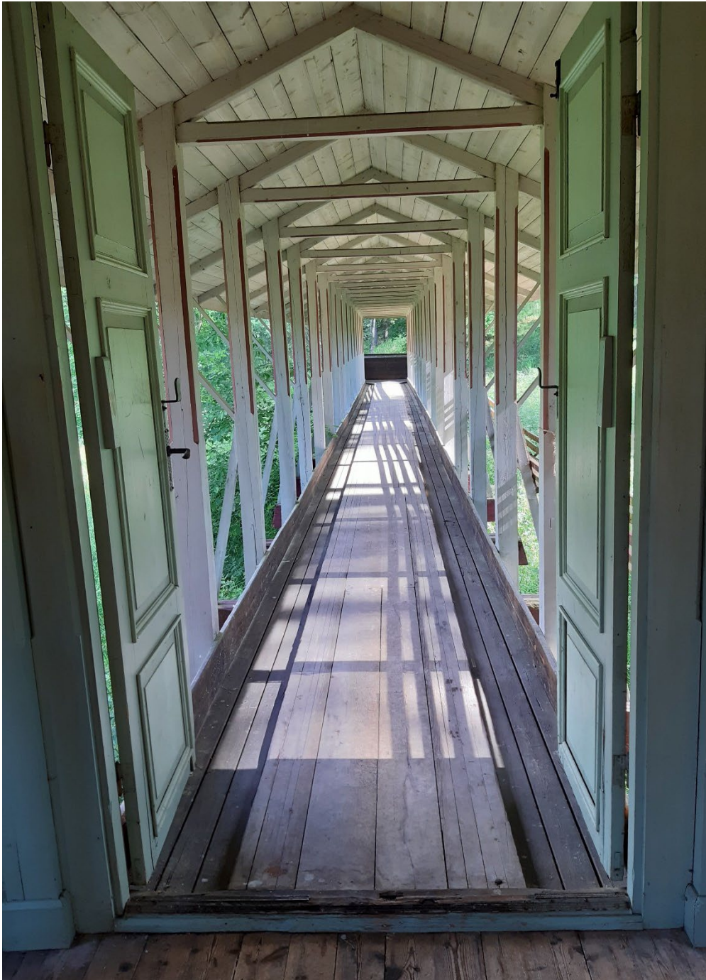
Figur 2. Slagbanan sedd från paviljongen.