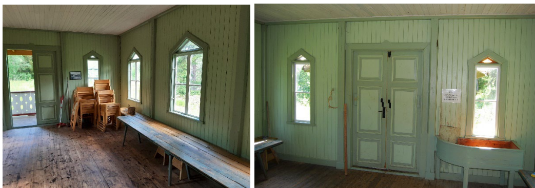
Figur 6. (Vä) Paviljongens interiör präglas av en grön färgskala. Väggarna är beklädda med panel.