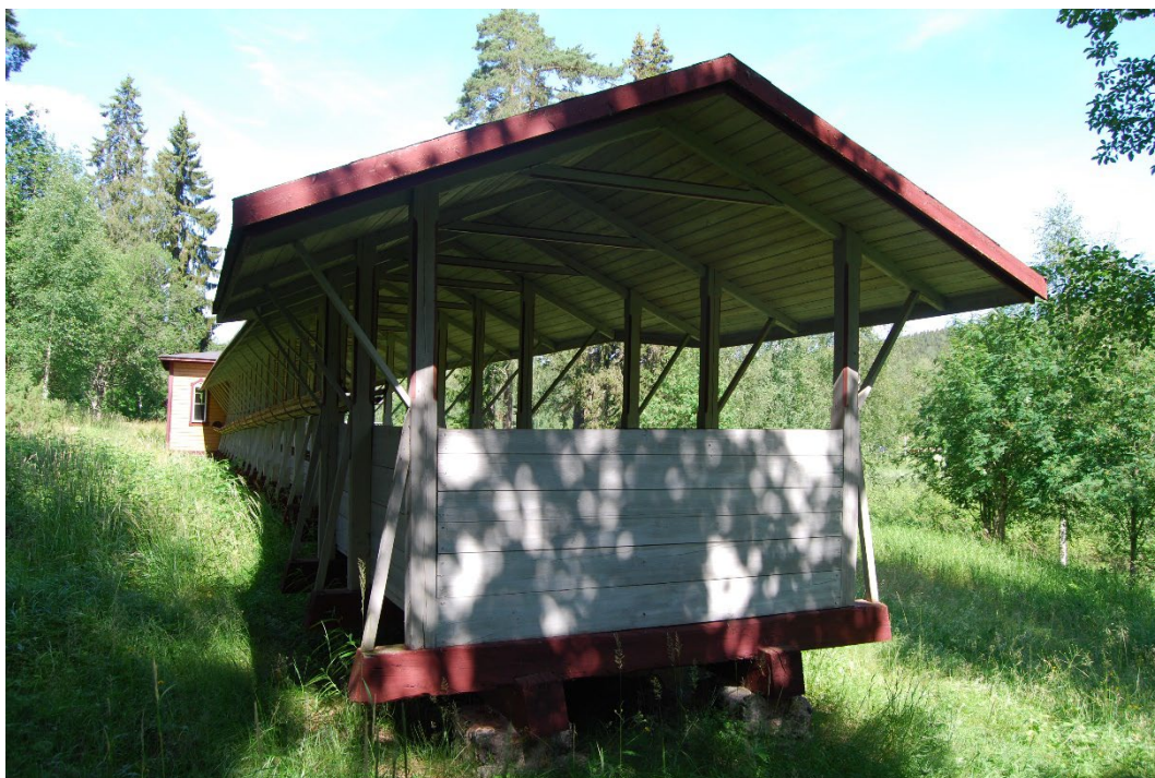
Figur 4. Slagbanans avslut med bräddvägg.