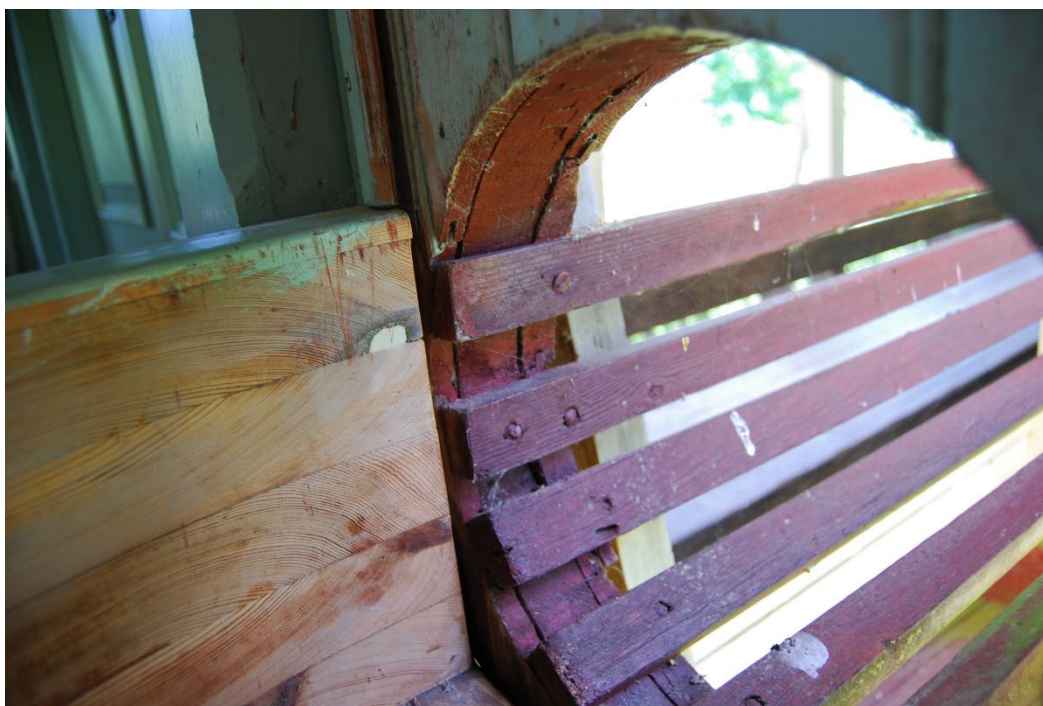
Figur 5. Klotrännan i vilken kloten skickas tillbaka till utslagsplatsen i paviljongen.