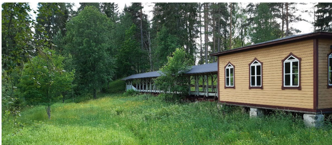
Figur 1. Paviljongens gulmålade liggande panel. Notera plintarna till höger i bild.

Konstruktionen vilar på plintar, till största del bestående av slaggtegel. Paviljongens fasader är klädda med gulmålad liggande fasspontpanel medan slagbanan har en öppen konstruktion med synliga bärande stolpar placerade i par på jämnt avstånd. Vid slagbanans avslut förekommer halvhöga brädväggar. Paviljongens tälttak och slagbanans sadeltak täcks båda med tjärpapp.