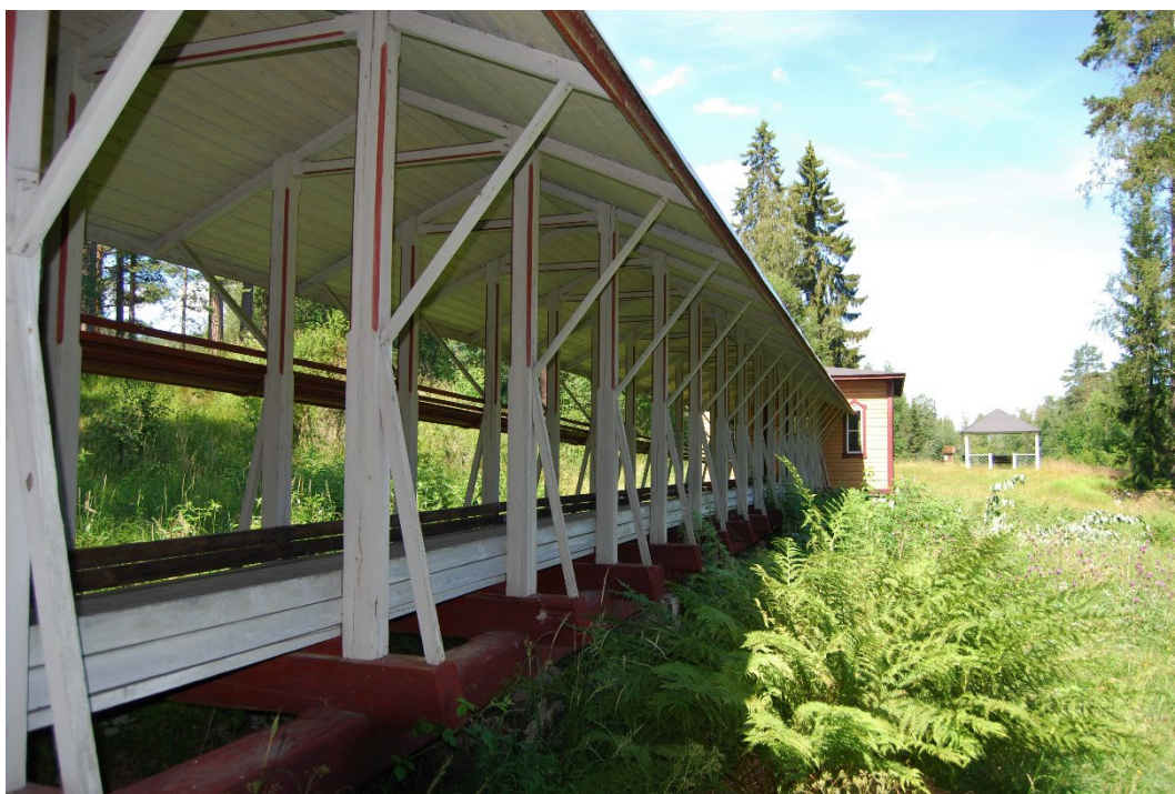
Figur 3. Kägelbanan sedd från sydöst, belägen i den tidigare herrgårdsparken.