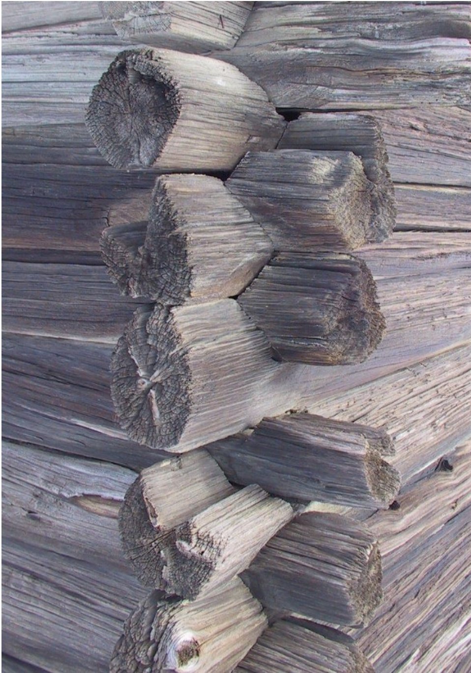
Figur 3. Kuntarna är enkla rännknutar med sexkantshjässor.