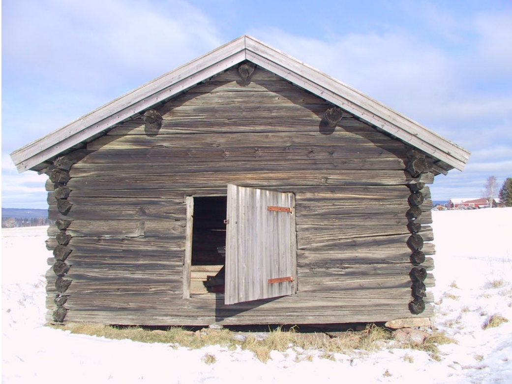
Figur 1. Blånesladan ligger enskilt, omringad av brukad åkermark.

Blånesladan i Övre Gärdsjö är belägen ca 10 km nordost om Rättviks samhälle. Ladan ligger enskilt på brukad mark.