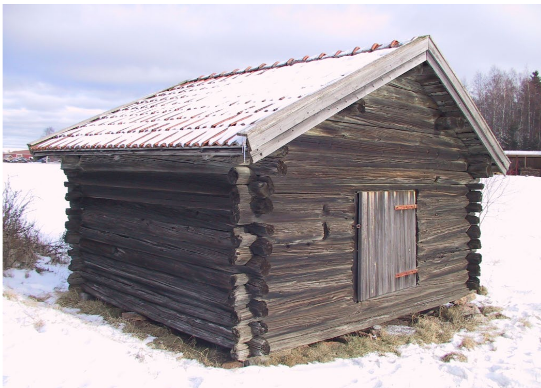
Figur 2. Timret i ladan är daterat till 1293–94.

Ladan uppmäter 4,7 x 3,6 meter. Den är timrad av rundvirke. Knutarna är enkla rännknutar med sexkantshjässor. Timret är obehandlat. Under det nuvarande taket av lertegel finns rester av pärt som vilar på glest lagda åsar och ett undertak av längsgående brädor. Golvet är lagt av kluvna stockar. Ladan står på hörnstenar.