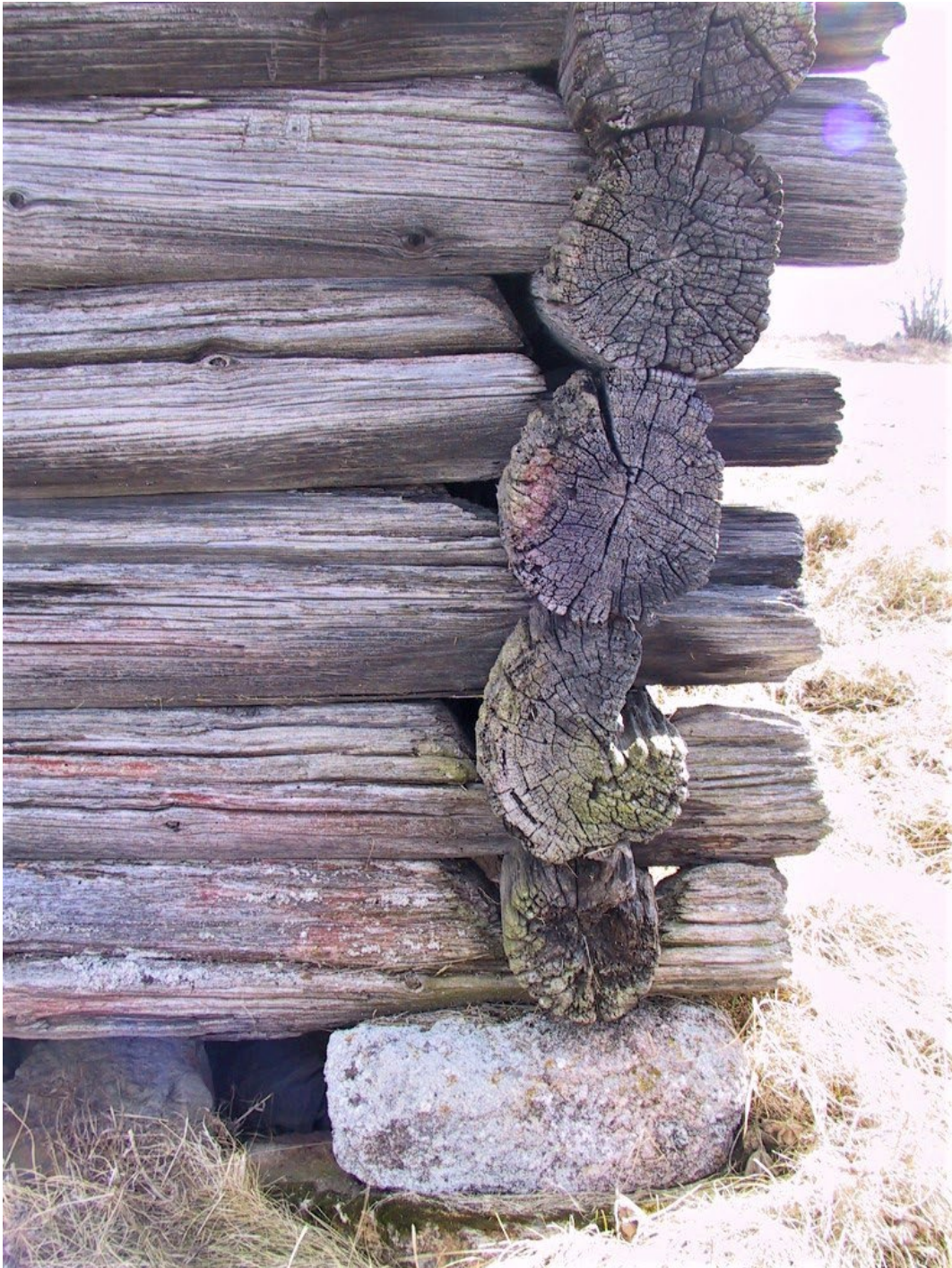
Figur 4. Knutarna vilar på hörnstenar.