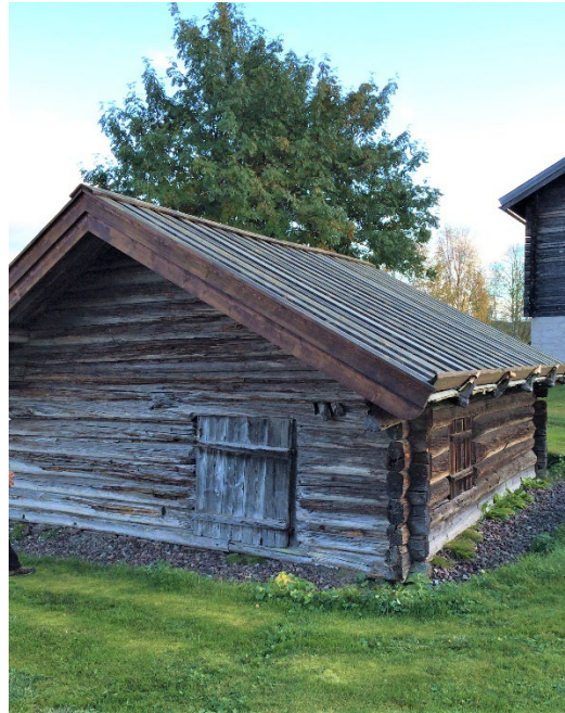
Figur 2. (Vä) Bräddtak. Foto: Länsstyrelsen i Dalarnas län. Figur 3. (Hö) Smedjan. Foto: Länsstyrelsen i Dalarnas län.