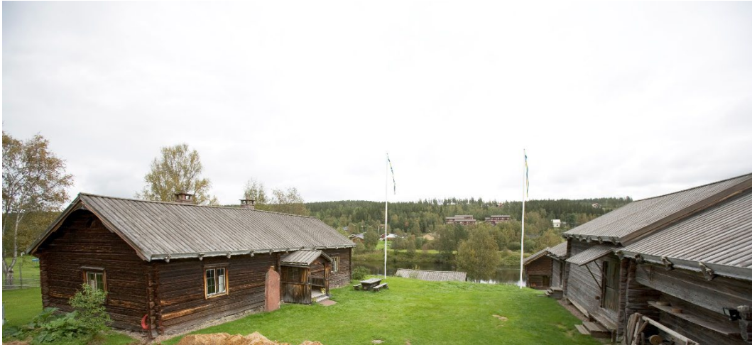
Figur 1. Olnispagårdens omgivningar. Öster om gården flyter Västerdalälven. Bilden är beskuren.

Olnispagården är vackert belägen på ursprunglig plats, vid Västerdalälvens dalgång i byn Västra Sälen. Den på tre sidor kringbyggda gården är omgiven av åker och äng samt spridd bebyggelse.