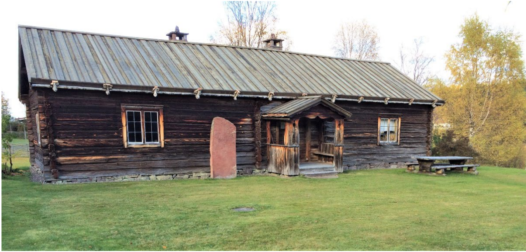
Figur 1. Bostadshuset med tidstypisk brokvist.