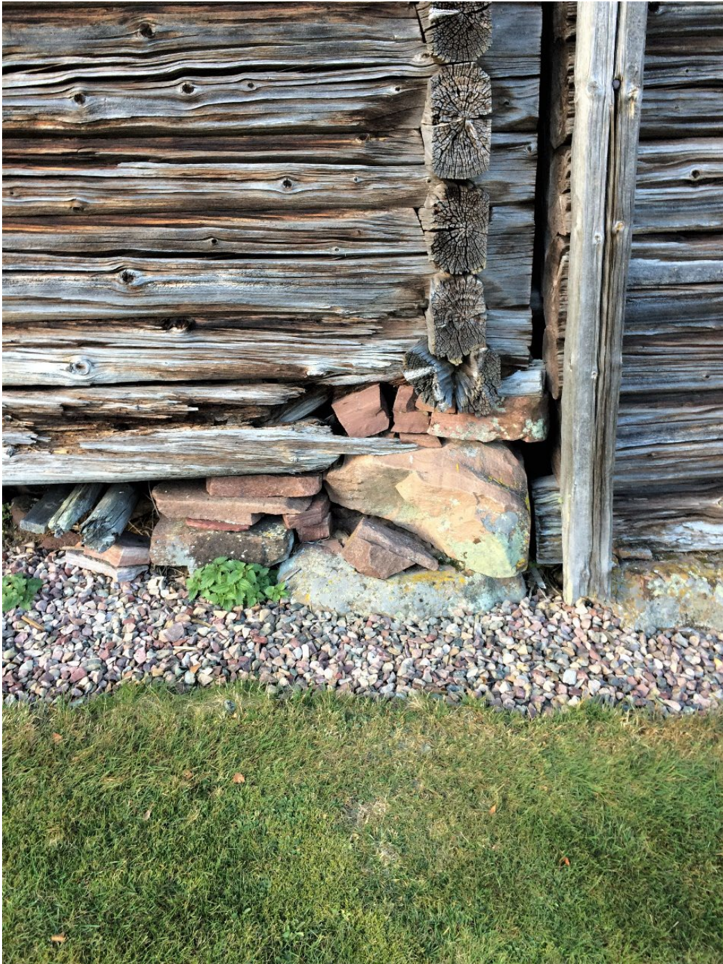
Figur 4. Omålad timmerfasad.