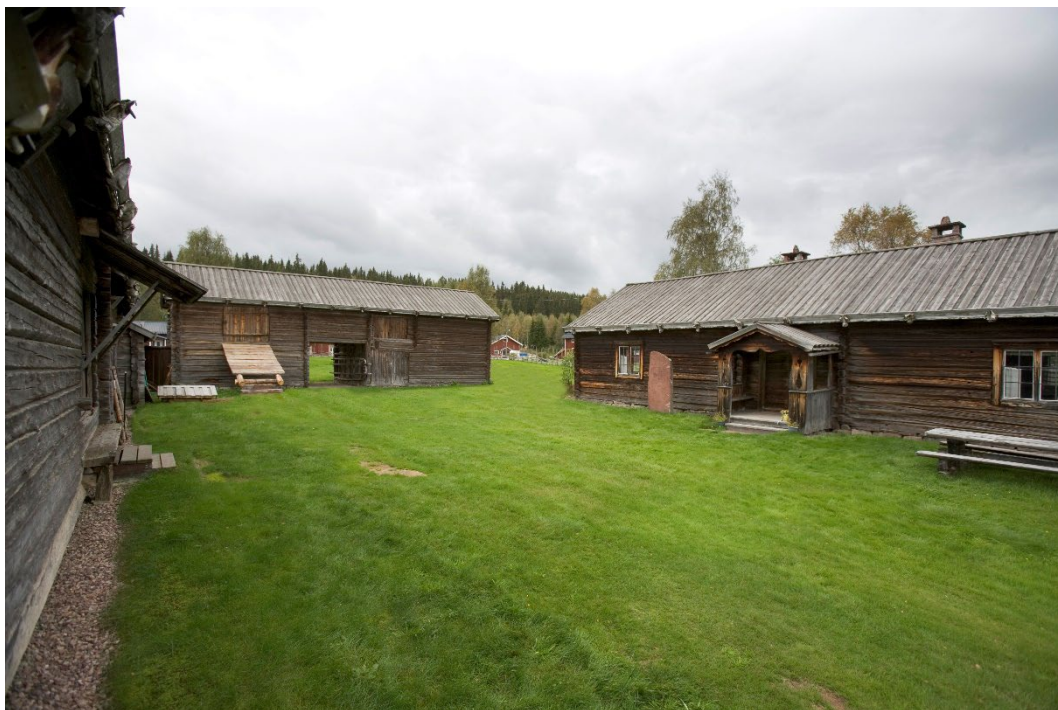
Figur 2. Olnispagården står på ursprunglig plats.

Alla byggnaderna på gården är timrade i en våning med sadeltak, täckta med bräder. Fasaderna är omålade och fönstren spröjsade. Gårdens månghussystem bidrar till det ålderdomliga intrycket.