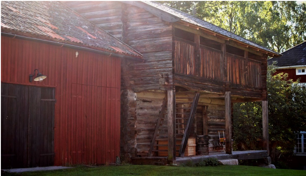
Figur 4. Nastun från början av 1600-talet.

Det äldsta huset är "Nastun" (nattstugan), en loftbod från början av 1600-talet. Den stod ursprungligen i grannbyn Norrvik och flyttades till gården 1918. Karl-Erik Forsslund hann rädda den från att bli upphuggen till ved. Den restaurerades 1969 och 1998.