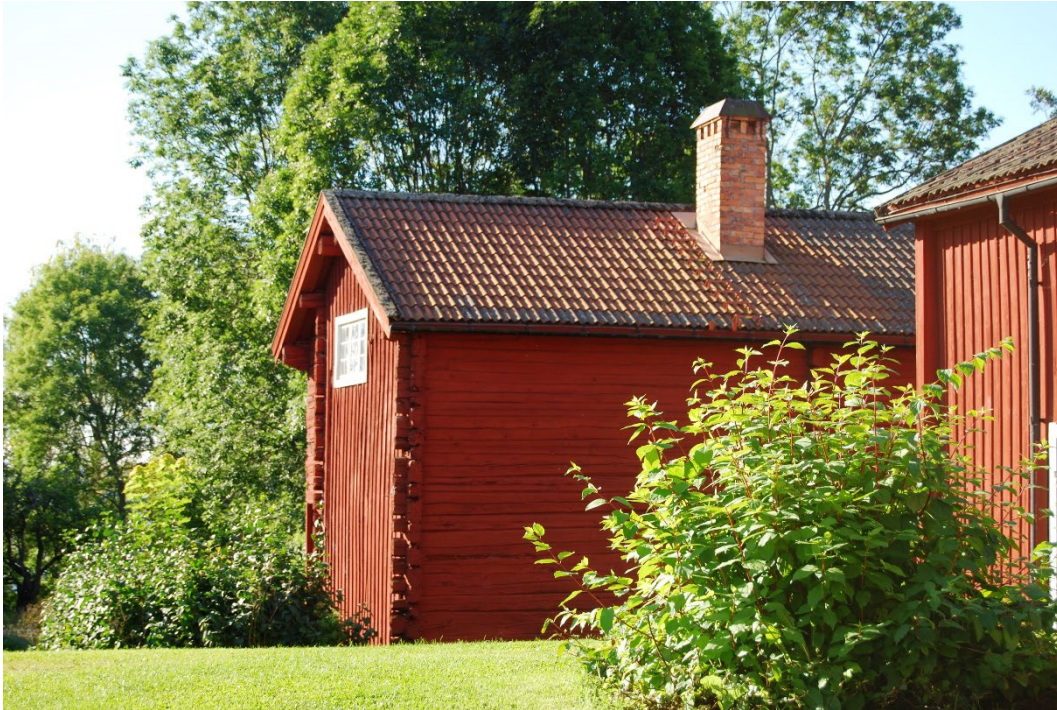
Figur 3. Gårdsmiljön präglas av byggnadernas Faluröda fasader.

Storgården i Brunnsvik ligger vid en vik vid sjön Väsman, cirka 8 kilometer nordväst om Ludvika. Själva gårdsmiljön präglas av rödfärgad träbebyggelse. Gården ligger inom riksintresseområde för kulturmiljövården Brunnsvik – Storgården. Riksintresset utgörs av idéhistoriskt betydelsefull folkhögskolemiljö i Brunnsviks folkhögskola, bergsmansgården Storgården samt Lekombergs gruvor.