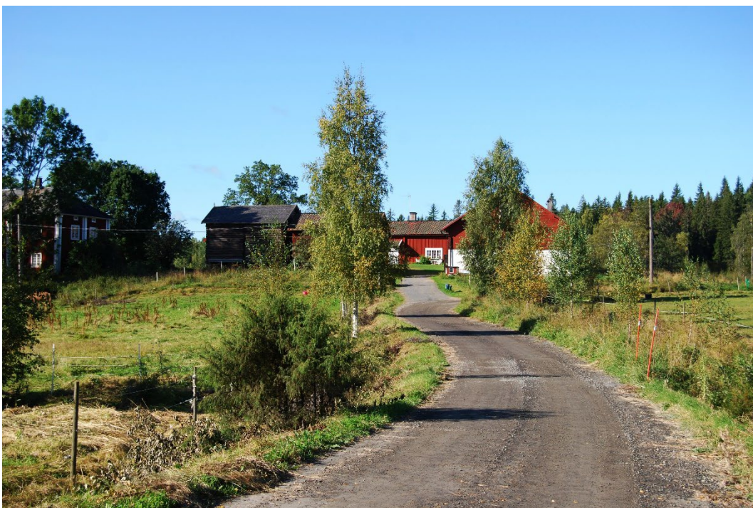
Figur 2. En grusväg slingrar sig genom hagmarker mot gården som ligger på en höjd med utsikt över Väsman.