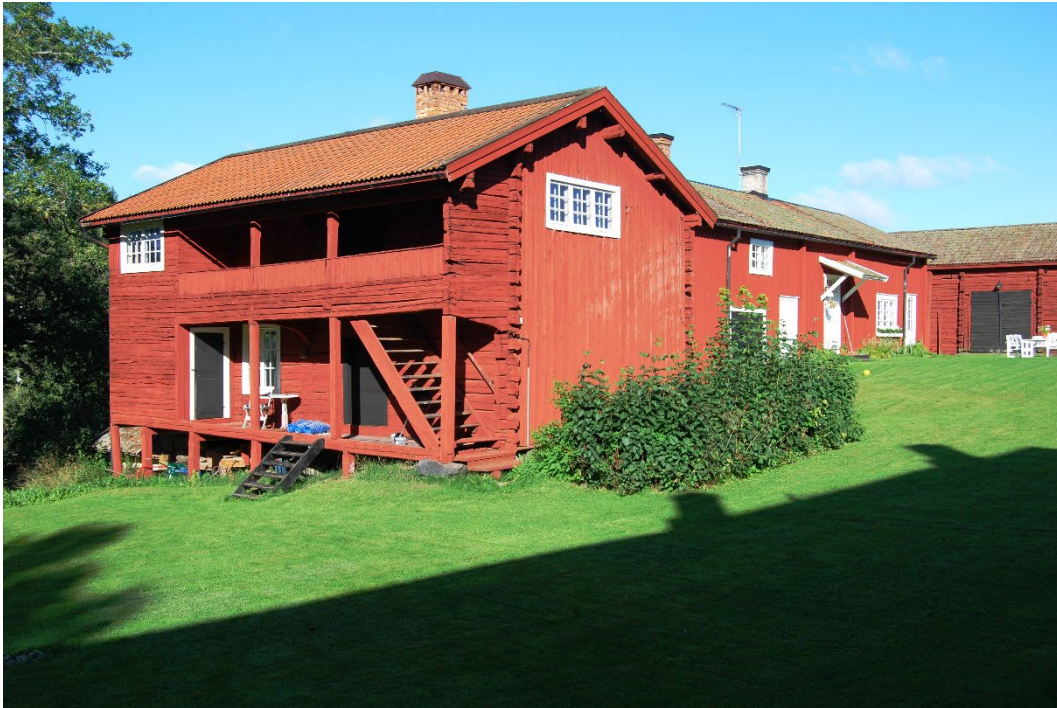
Figur 5. Forsslunds bokstuga; arbetsrum och bibliotek.