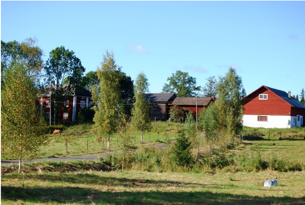
Figur 1. Storegården sedd på avstånd. Gården ligger i lantlig miljö.