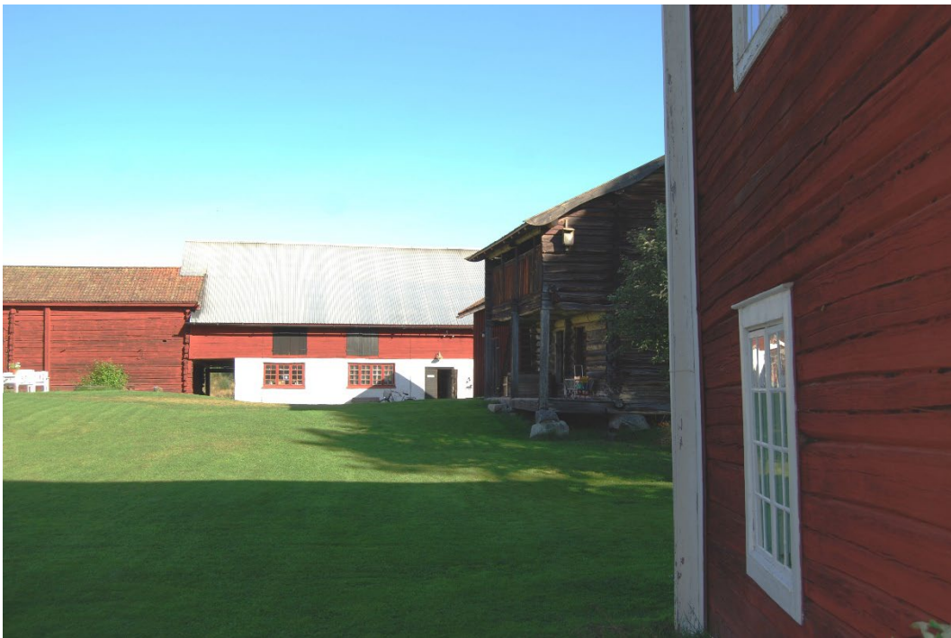
Figur 6. Gårdsmiljön sedd från mangårdsbuggnaden. Rakt fram ligger ladugården.