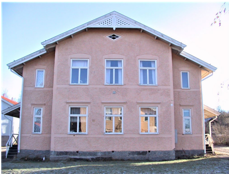
Figur 3. Hus nr 22 med dekorativa snikerier och slätputsade fönsteromfattningar.