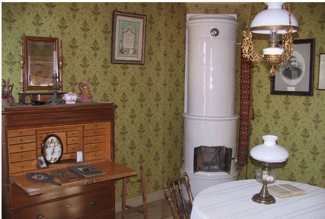
Figur 5. Hus nr 22 har en lägenhet inredd i för sekelskiftet tidstypisk inredning, som idag är bostadsmuseum.

Varje hus består av fyra lägenheter. Bostäderna utgörs av ett rum och kök, på ca 50 m 2 . Till varje lägenhet hör vedbod och källare. Alla lägenheterna hade egna entréer, en princip som var vanlig för äldre bolagshus. Lägenheterna genomgick under 1960- och 1970-talen en enklare upprustning och modernisering. Idag finns en lägenhet med bevarad inredning från tidigt 1900-tal, vilken visas upp som museum vid begäran.