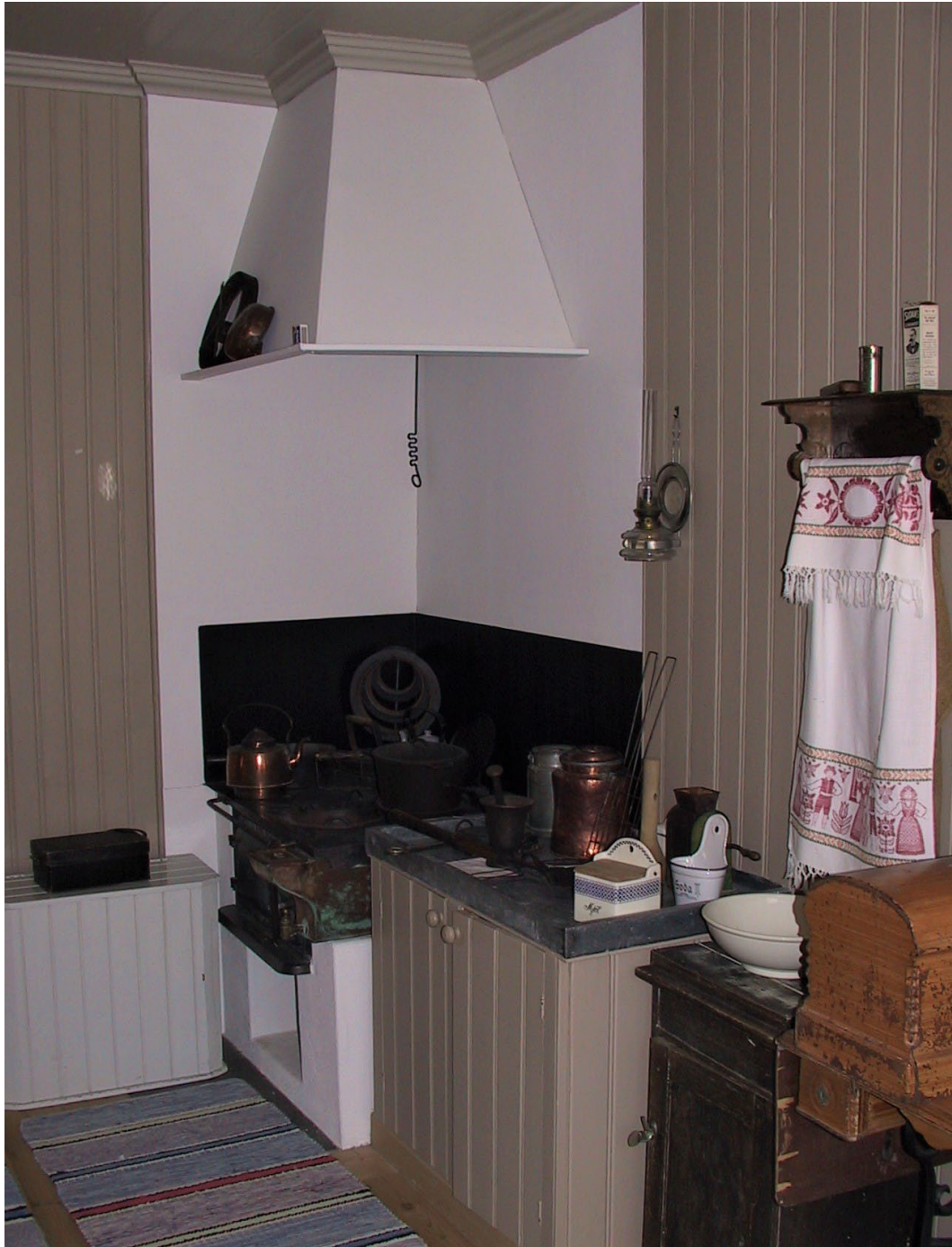
Figur 6. Bostadsmuseets kök.