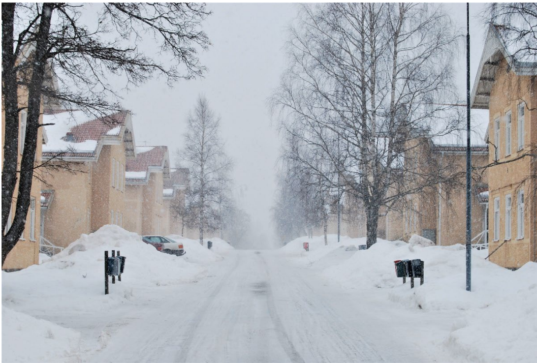
Figur 2. Stora Hagvägen leder rakt igenom området. Arbetarbostäderna är regelbundet placerade utmed vägen och bidrar till områdets utpräglade symmetri.

Grängesbergs gruvssamhälle har några sammanhållna områden med mycket stort kulturhistoriskt och miljömässigt värde. Ett av dessa områden är Stora Hagen, där rubricerade fastighet är belägen. Många av dessa uppfördes under 1890-talet, då bostadsbristen var stor. För att råda bot på detta byggdes några områden upp med typhus i ett upprepat mönster. Husen ligger uppgradade utmed Stora Hagvägen, med uthusen placerade bakom bostadshusen. Vägen kantas av björkar.