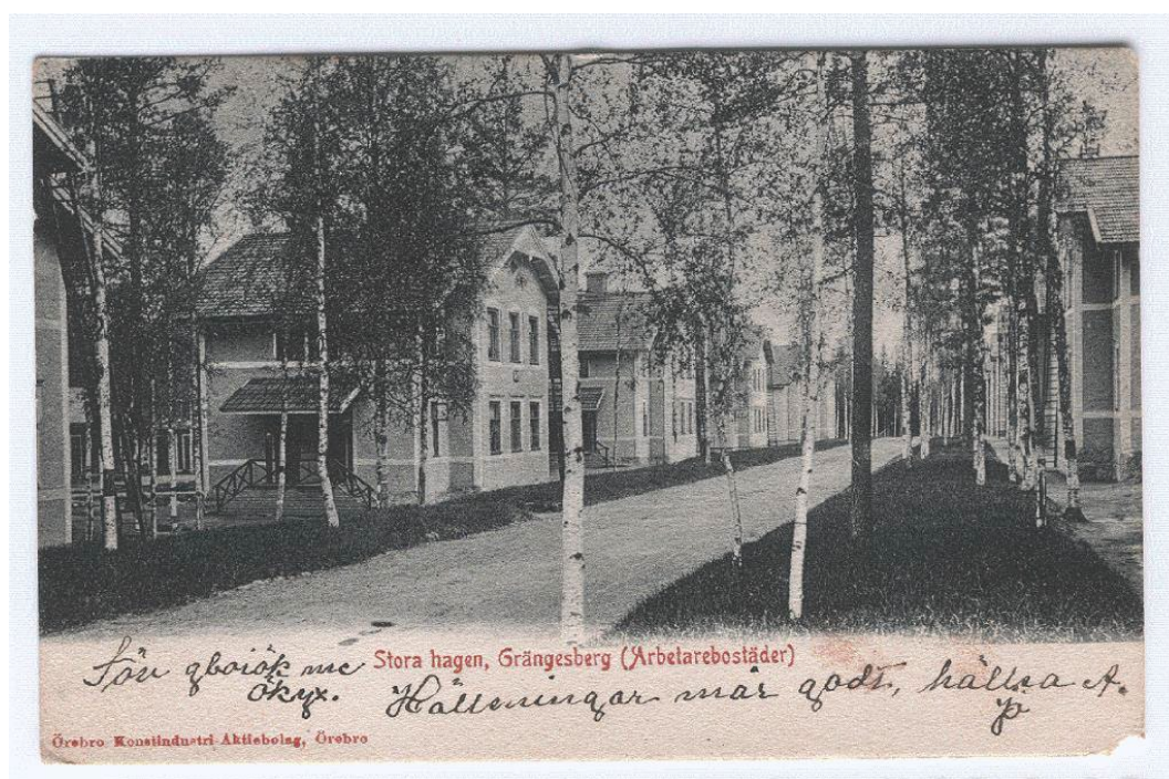
Figur 1. Historiskt foto som visar bebyggelsen i Stora Hagen när området var nyligen färdigställt.

Husen i Stora Hagen ritades på gruvbolagets ritkontor. Samma byggnadsritningar användes för det närliggande Källfallets arbetarbostäder samt för vissa andra hus i Grängesberg.