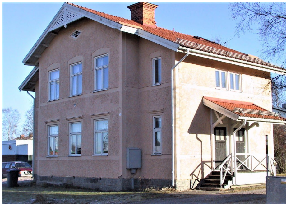
Figur 4. Varje lägenhet hade traditionsenligt en egen entré.