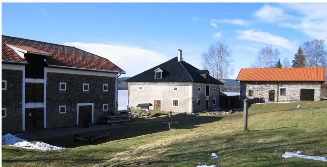
Figur 4. Nyhammars magasin och det putsade Olaussonska magasinet sett från landsidan.