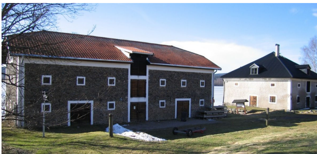
Figur 1. Magasinets östra långsida. Frilagd murad slagg och vitputsade omfattningar enligt Forsgrenska stilen.

Olof Forsgren var ingenjör och disponent under 1800-talets första hälft. Forsgrens stil vilade på och blev en variant av det som kom att kallas Geislers teknik. Han utvecklade ett nytt uttryck vid murning av väggar med slaggflis. Endast lister och omfattningar fick vit puts. Genom att det bärande materialet i konstruktionen lämnades väl synligt som ett estetiskt huvudinslag, skilde sig de Forsgenska slagghusen från de flesta andra samtida hus av sten eller slagg.