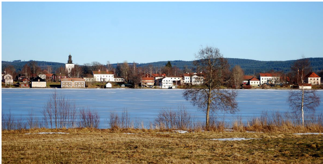
Figur 3. Grangärde kyrkby sett från andra sidan Bysjön.

Nyhammars spannmålsmagasin, även kallat Stora sjömagasinet, uppfördes på 1850-talet vid Bysjöns strand mitt i Grangärde kyrkby. Grangärde kyrkby är samlad på en uppodlad landremsa mellan sjöarna Bysjön och Björken.