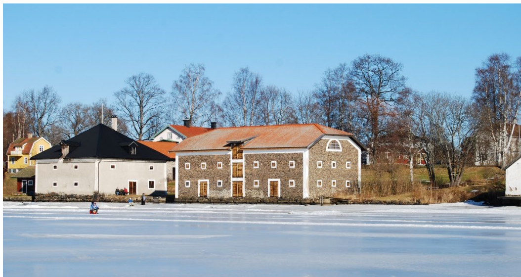
Figur 2. Nyhammars magasin till höger och Olaussons magasin till vänster i bild.

Enligt uppgift finns idag i Västerbergslagen ett femtiotal byggnader i den Forsgrenska stilen, vilket är merparten av de som återstår. Ett exempel är byggnadsminnet Hyttarbetarkasernen i Laxsjön, också i Ludvika kommun.