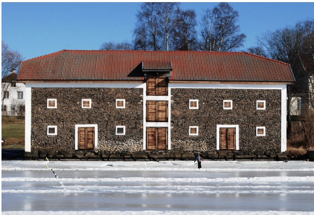
Figur 5. Nyhammars spannmålsmagasin sett från vattnet.

Nyhammars magasin är byggt cirka 1852 i två våningar. Magasinet är byggt av slaggflis i den så kallade Forsgrenska stilen. Byggnaden skiftar i grått, grönt och blått. Knutar samt fönster- och dörrömfattningar är putsade i vitt.