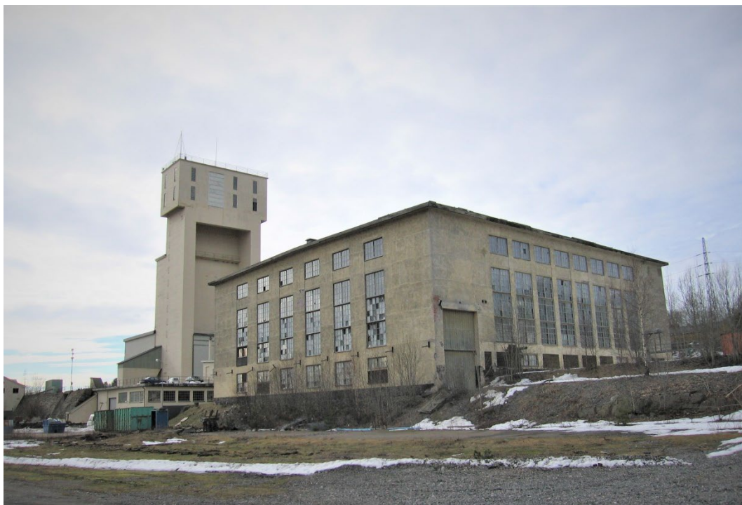
Figur 3. Maskinhuset innan restaurering, Exportfältet i förgrunden.