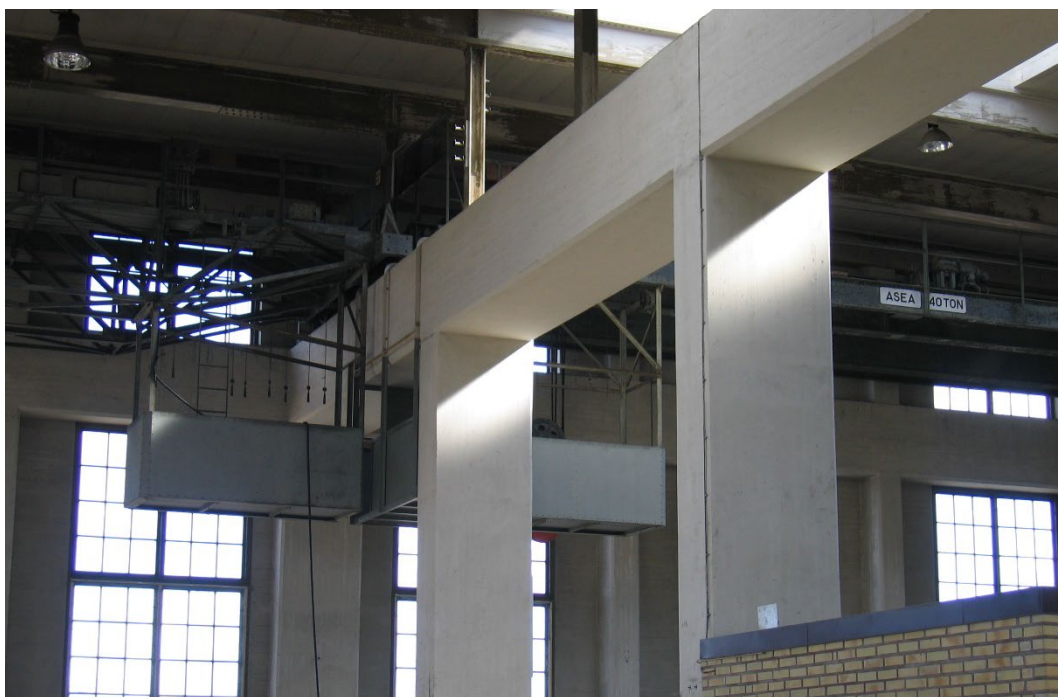
Figur 7. Pelarstomme på vilken maskinhallens konstruktion vilar.