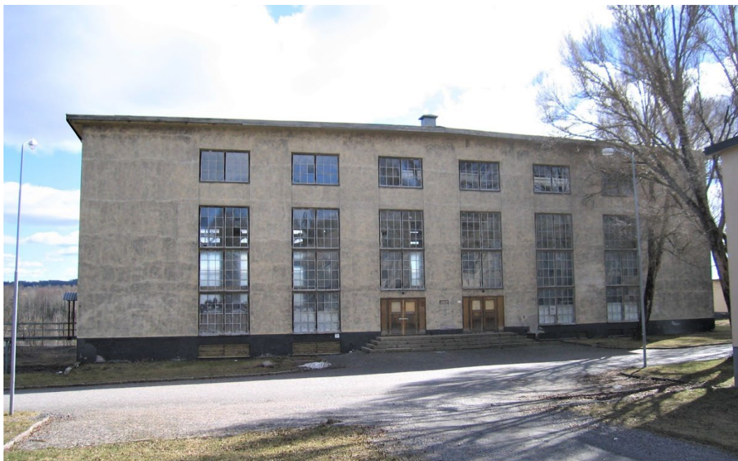
Figur 4. Sydvästra fasaden.