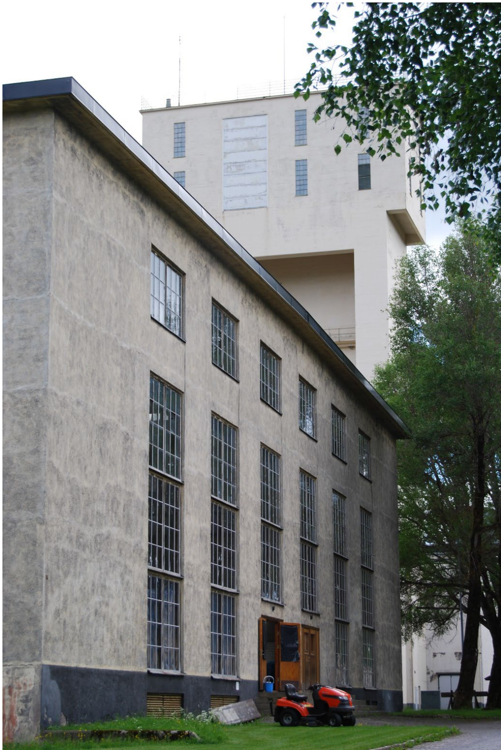
Figur 1. Den strikta funktionalistiska utformningen präglar hela centralanläggningen.