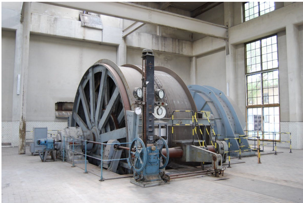
Figur 6. Bevarat konsthjul inne i maskinhuset.