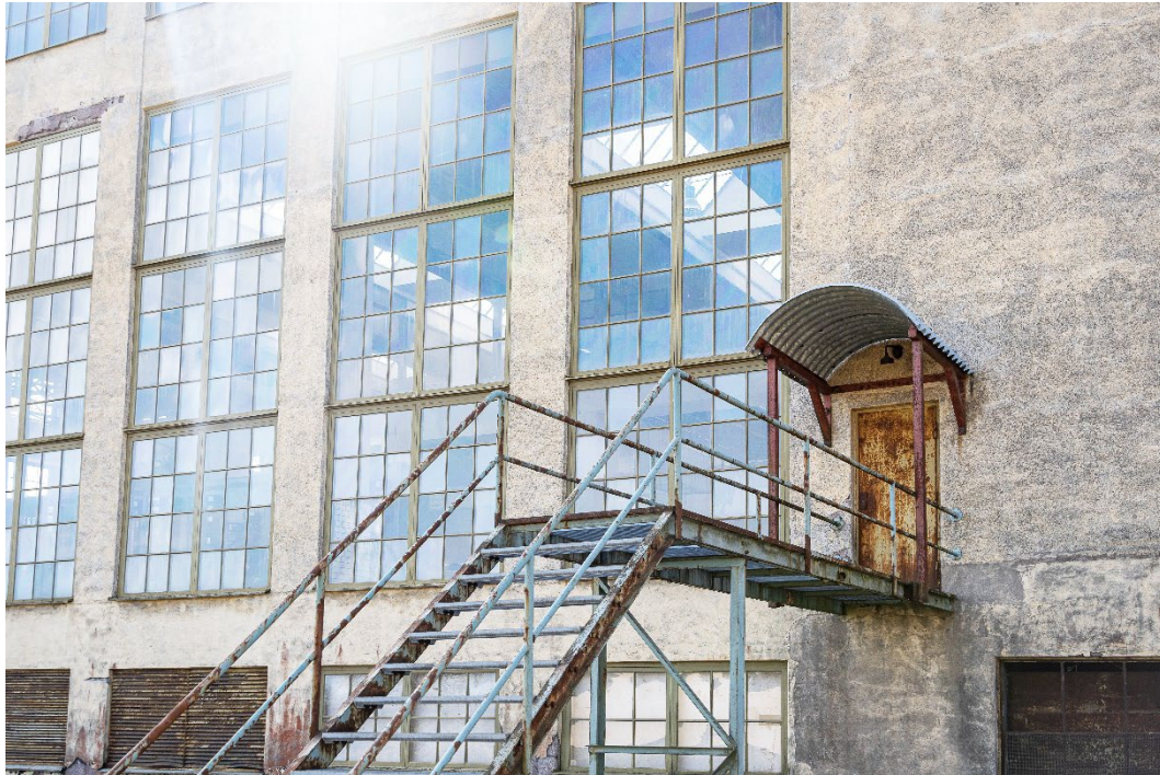
Figur 5. Byggnadens karaktäristiska glaspartier innebar ordentligt ljusinsläpp i lokalerna.