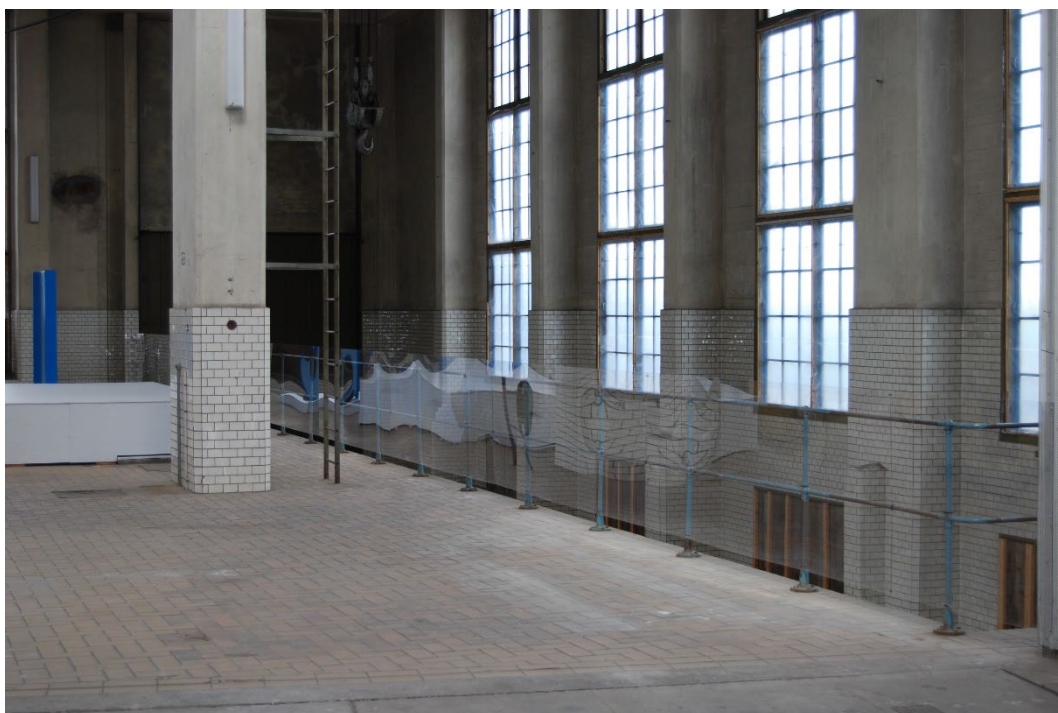
Figur 8. Interiör från maskinhallen.