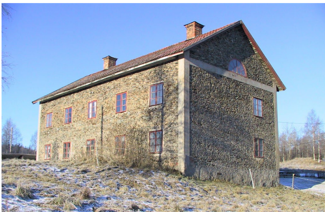
Figur 1. Byggnaden sedd från öst.

Laxsjö hytta omnämns första gången i skriftligt källmaterial 1579. En bergsmanshytta med nio delägare anlades vid Laxsjön 1626. Mot slutet av 1600-talet gick hyttan hårdare tider till mötes. Det blev svårt att hålla hyttan i gång då man led brist på kol. Skogarna runt omkring ägdes av Stora Kopparbergs Bergslags AB och skogen reserverades för Falu gruvans behov. Delägarnas egna skogar räckte inte till att hålla hyttan med kol. År 1737 stadgades att blåsningsstiden ej fick överstiga åtta veckor per år. Hyttan övergick i enskild ägo mot slutet av 1700-talet och år 1824 såldes Laxsjö masugn till Forsbacka och Limå bruksägare. År 1854 köptes sedan Limåverken av Bergslaget, hälften av Laxsjö hytta kom då i Bergslagets ägo. Driften vid Laxsjö hytta nedlades 1877 och därefter har man ägnat sig åt skogsbruk.