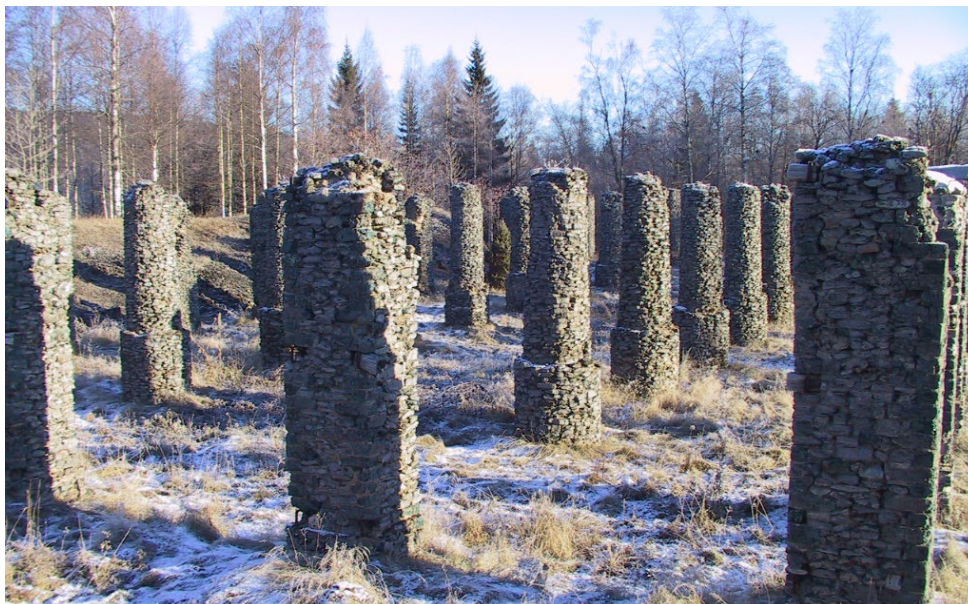
Figur 3. De resterande slaggpelarna från kolhuset som tidigare stått på platsen.

Hyttområdet är avskild beläget i skogen på gränsen mellan Grangärde och Stora Tuna socknar. Av hyttens byggnader återstår endast ett område med ruiner med bland annat slaggpelare från ett cirka 70 meter långt kolhus, dammar och rester av ett kanalsystem. Hyttarbetarkasernen ligger på andra sidan vägen från kolhusruinen. Under tiden för hyttens verksamhet i Laxsjö fanns även en herrgårdsliknande förvaltarbostad, ett stort lantbruk, arrendegårdar, bruksbod, kvarn och torpställen.