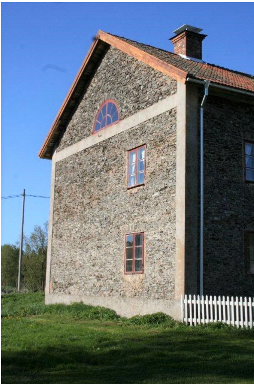
Figur 5. Östra gaveln med lunettfönster. Notera de putsade partierna i fasaden.