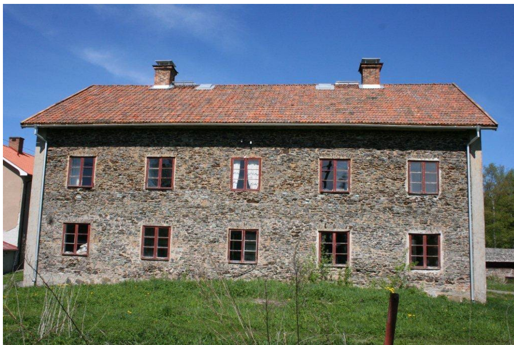
Figur 4. Södra långsidan mot vattnet.

Ursprungligen inrymde hyttarbetarkasernen sex lägenheter om ett rum och kök, ett spisrum och ett hyttkontor fördelat på fyra lägenheter i varje plan. Dessutom fanns på varje plan en gemensam hall med trappa mellan våningsplanen. I varje lägenhet fanns öppna eldstäder.