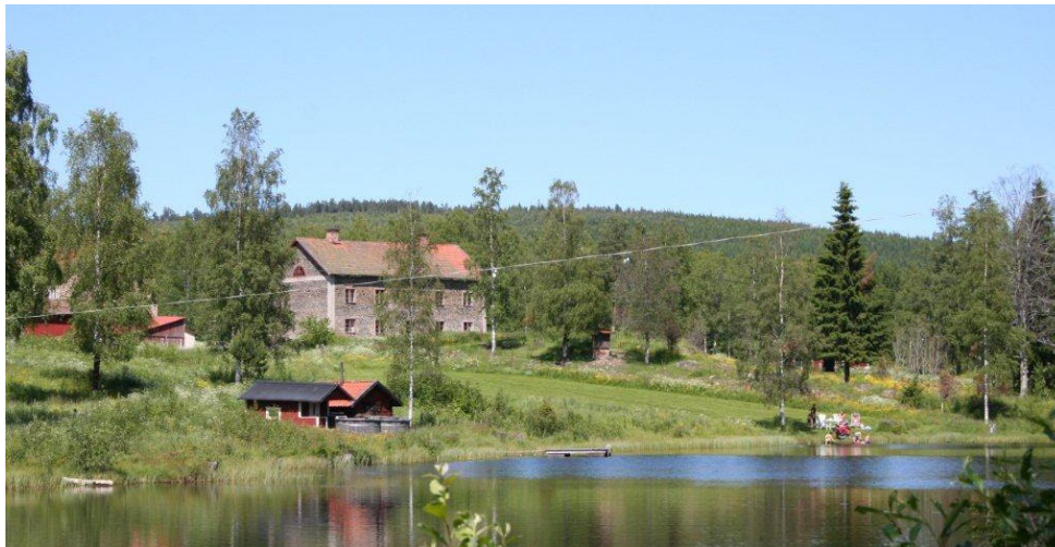
Figur 2. Byggnadens läge på en höjd över sjön. .

Hyttområdet är avskild beläget i skogen på gränsen mellan Grangärde och Stora Tuna socknar. Av hyttens byggnader återstår endast ett område med ruiner med bland annat slaggpelare från ett cirka 70 meter långt kolhus, dammar och rester av ett kanalsystem. Hyttarbetarkasernen ligger på andra sidan vägen från kolhusruinen. Under tiden för hyttens verksamhet i Laxsjö fanns även en herrgårdsliknande förvaltarbostad, ett stort lantbruk, arrendegårdar, bruksbod, kvarn och torpställen.