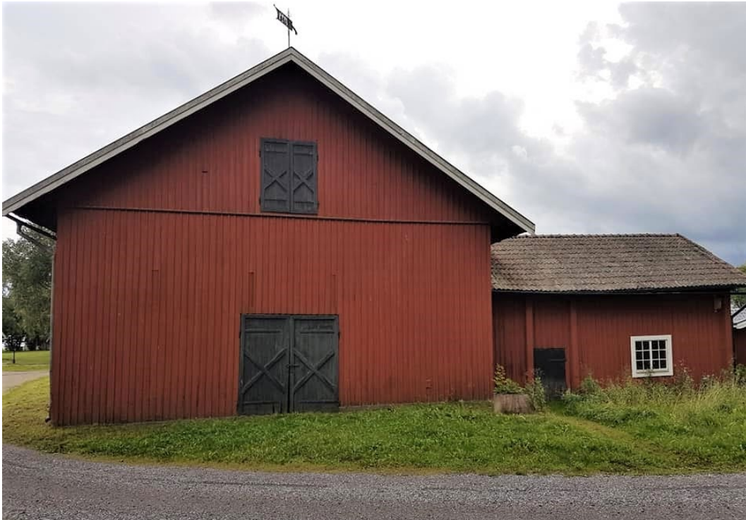
Figur 9. Ladans norra gavel med vindflöjel i toppen på gavelspetsen. Till höger syns den mindre, tillbyggda ladan.