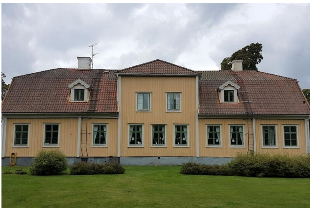
Figur 4. Huvudbyggnadens östra fasad.