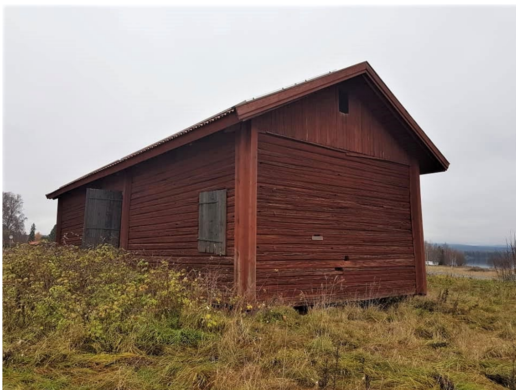
Figur 12. Sörgårdsladan.