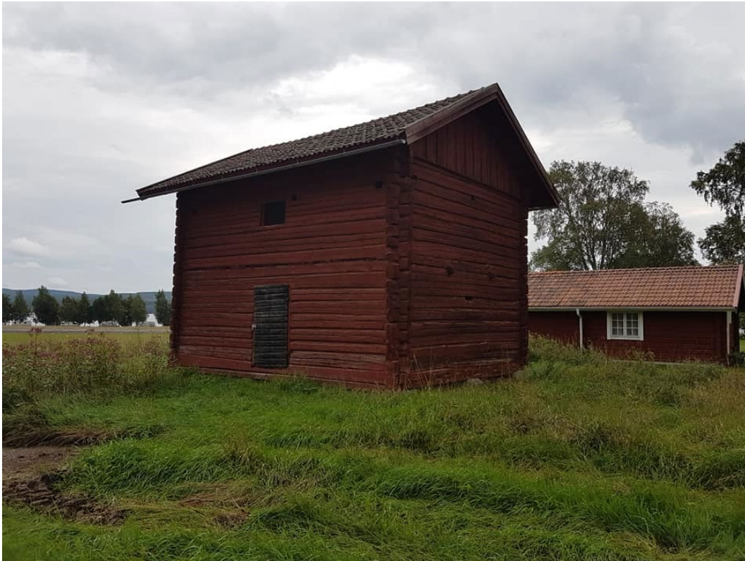
Figur 11. Prästgårdens sockenmagasin.