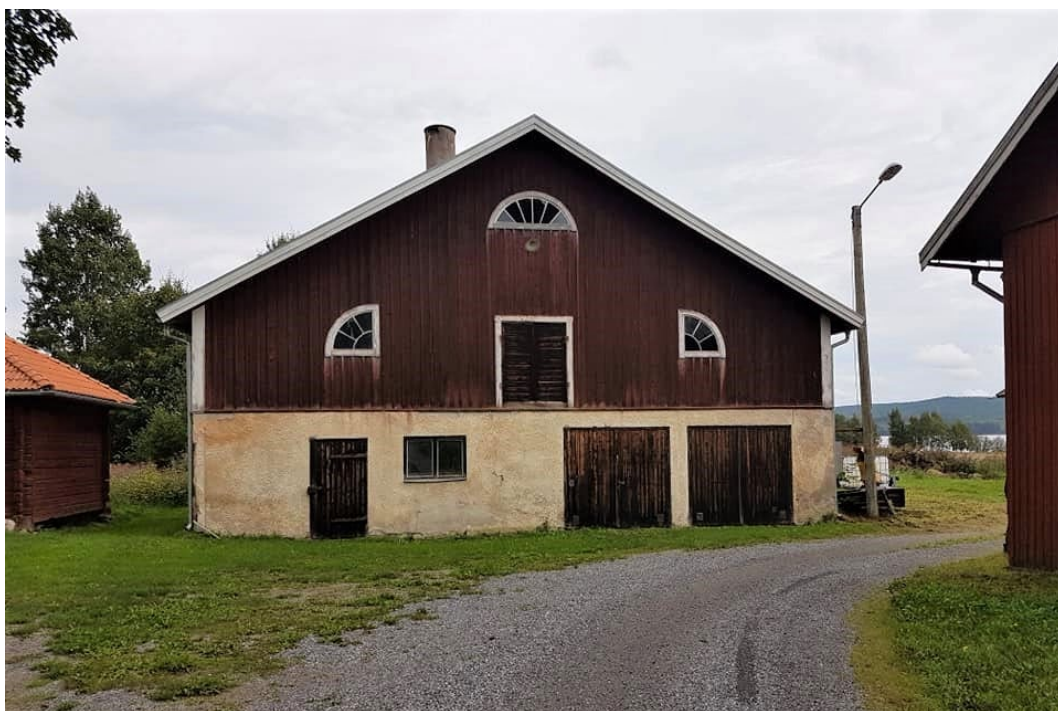
Figur 8. Ladugårdsbyggnaden med bottenvåning i slaggflis.