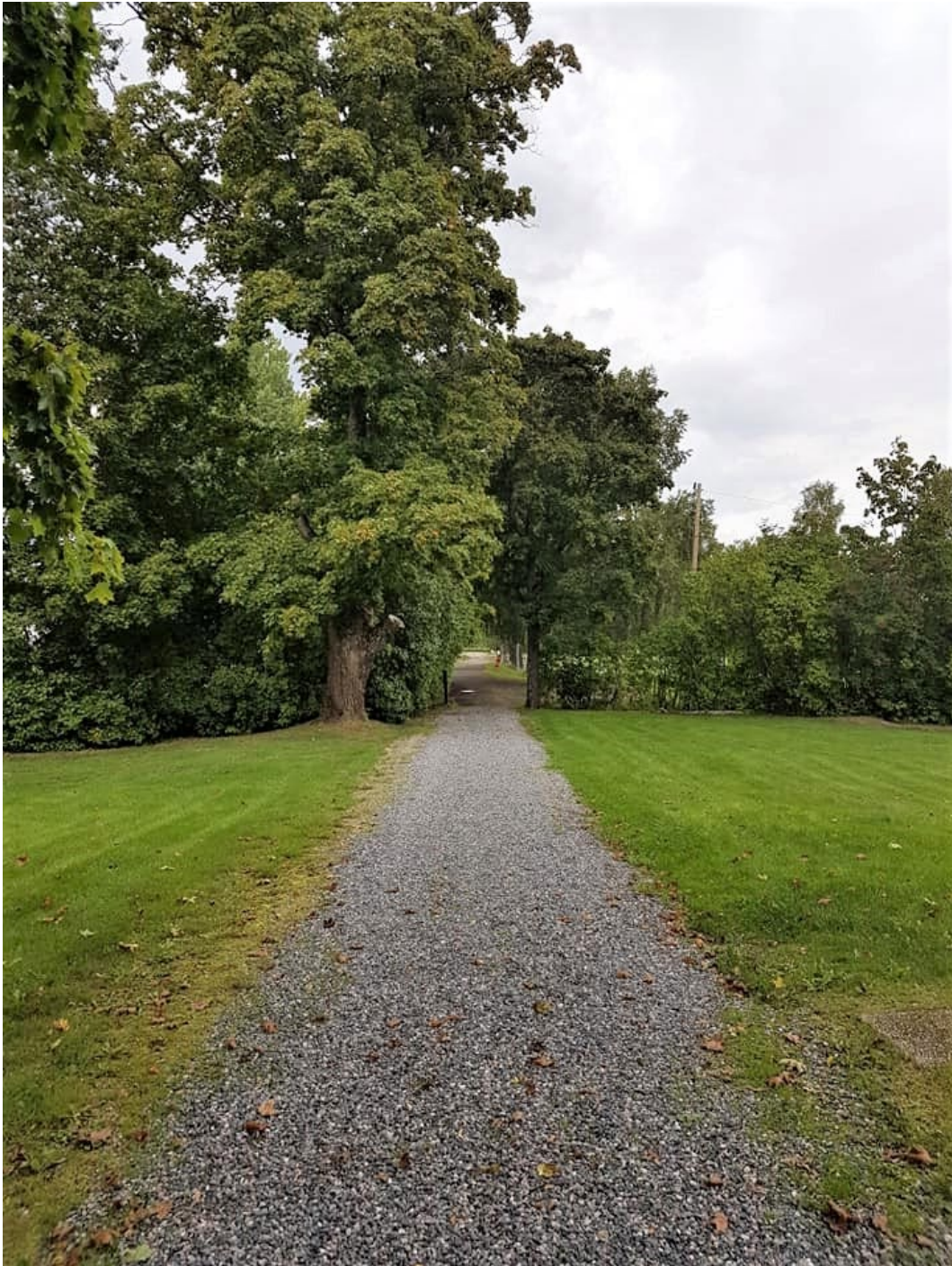
Figur 2. Prästgården inramas av parkliknande växtlighet.