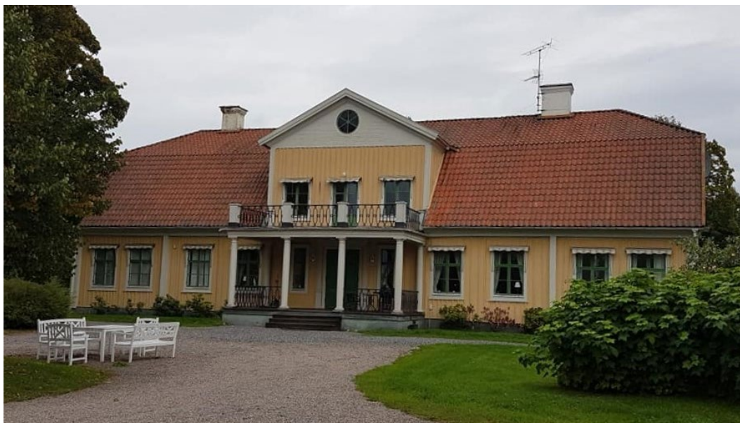
Figur 3. Mangårdsbyggnadens huvudentré med veranda och balkong.

Nedervåningens mittparti består av en stor hall och innanför denna ligger salen. I dessa rum finns bröstningspaneler i två olika utförande. Stora trappen, som tillkommit när övervåningen inreds omkring 1920, är klädd med en liknande panel och även i övre hallen finns bröstningspanel. I övre och nedre hallen finns pelare med kannelyrer, baser och kapital, troligtvis också från 1920-talet. Uppdelningen mellan herrskapsfolkets och tjänstefolkets olika utrymmen är tydligt avläsbar.