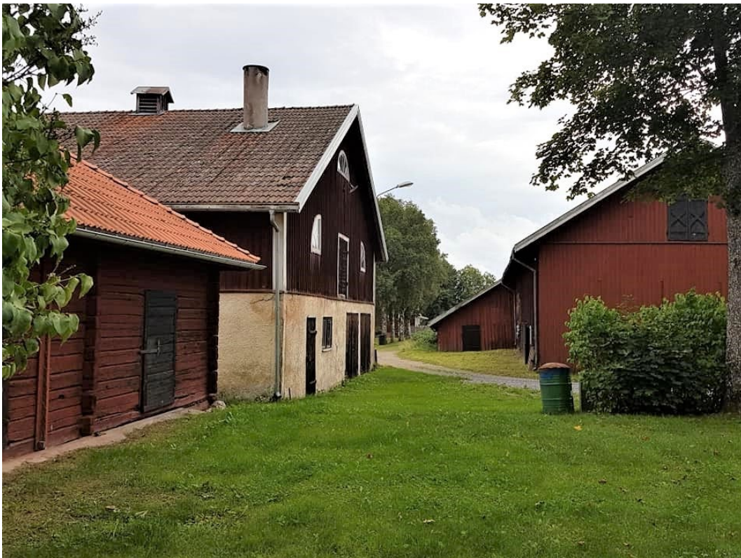
Figur 1. Fägårdsmiljön.

Prostgården med kyrkoherdeboställe är centralt belägen i byn, omkring 100 meter sydväst om kyrkan. Gården består i sin norra del av en herrgårdsliknande mangård med planterad allé, huvudbyggnad och två flyglar. Fägården består av ekonomibyggnader från 1800-talet och prästgårdsarrendatorns bostadshus från 1930-talet. Arrendatorsbostaden är avstyckad och såld.