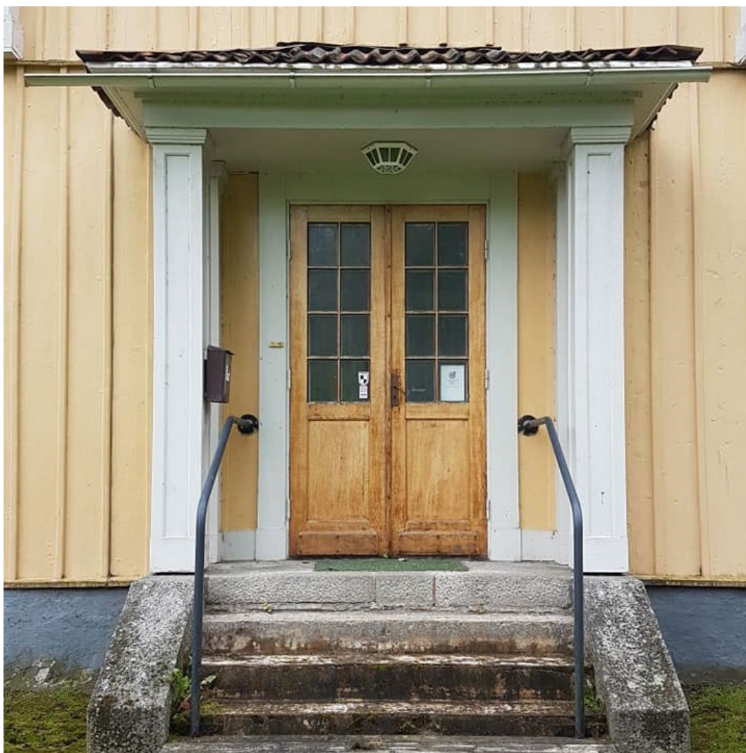
Figur 6. Vålbevarad entré till före detta pastorsexpeditionen.