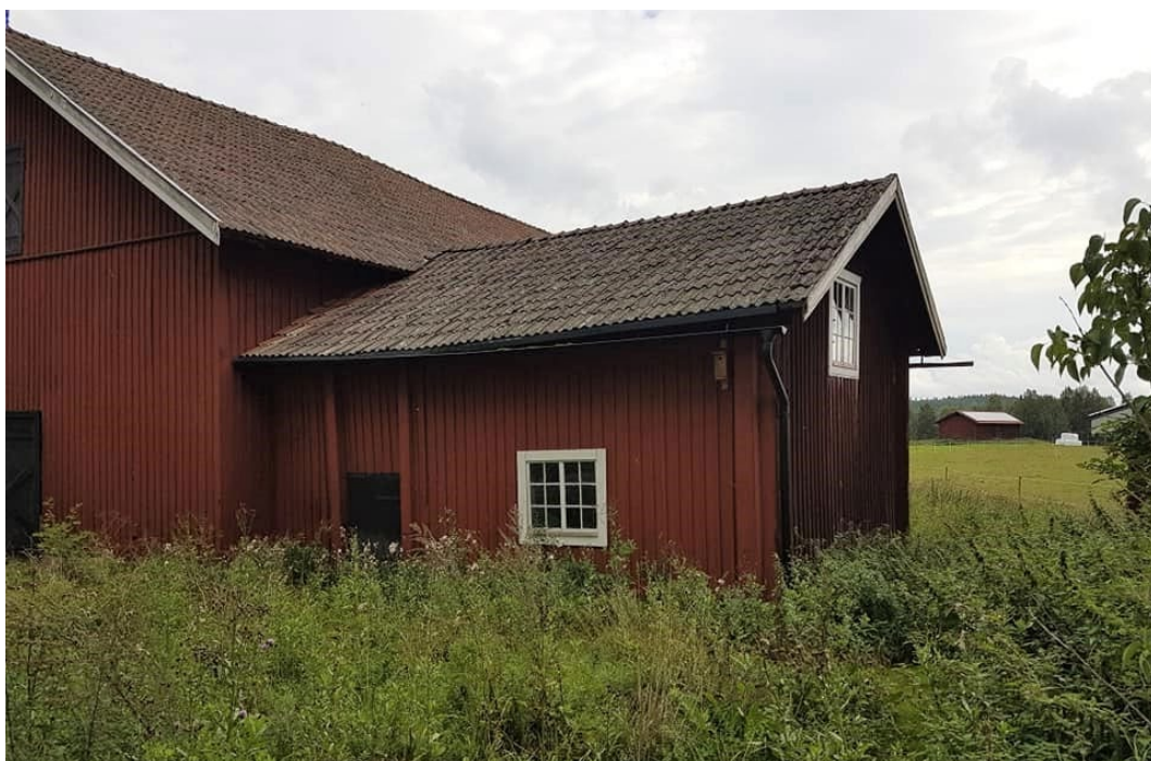
Figur 10. Den mindre ladan är tillbyggd på den större ladan till vänster i bild.