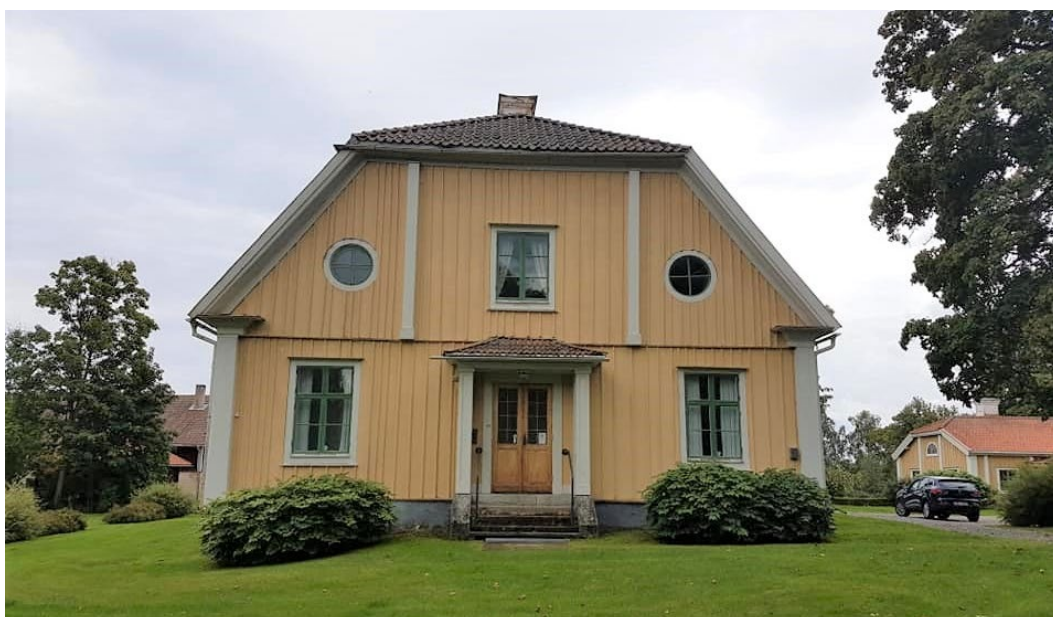
Figur 5. Norra gaveln med fastukvist och ingång till den före detta pastorsexpeditionen.