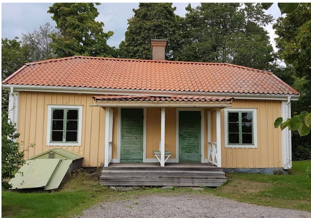
Figur 7. Flygelbyggnaderna har samma utförande som huvudbyggnaden.