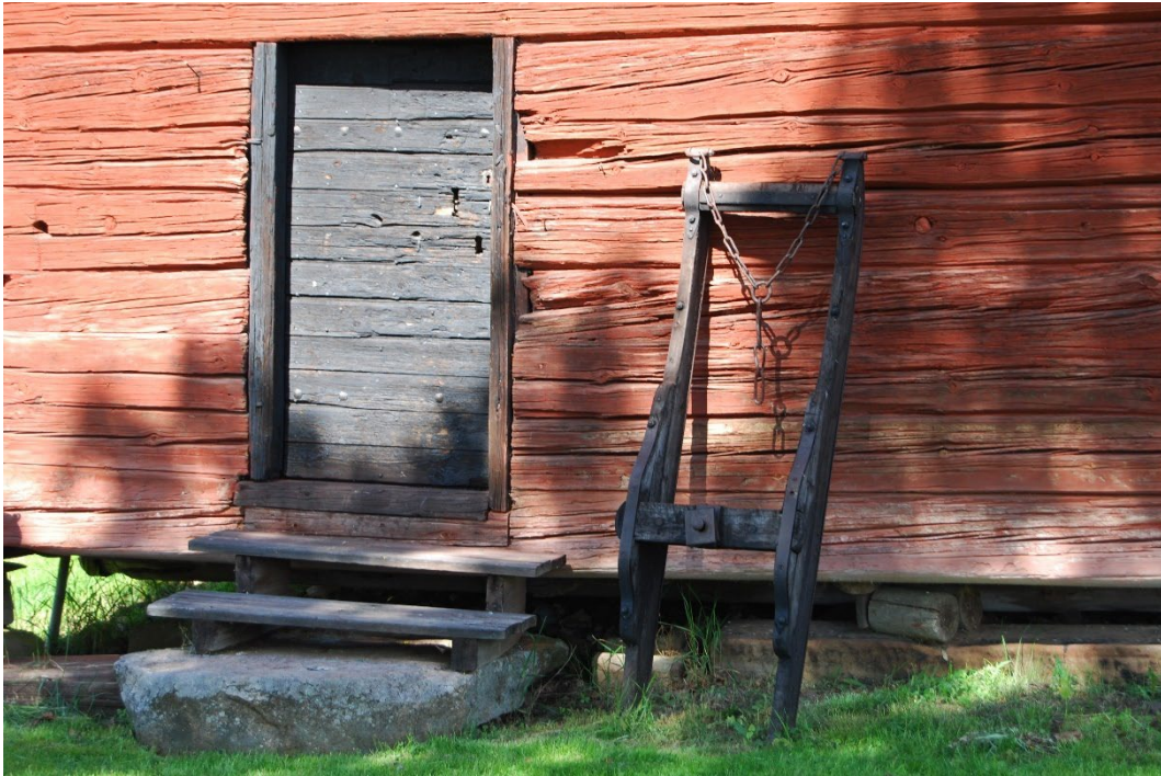
Figur 4. Nästan alla byggnader på gården har faluröda fasader.