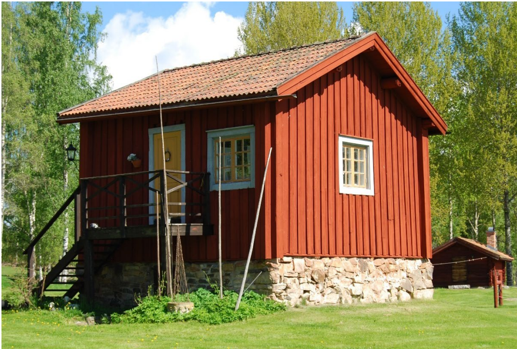
Figur 5. Källarstugans timmerstomme har klätts med panel.