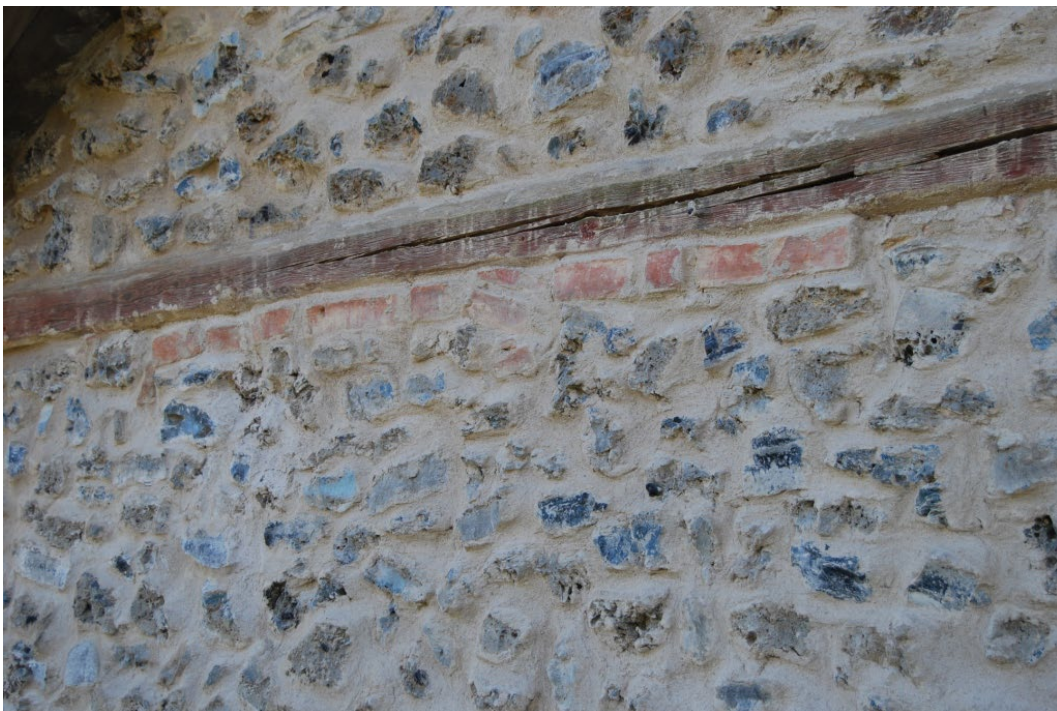
Figur 7. Smedjan är murad i slaggsten.