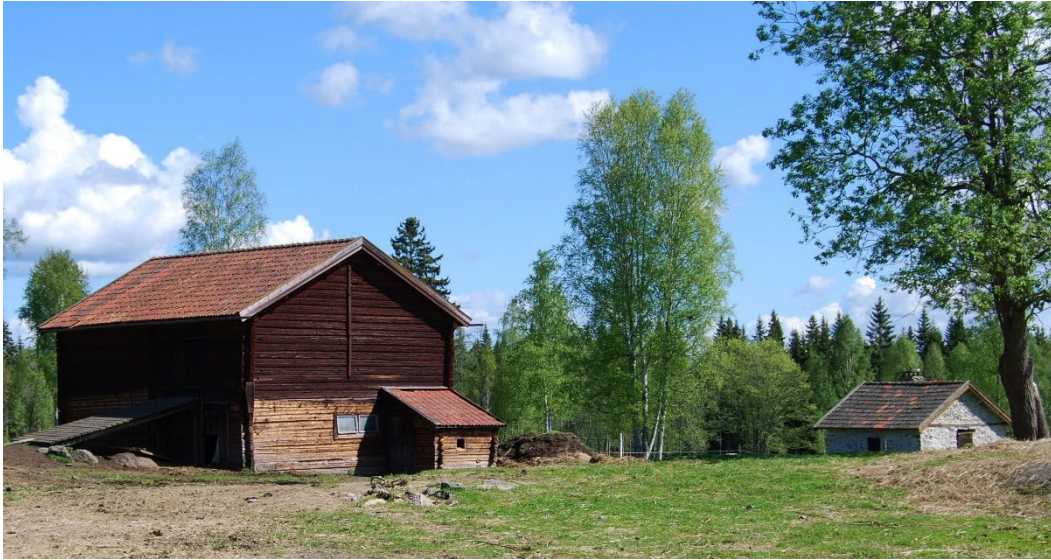
Figur 1. Ladugården, i bakgrunden smedjan.

Gonäs bergsmansgård ligger i utkanten av byn Gonäs i Ludvika kommun. Gården ligger strax väster om det hyttområde till vilken den historiskt varit kopplad. Gårdsmiljön präglas av byggnadernas rödfärgade fasader och den helhetsbild som månghustraditionen ger.