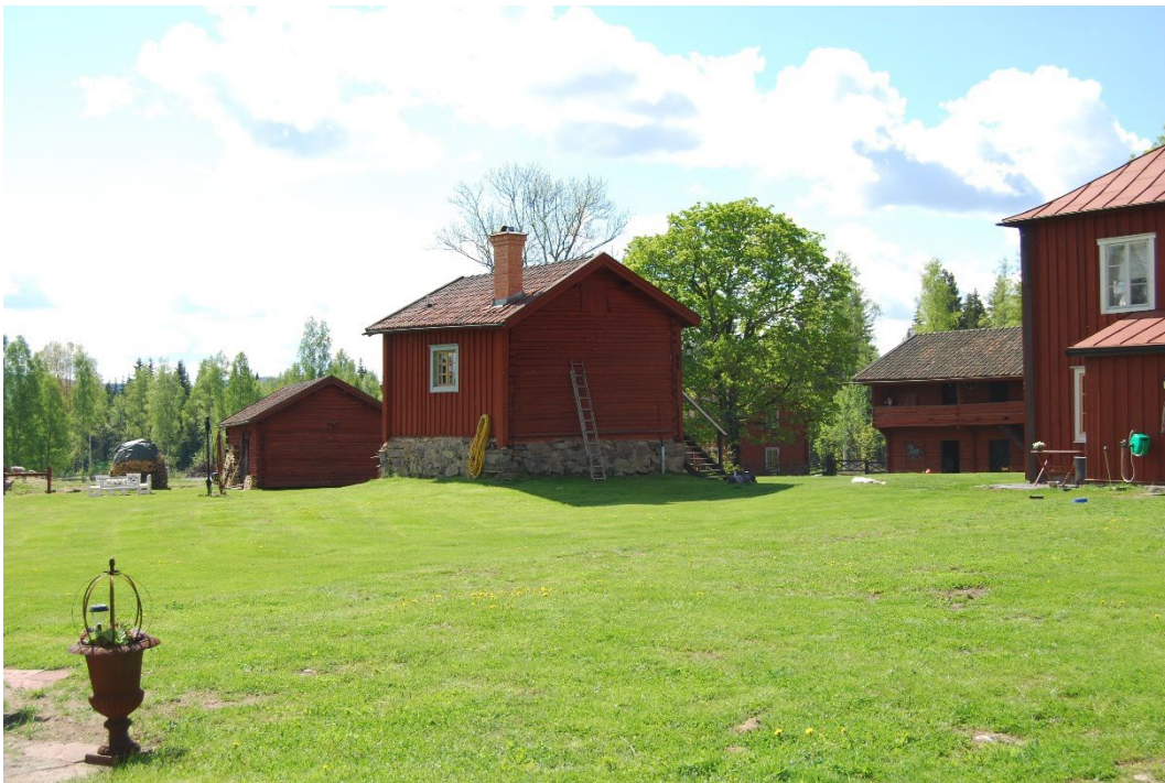
Figur 3. Gårdsmiljön präglas av månghussystemet.