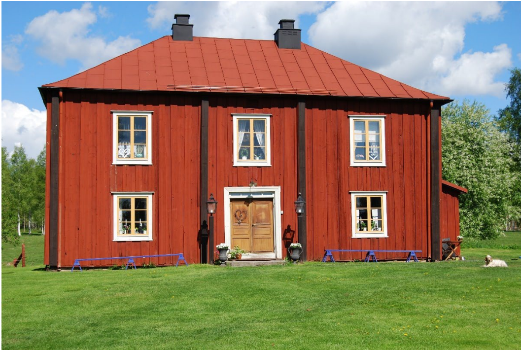
Figur 2. Huvudbyggnaden.