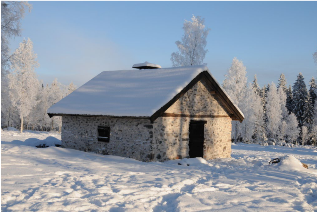
Figur 6. Gårdssmedjan, nyligen restaurerad.