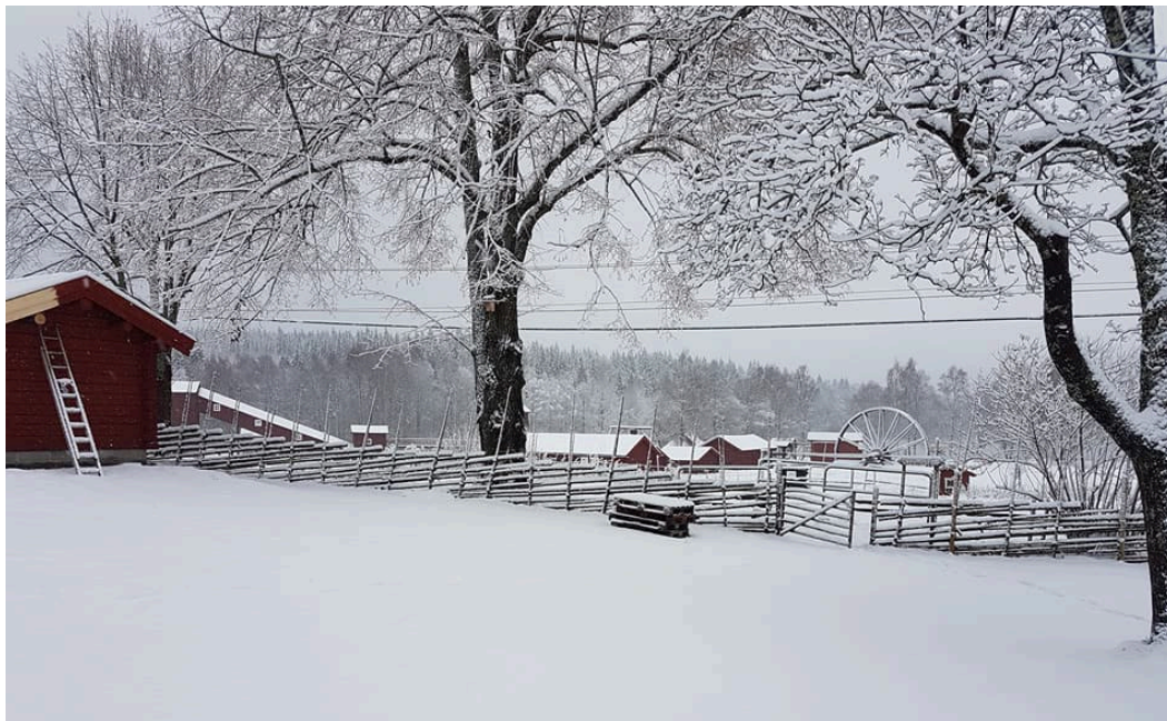
Figur 2. Utsikt ner mot Gruvmuseet.

Bergsmansgården ligger i Marnäs i östra delen av nuvarande Ludvika stad. Gården är till övervägande delen från 1700-talet men har rötter i 1500-talet då Marnäs tillhörde Norrbärke socken.