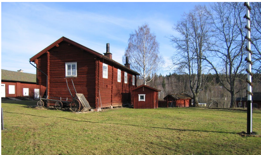
Figur 3. Miljön präglas av gårdens rödmålade timmerhus.