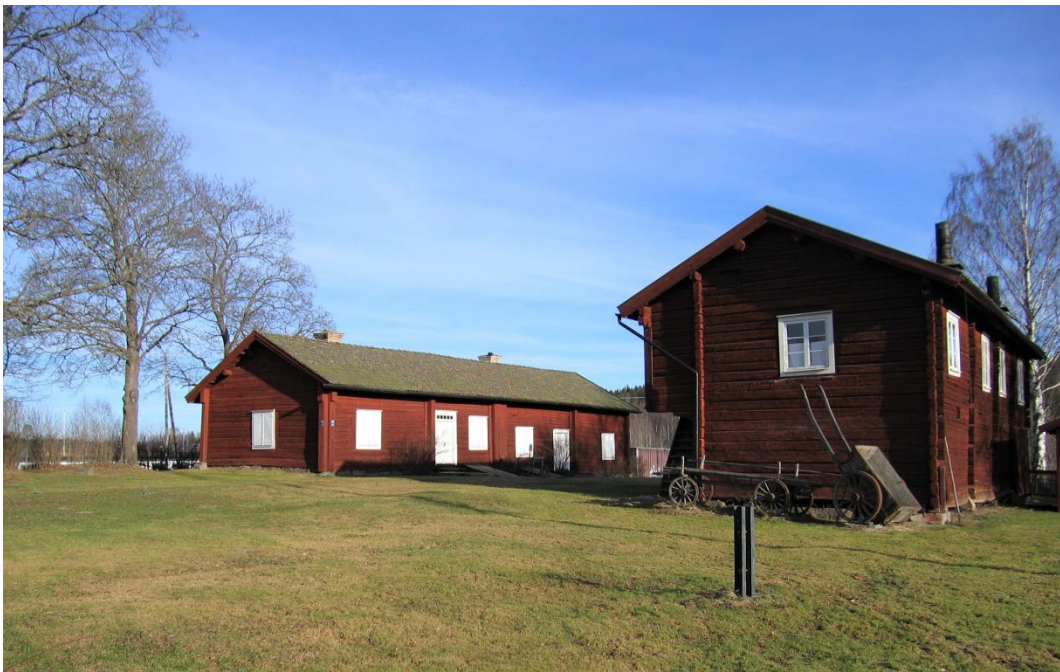
Figur 6. Delar av fägården, ladugården och museiladan.