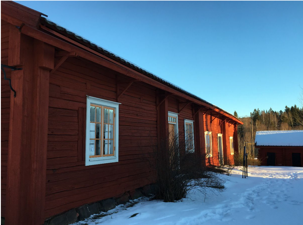
Figur 5. Mangårdsbyggnaden.