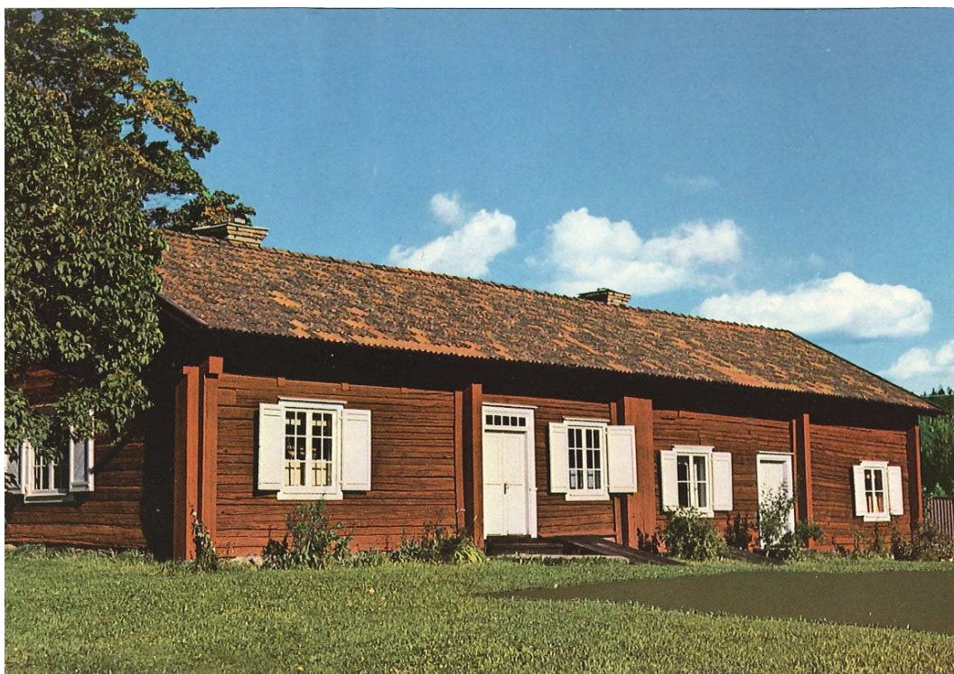
Figur 1. Mangårdsbyggnaden, ursprungligen två ihopbyggda stugor.

År 1922 sålde släkten gården till den nybildade Ludvika Hembygdsförening, som genom att visa gården bidrog till att etablera Bergslagen som en utmärkande del av svensk kulturhistoria. Idag är bergsmansgården en del av Ludvika Gammelgård, Ludvika hembygdsförenings hembygdsgård.