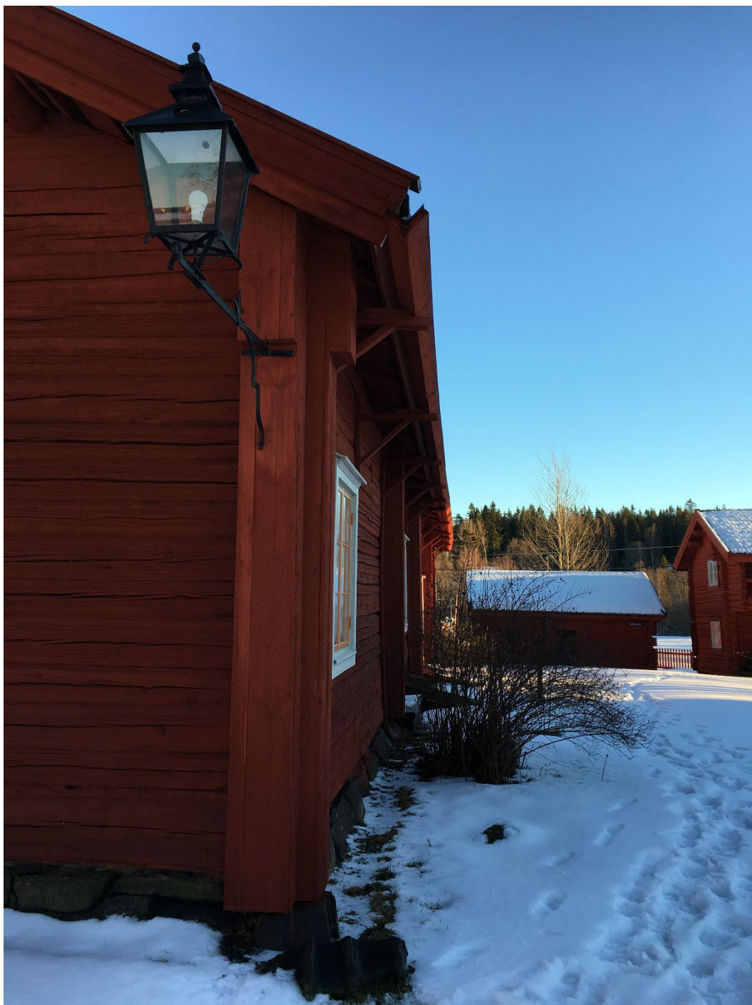
Figur 4. Mangårdsbyggnaden till vänster i bild, bakgrunden vedboden och Vals-Pelles loftbod.