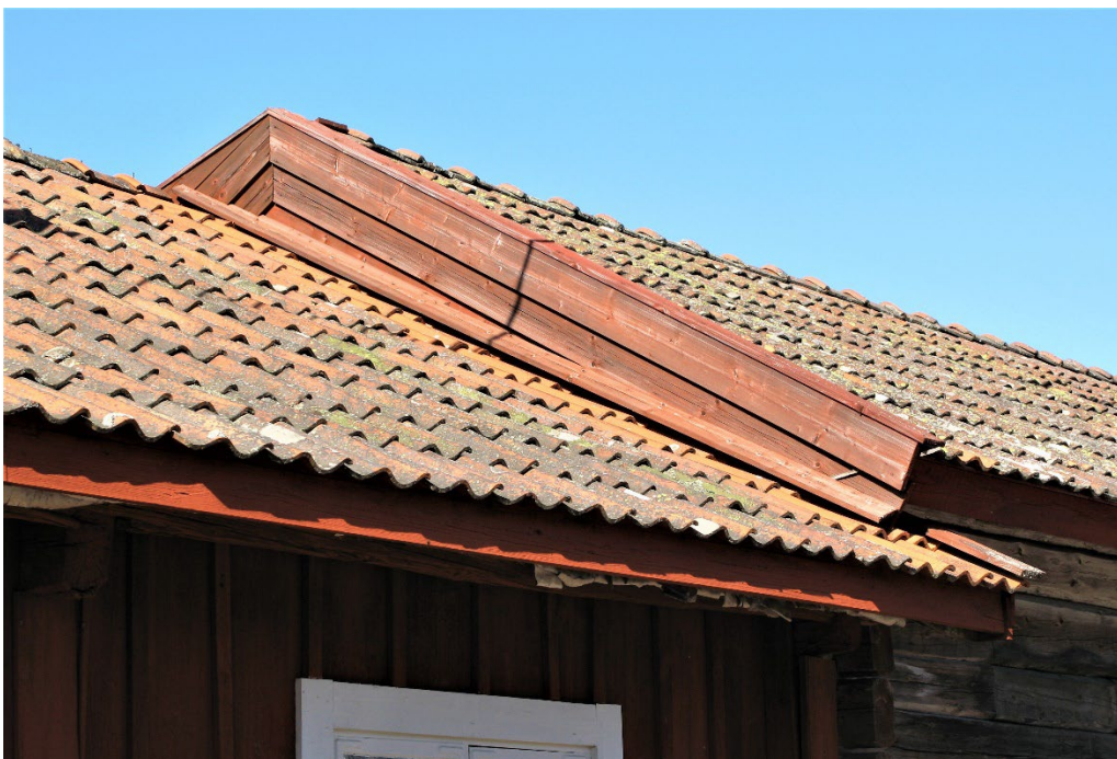
Figur 5. Möte mellan stugans tak och den intilliggande portliderbyggnaden.