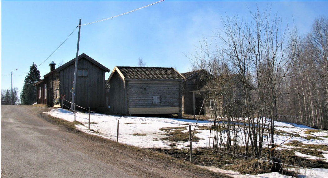
Figur 1. Byn Norr Bergsäng ligger på en höjd i landskapet.