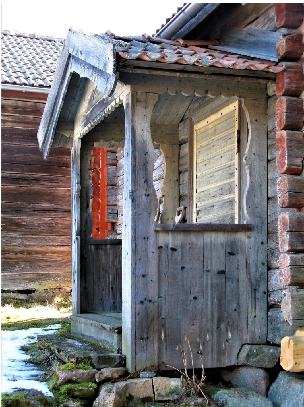
Figur 3. Farstubron till stugan.