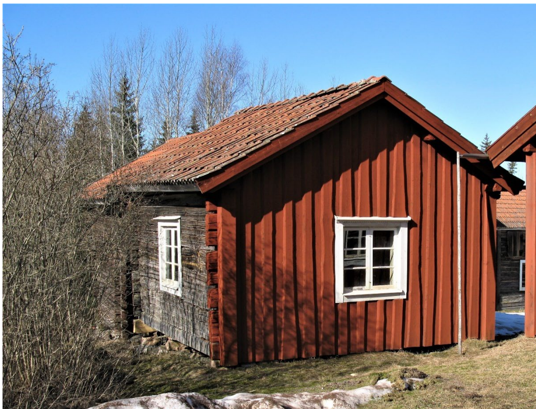
Figur 6. Sommarstugan, med en panelad gavel mot gatan.

Sommarstugan ligger i vinkel mot stugan och har 11 timmervarv till takfot. Sommarstugan har likt stugan panel på östra gaveln mot vägen målad Faluröd samt farstukvist mot gården. Fönsterfoder och bågar är vitmålade. Sadeltaket är belagt med lertegel. Byggnaden saknar eldstad vilken syns på avsaknaden av skorsten. Invändigt finns krikar i märlor i taket, troligen ursprungligen för upphängning av brödkakor.