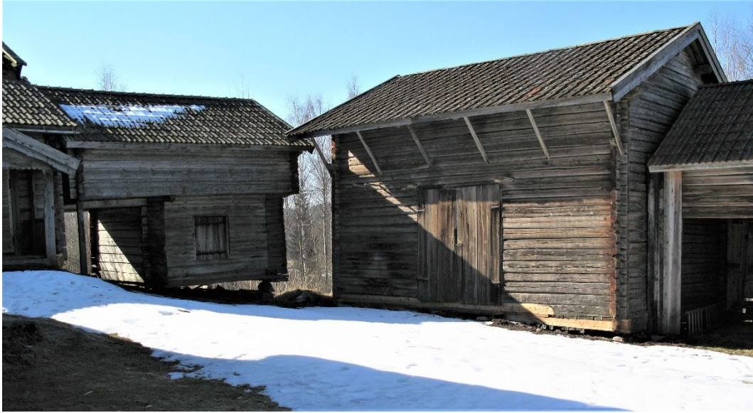
Figur 7. Portliderbyggnaden med före detta härbre samt tröskladan.