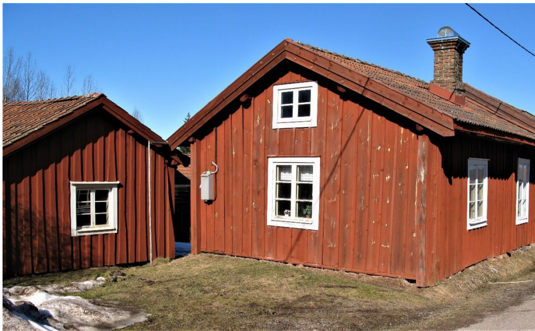
Figur 2. Stugan. Till vänster syns sommarstugan.

Invändigt finns vardagstuga och kammare. Fristående mot innerväggen finns murstock med härd, en inmurad kistspis och bakugn i vardagsstugan. Vardagsstugan har en allmän karaktär i inredning och ytskikt som stilmässigt kan hänföras till 1930-talet. Det finns dock byggnadsdetaljer som kan härröras till 1800-talet såsom dörrblad, omfattningar och tapetlager. Här förekommer också äldre murverk, breda innertaksbrädor under papptaket och ingångsdörren. Stugan har en oninredd vind.