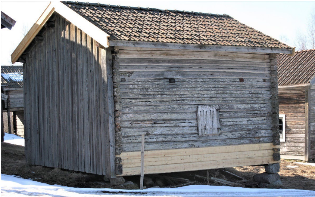
Figur 8. Ladan med brädpanel på västra gaveln.