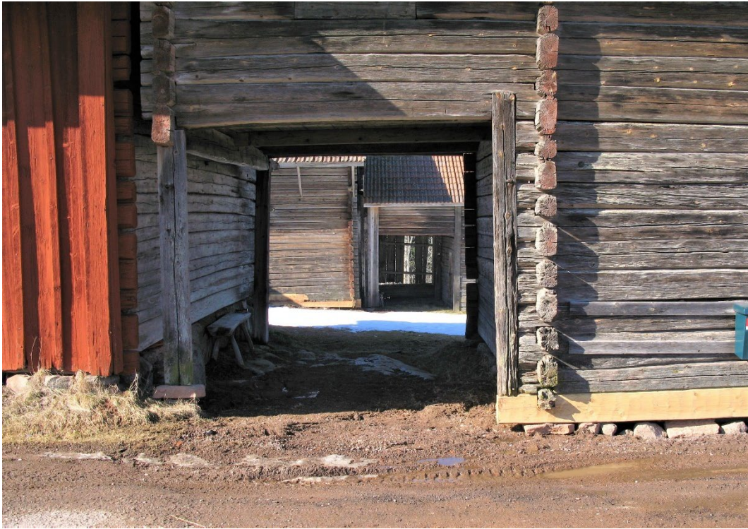
Figur 9. Portluderbyggnad mot vägen. Noterna mötet mellan timmerfasaden och stugans panelade fasad.