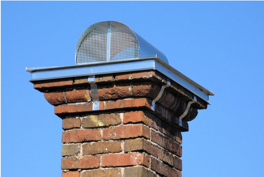
Figur 4. Detalj, skorstenen på stugan.