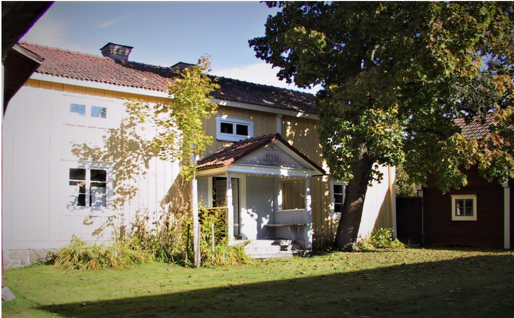
Figur 4. Manbyggnaden med östra nattstugan skymtandes i bakgrunden. Lummig grönska präglar miljön.