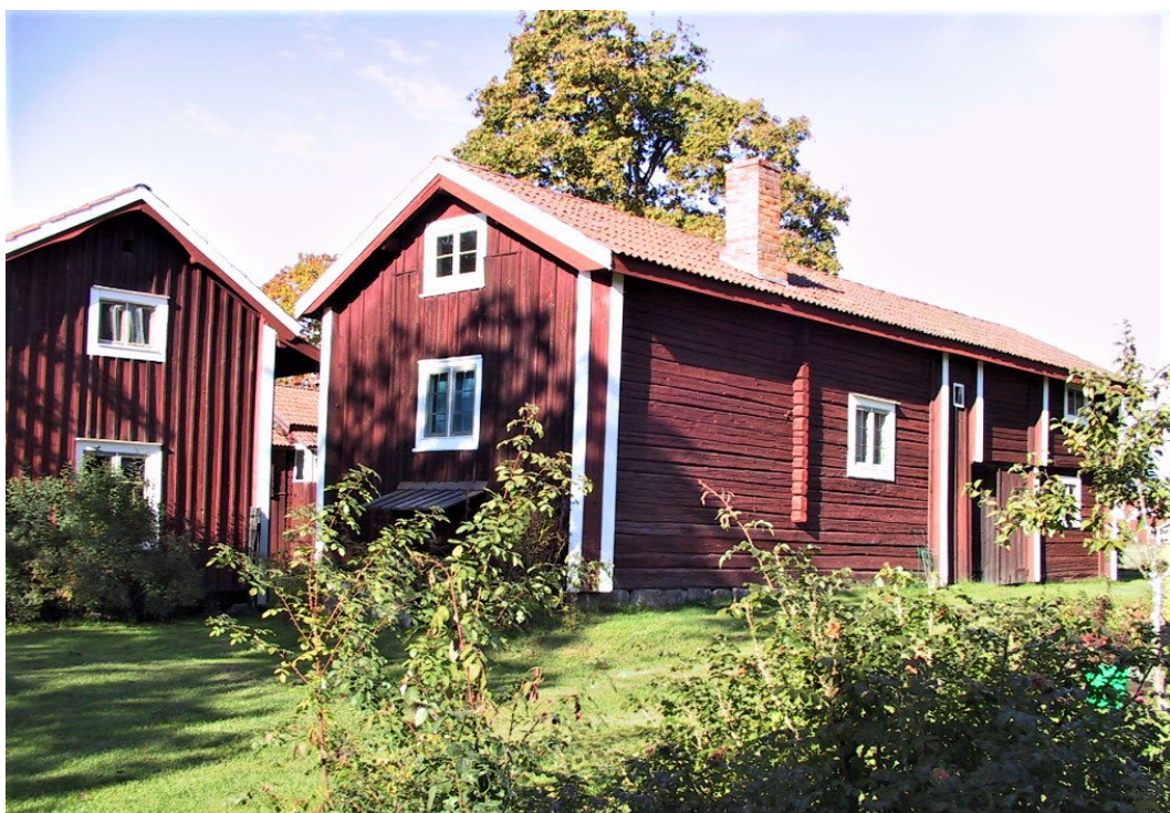
Figur 3. Ekonomibyggnader. Östra nattstugan till höger och södra längan till vänster.