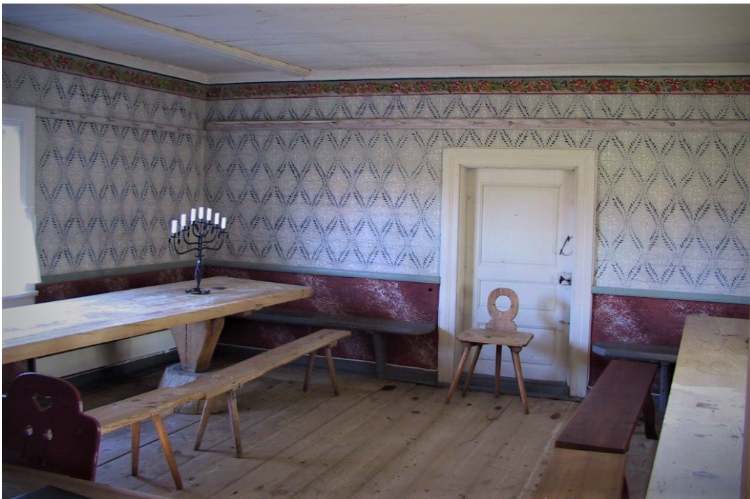
Figur 5. Manbyggnadens gästbudssal.