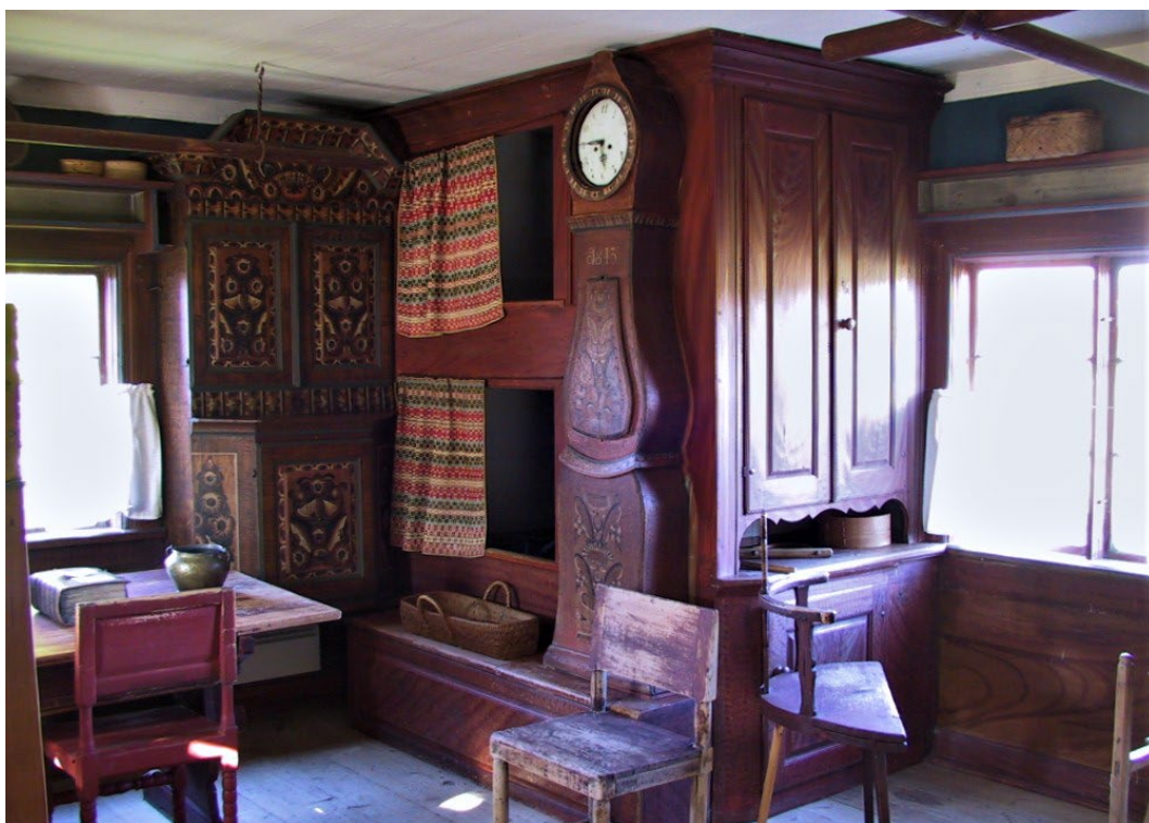
Figur 1. Manbyggnadens interiör är välbevarad med ursprungliga kurbitsmålningar. Till höger skymtar en av takstängerna.