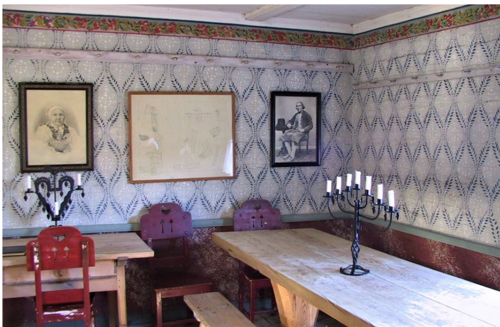
Figur 2. Bevarade väggmålningar i gästrådssalen.