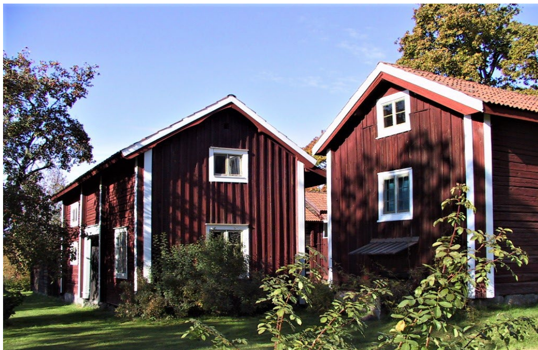
Figur 6. Södra längan med portlidret längst till vänster i bild.

Portliderhuset, tidigt 1800-tal, består av ett stall med höskulle och drängstuga som byggts om till ett modernt kök.