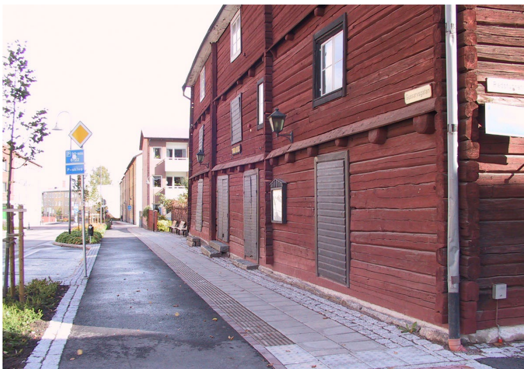
Figur 4. Teaterladans tjärade dörrar och fönsteromfattningar mot Gussarvsgatan.