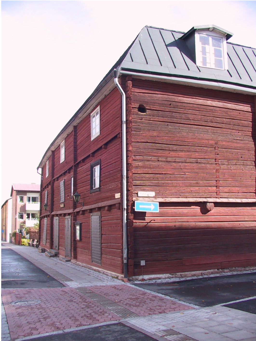
Figur 3. Den sydvästra väggen mot Rådstugränd.