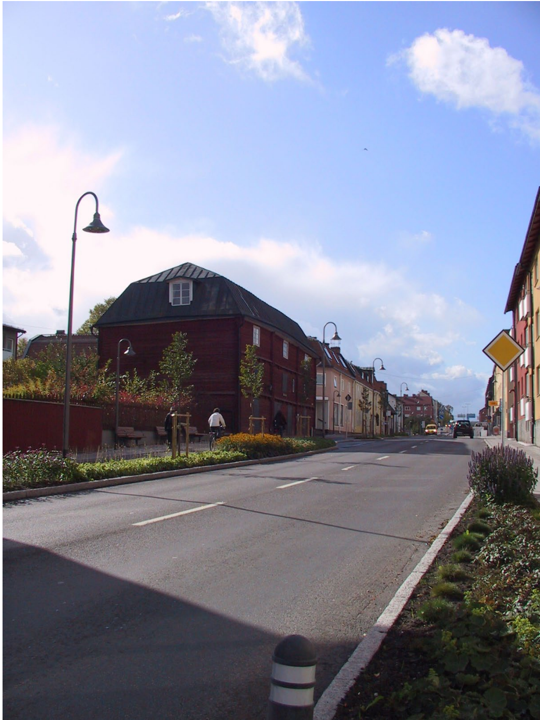
Figur 1. Stadsmiljön kring Teaterladan längs Gussarvsgatan.