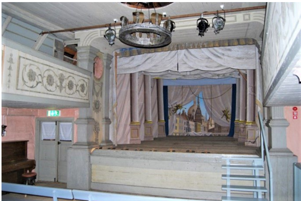
Figur 2. Den välbevarade teatersalongen.

1961 anordnades elektrisk uppvärmning och sanitär utrustning. De två klädlogerna i mellanvåningen utökades med ytterligare två. I andra våningen inreddes ett museum till minne av Hedemorabördige skådespelaren August Lindberg (1846–1916).