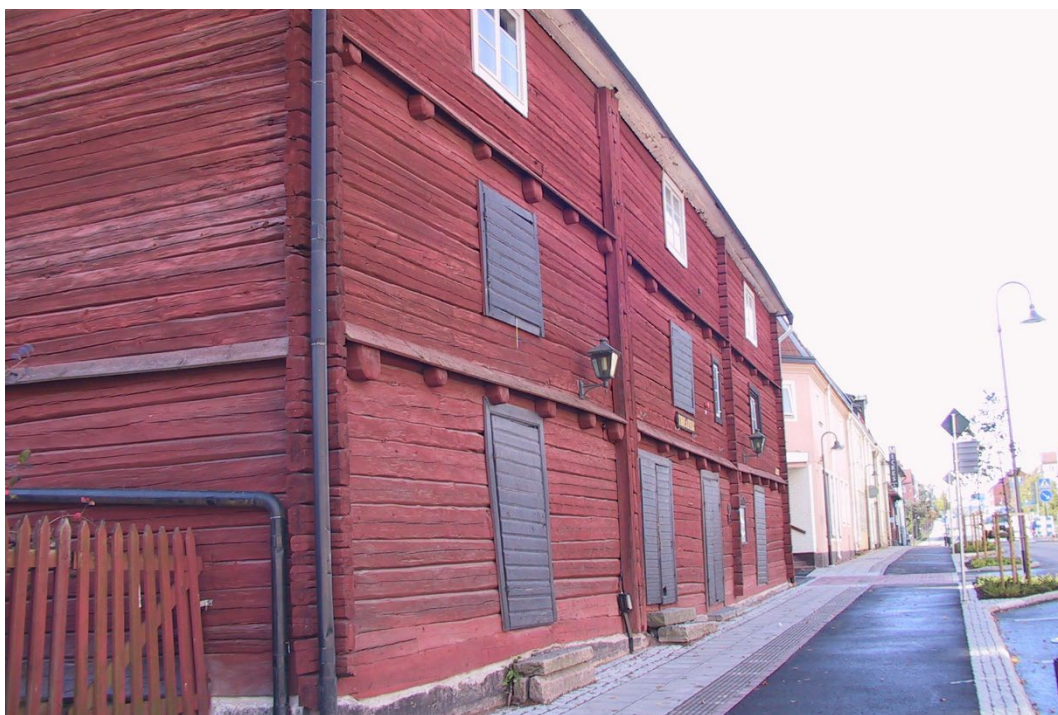
Figur 5. Rödfärgade timmerfasader med rektangulära knutskallar.