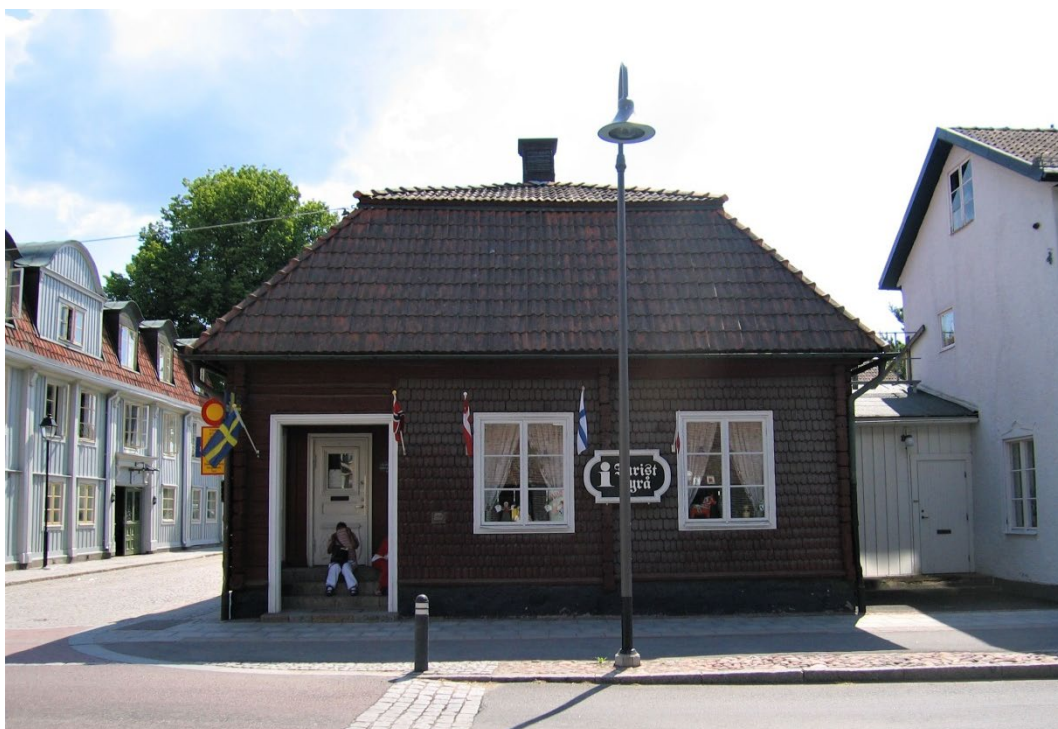
Figur 4. Apoteksbyggnadens spånfasad. Till höger laboratoriebyggnaden med grå putsade fasader.