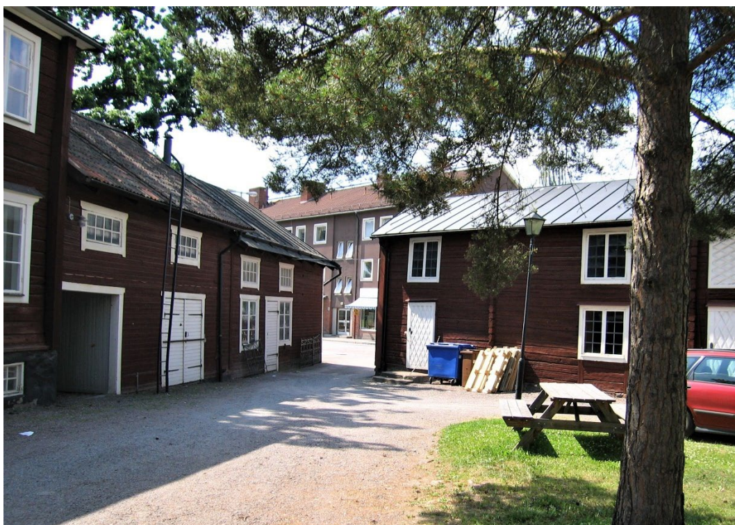
Figur 9. Apoteksgårdens ekonomibyggnader. Till vänster södra boden och till höger före detta stall.