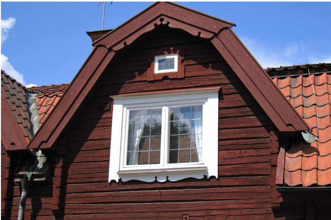
Figur 7. Frontespisgavel mot Stora Torget.