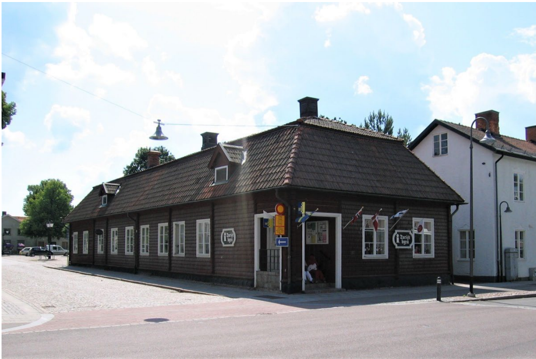
Figur 1. Apoteksbyggnaden och den gamla laboratoriebyggnaden (till höger) i korsningen Gussarvsgatan/ Kyrkogatan.

År 1897 byggdes apoteket om efter ritningar av arkitekten Lars Israel Wahlman. Vid detta tillfälle tillkom frontespisgavlarna mot torget och fasaderna mot gården fick sin nuvarande utformning. Huset försågs med tidstypiska detaljer i nationalromantisk stil. 1931 och 1934 gjordes vissa ombyggnader av fasaden mot Långgatan enligt ritningar av Wahlman. Efter att apoteksverksamheten flyttat från huset har byggnaden anpassats för nya verksamheter.