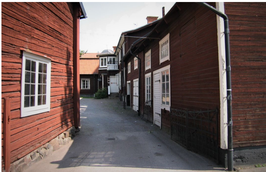
Figur 3. Gården sedd från Myrgatan.