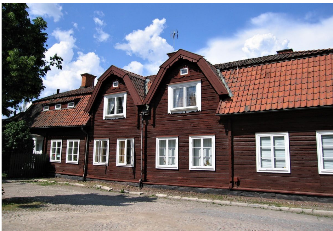
Figur 5. Fasaden mot Stora Torget.