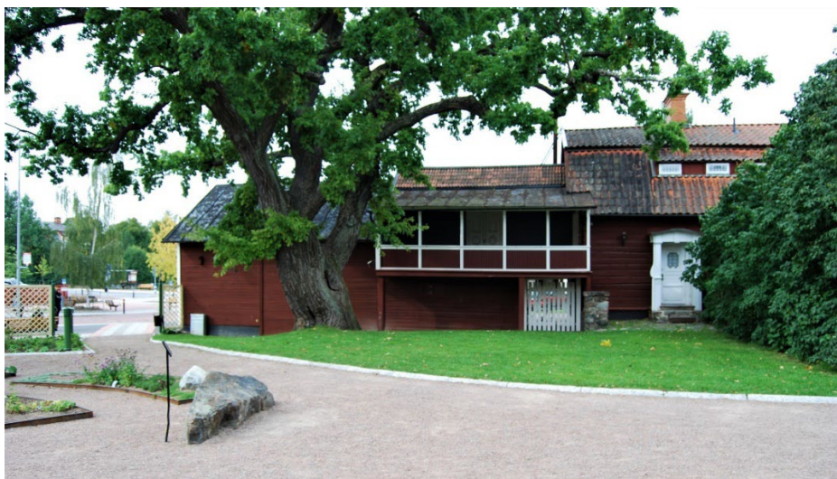
Figur 2. Apoteksträdgården.

Gamla Apoteket är centralt beläget vid Stora Torget i Hedemora. Apoteksgården utgör en viktig del av den ålderdomliga stadsmiljön vid Stora Torget, som ingår i riksintresseområde för kulturmiljövården Hedemora stad. Fastigheten gränsar mot Stora Torget, Långgatan, Gussarvsgatan och Myrgatan. Apoteksgården är kringbyggd. Förutom den vinkelbyggda apoteksbyggnaden med apotekarbostad finns en före detta laboratoriebyggnad samt uthus. Mellan apotekshuset och Hedemora stadshotell ligger parken Apoteksträdgården.