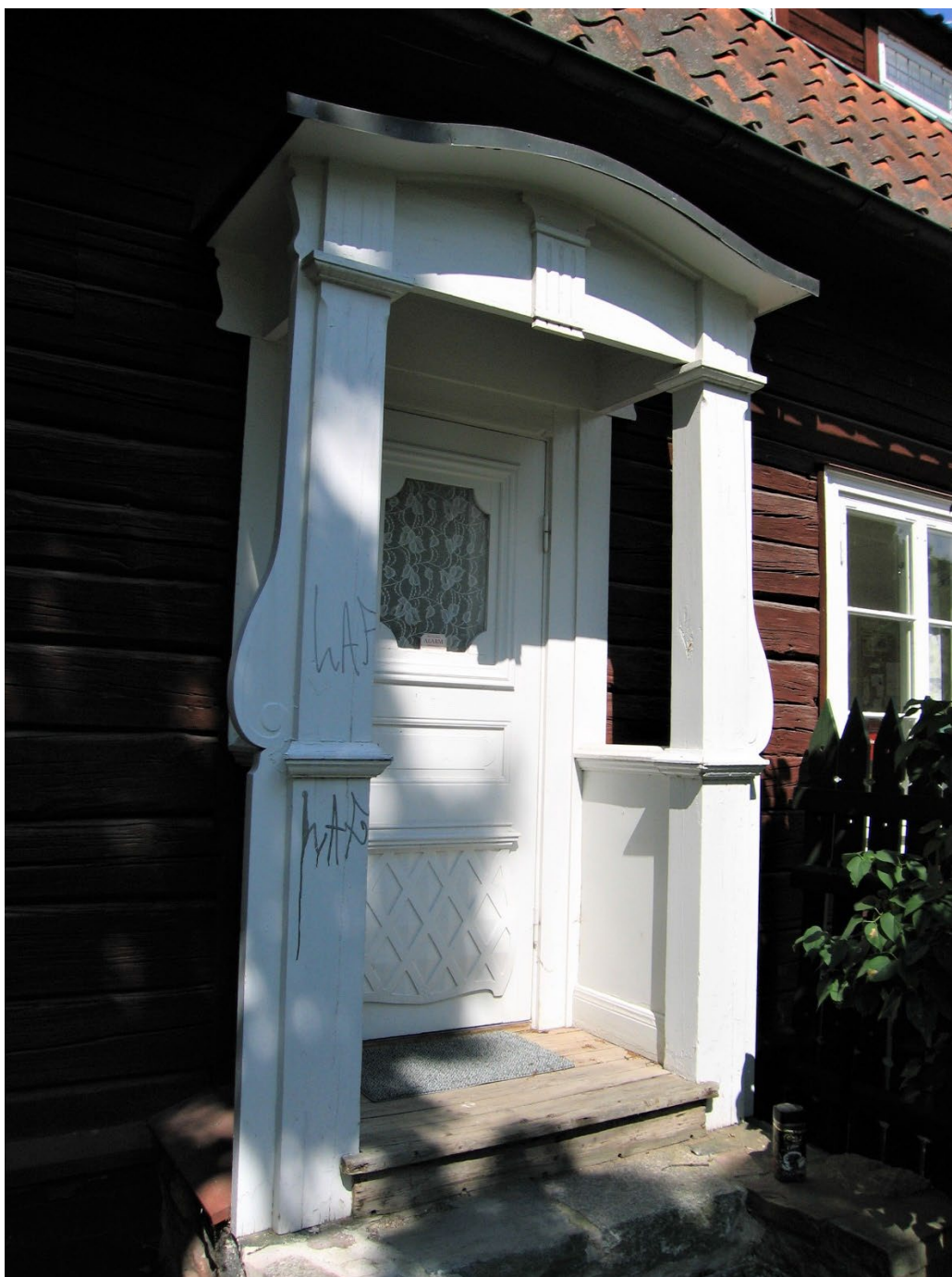
Figur 8. Förstukvist mot gårdssidan med dekorativa detaljer i nationalromantisk stil.