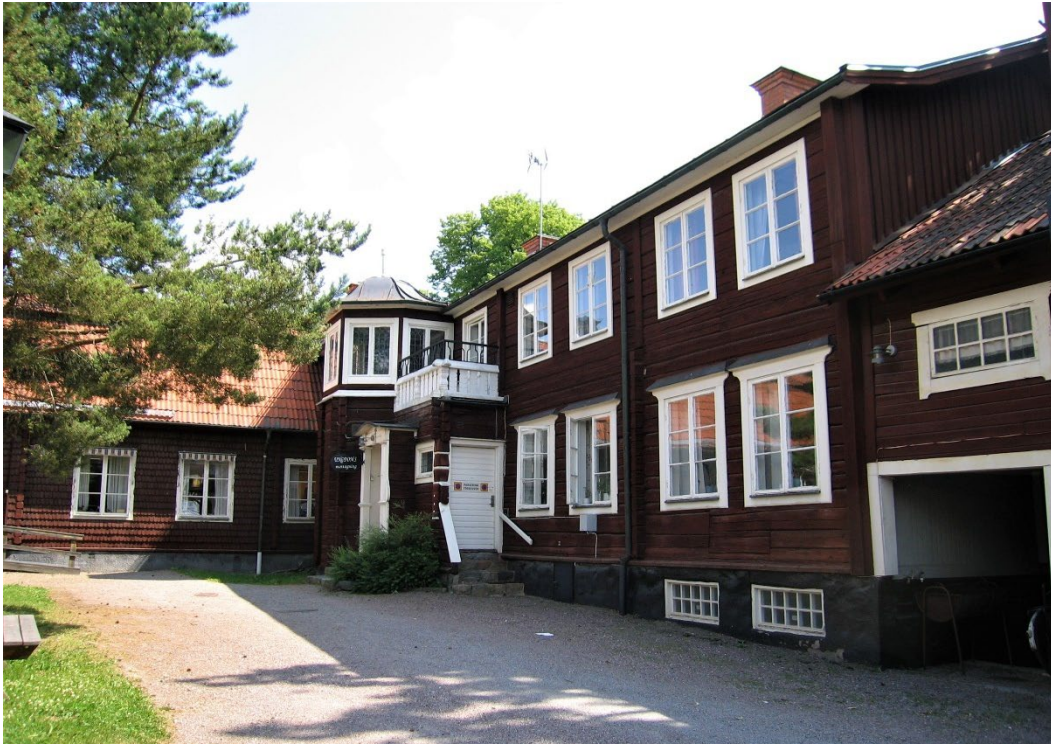
Figur 6. Entrepårtiet mot gårdssidan har fått en tornliknande utformning.