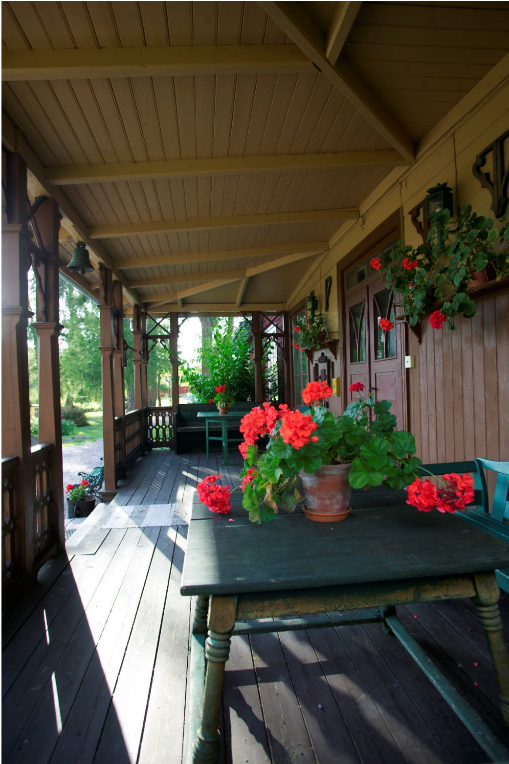
Figur 4. Huvudbyggnadens veranda.