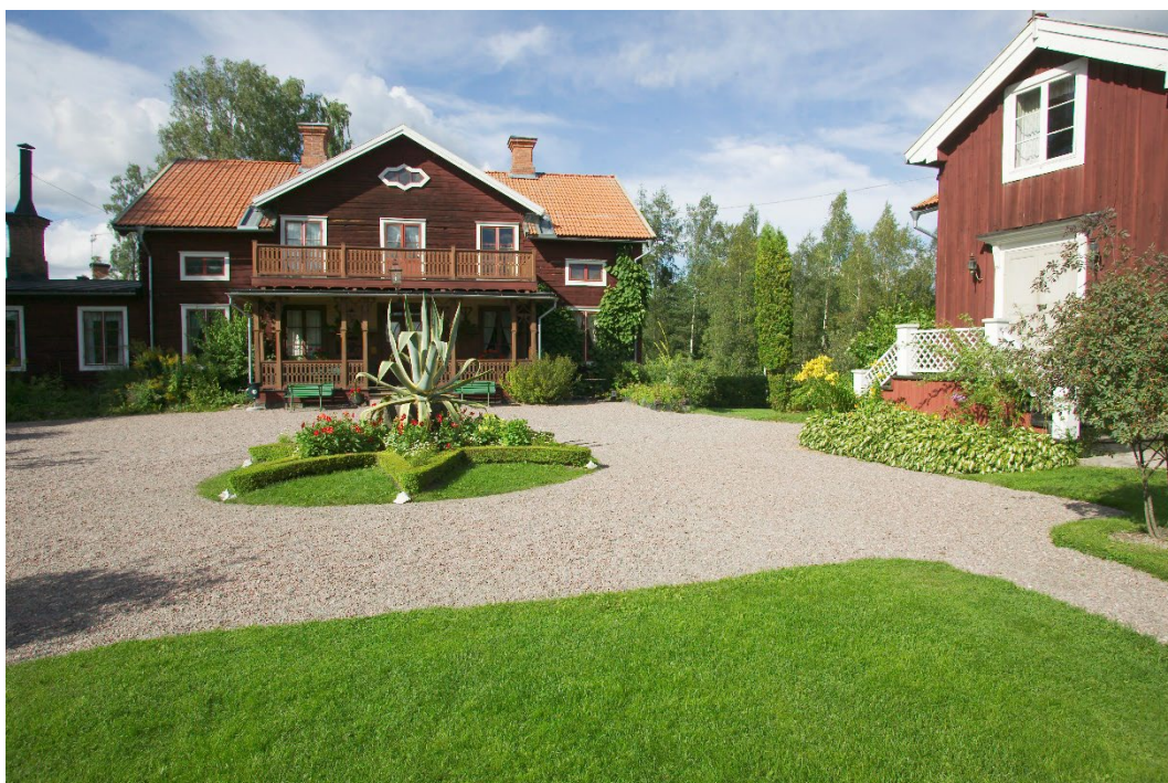
Figur 2. Huvudbyggnaden och kontorsflygeln till vänster.

Bebyggelsen på fastigheten består av en huvudbyggnad, en kontorsflygel och en smedja. Mangårdsbyggnaden är uppförd i 1 ½ våning av rödfärgat timmer med tegeltak. På långsidorna finns två frontespiser. En större veranda med lövsågerier, krönt av en balkong, pryder långsidan mot söder. På västra gaveln finns en lägre utbyggnad för kök med mera i en våning med plåttak. Interiören har en i huvudsak sexdelad plan. Interiörens fasta inredning är välbevarad med prägel av sent 1800-tal. Den omfattar bland annat dekorationsmålade tak i två rum, ett flertal kakelugnar och hög bröstpanel i matsalen.