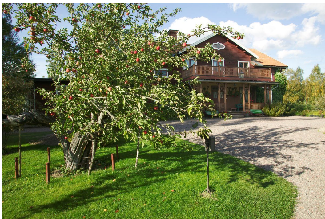
Figur 1. Moderträdet till Gubbäppet, 350 år gammalt.

Till Stora Hyttnäs hör en stor trädgård och park. En kort allé med lärkträd från första hälften av 1800-talet leder fram till gården. Invid allén ligger grunden efter en äldre mangårdsbyggnad. Trädgården är anlagd i så kallad tysk stil med symmetriskt ordnade, slingrande gångar och en stor rundel med prydnadsplanteringar på den grusade gårdsplanen. Det står bland annat ett flertal buskar, träd och två syrenbersåer samt rabatter med perenner. I södra delen av trädgården finns rester av den gamla fruktträdgården och en mindre, nyanlagd köksträdgård. Den östra delen av fastigheten upptas av ett mera parkartat område med stora granar med en slingrande gångstig. Längst i söder finns en smedja och sannolikt rester av en av de ruddammar som fanns på gården. I trädgården växer moderträdet till sorten Gubbäpple, ett av Dalarnas äldsta fruktträd, ca 350 år gammalt.