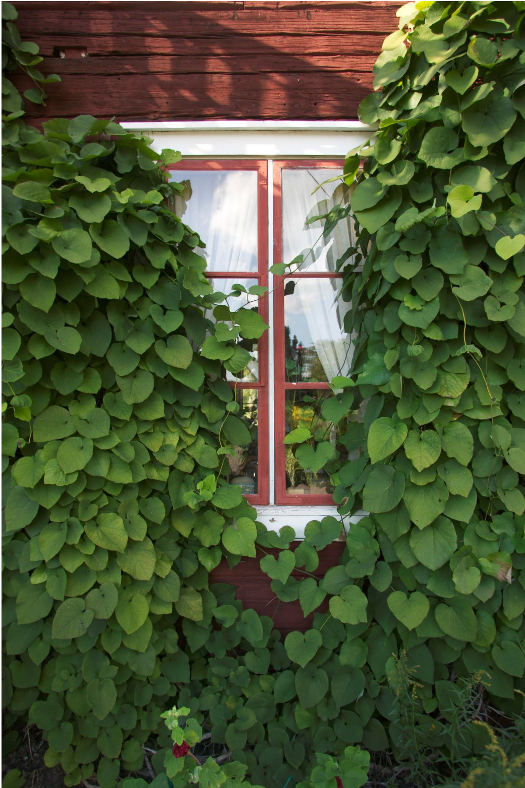
Figur 3. Växtligheten präglar miljön på fastigheten.