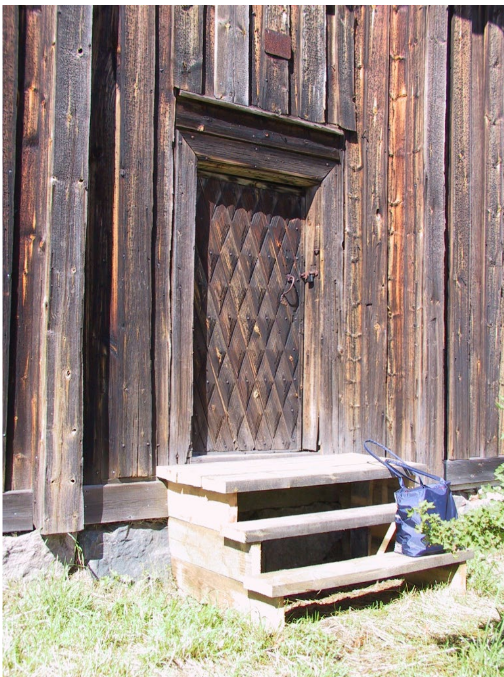
Figur 3. Ytterdörren med rombmönster. Notera knutlådorna på vardera sida.