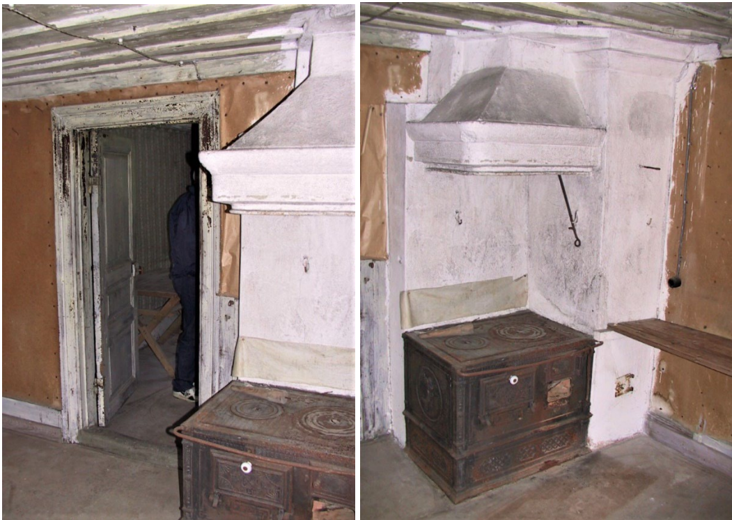
Figur 5-7. Vålbevarad interiör i stugan.