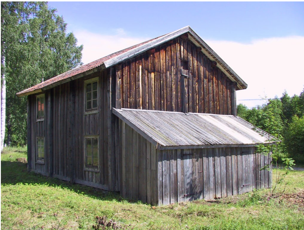
Figur 2. En av stugans uthusbodar.

Byggnadens planlösning är i huvudsak ursprunglig. Det finns fyra symmetriskt placerade spisrum med en genomgående farstu på vardera av de två våningsplanen. I nedervåningen har dock, sannolikt i slutet av 1800-talet, spisrummen slagits ihop till två enrumslägenheter. Inredningen såsom äldre spisar, äldre snickerier samt ytskikt är välbevarade.