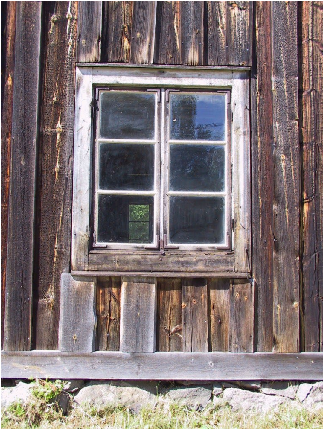
Figur 4. Stugan vilar på naturstensgrund och träpanelen tros ha tillkommit på 1800-talet.