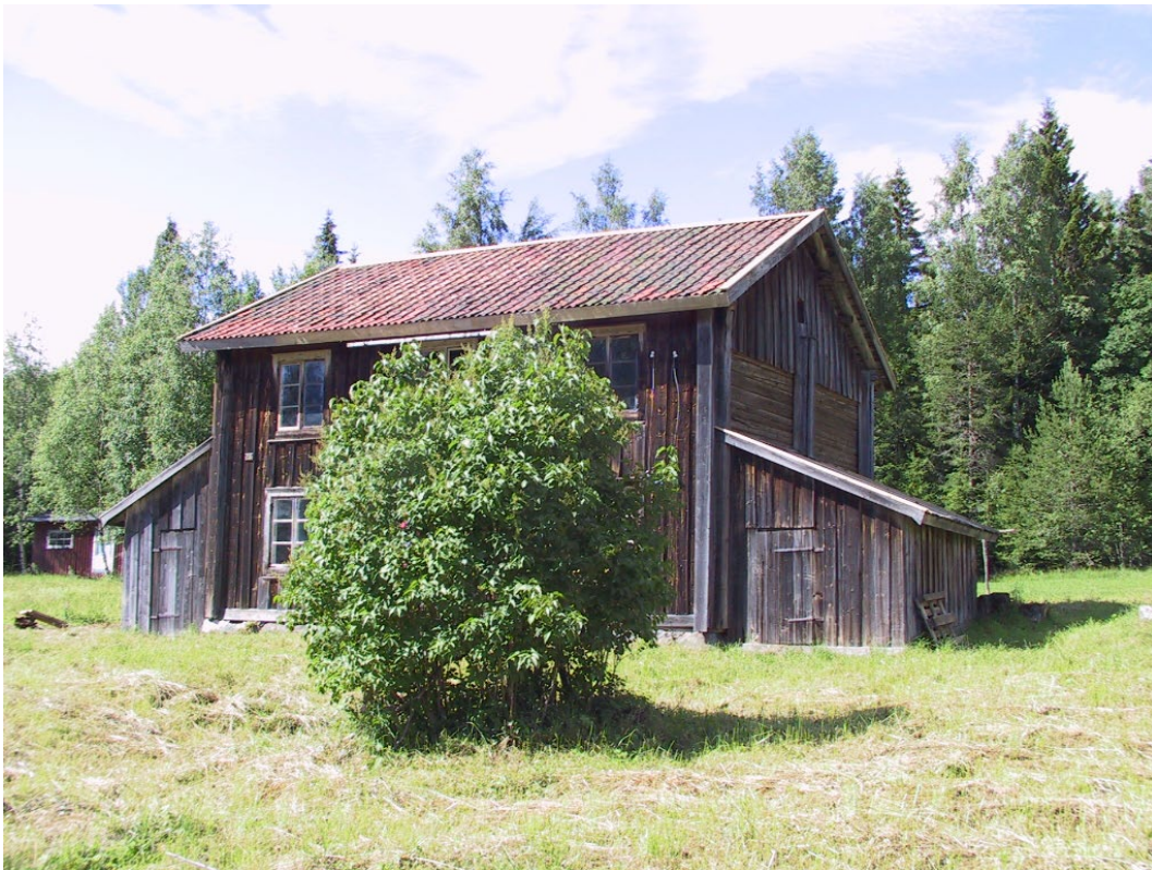
Figur 1. Solgruvestugan i Vintjärn ligger i en sydsluttning.

Vintjärn ligger i nordöstra delen av Falu kommun. Gruvbyn, ursprungligen fäbodar, ligger på en sydsluttning, ca 300 meter över havet. Sedan 1725 har här bedrivits gruvdrift, då den första järnmalmfyndigheten hittades. Tidigare fanns här järnväg som kopplade Vintjärn till Linghed och Norrsundet, för transport av malmen.