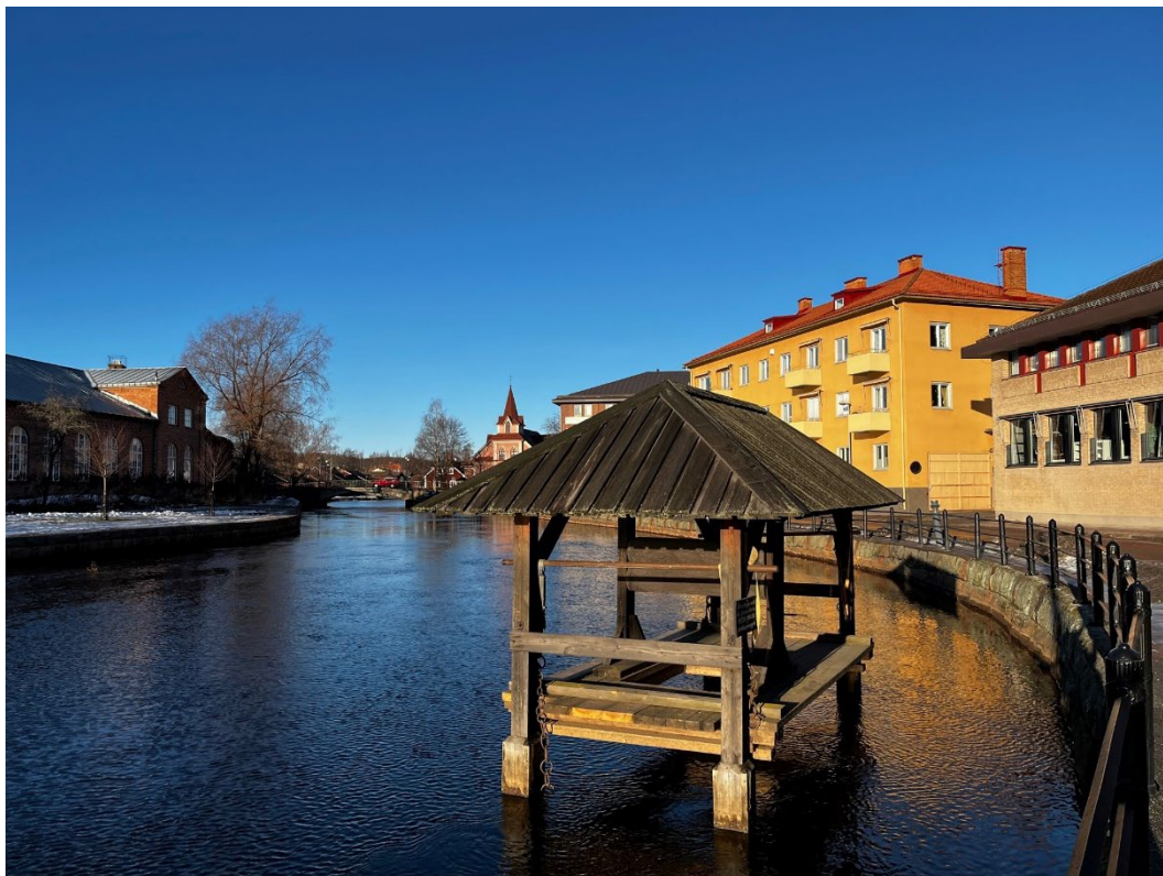
Figur 1. Herdins skölbrygga ligger i centrala Falun, utmed Östra Hamngatan.

Herdins skölbrygga ligger i Faluån i centrala Falun. Bryggan ligger vid den stenskodda kajen nedanför Stadshusgränd utmed Östra Hamngatan.