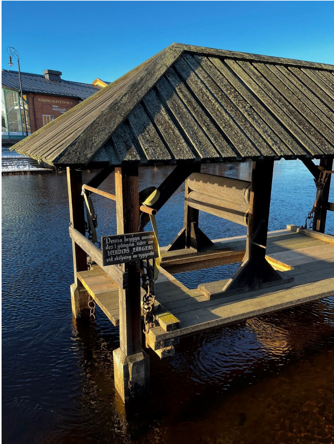
Figur 2. Bryggans mangel användes för att pressa vatten ur tyget efter sköljning.