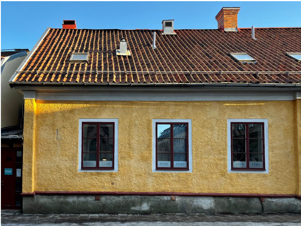
Figur 5 - 6. Rektorsbostaden.