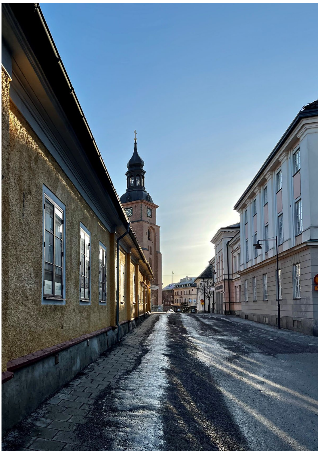
Figur 3. Åsgatans bredd vid Hammars konditori och rektorsbostaden är bevarad sedan 1700-talet.