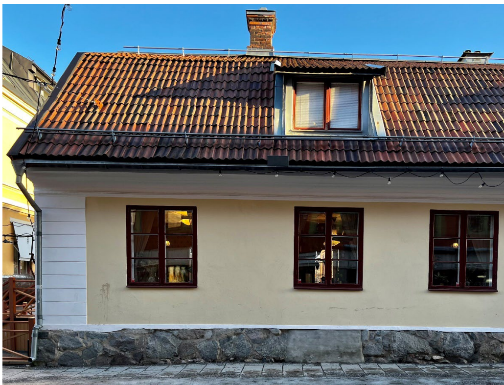
Figur 4 - 5. Hammars konditori.