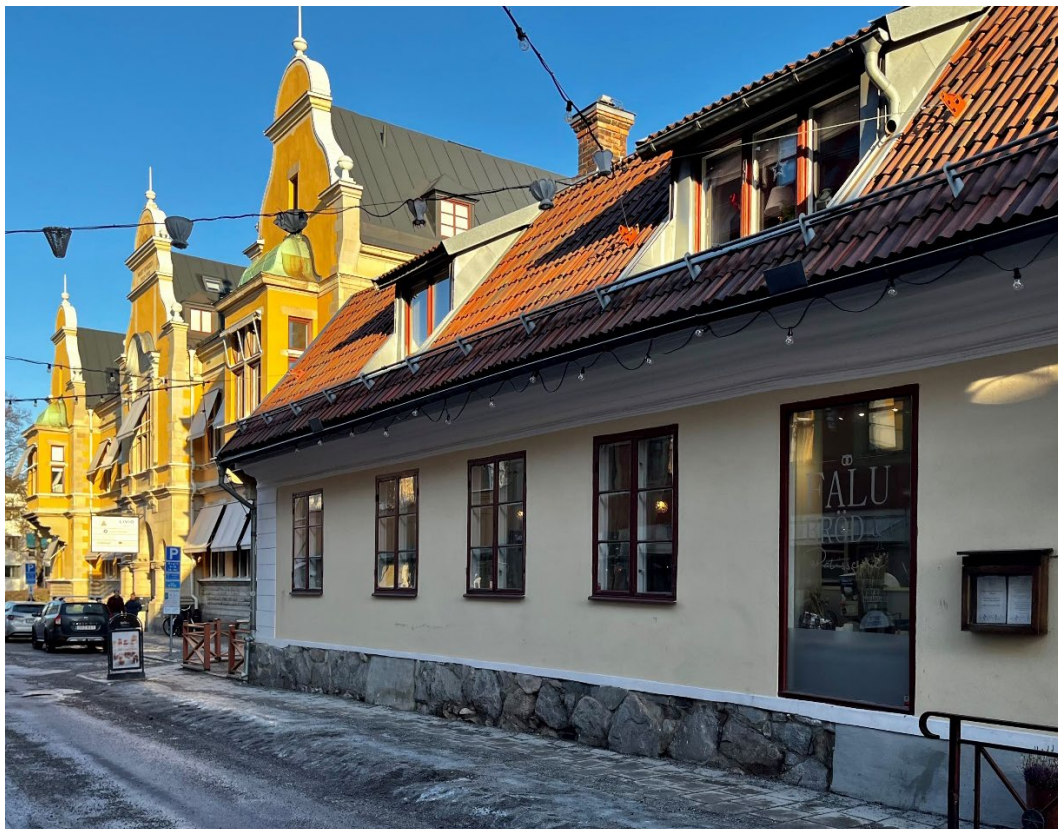
Figur 2. Åsgatan sedd norrut, med gamla posthuset i bakgrunden.

Hammars konditori och rektorsbostaden ligger längs Åsgatan i centrala Falun i kvarteret Posten. Åsgatan sträckning från Stora Torget till Hammars har väl bevarade tidstypiska byggnader från 1700-, 1800- och tidigt 1900-tal. Gatubredden är här densamma som i 1700-talets Falun. Denna korta del av Åsgatan utgör därför ett av de bästa åskådningsexemplen i centrala Falun på det stadsbyggnadshistoriska skeendet efter de stora stadsbränderna vid 1700-talets mitt.