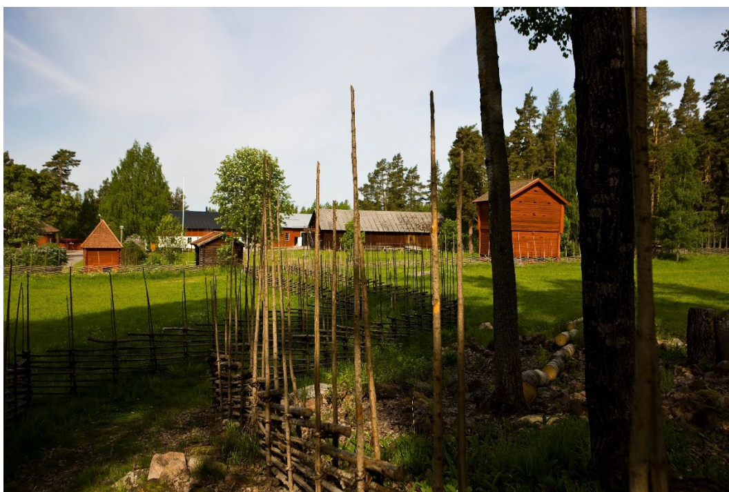
Figur 1. Bergsmansgården sedd från skogsbrynet öster om gården.

Söder om denna ligger den terrasserade barockträdgården med låga terrassmurar, ruddammar, gamla fruktträd och bärbuskar. Norr om mangården utbreder sig mellangården och fägården med svagt terrasserade marknivåer och stenskoningar samt i gräset synliga husgrunder efter nu försvunna byggnader.