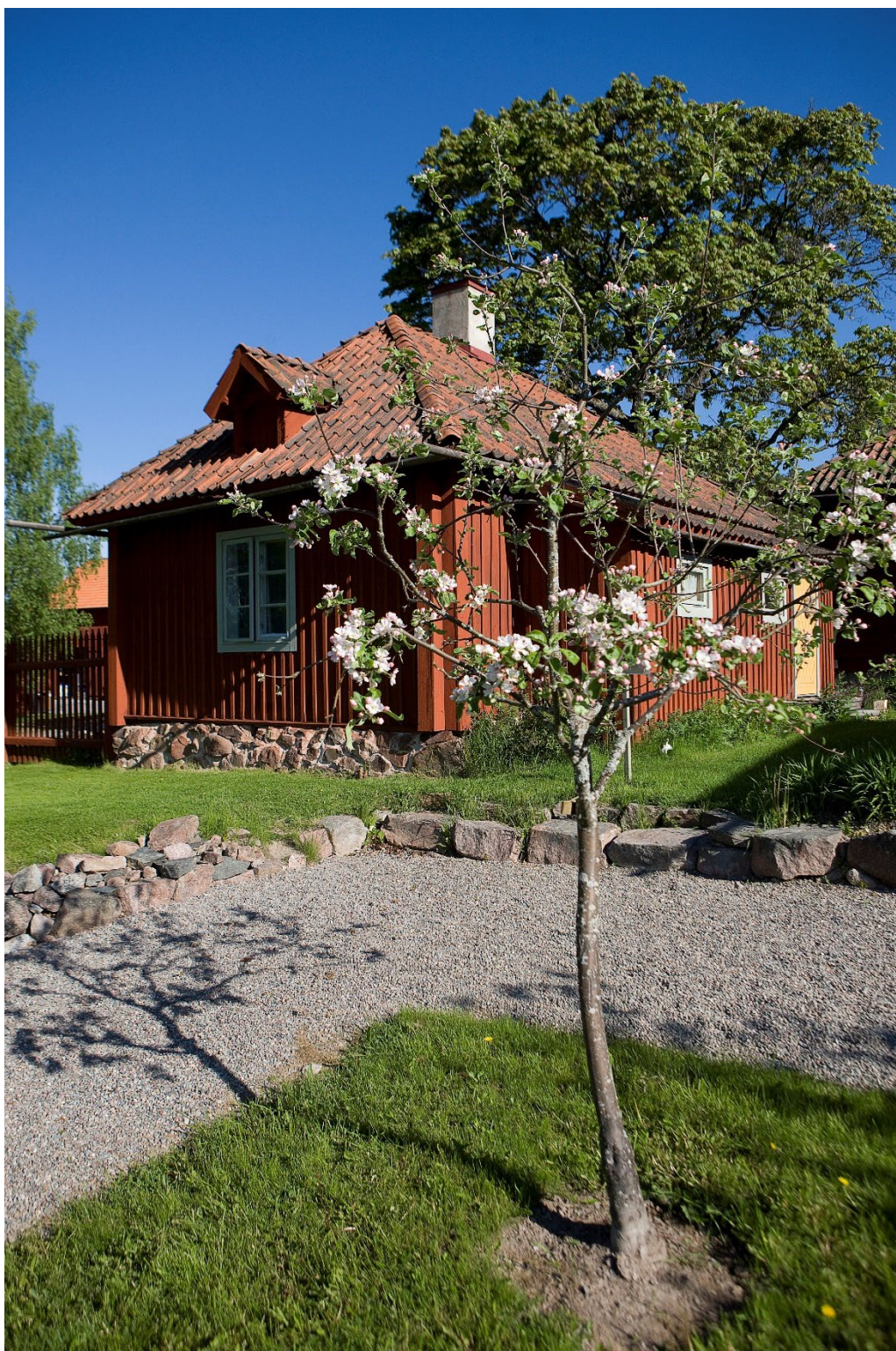
Figur 2. Samtliga byggnader på gården är faluröda. På bilden en av flygelbyggnaderna.