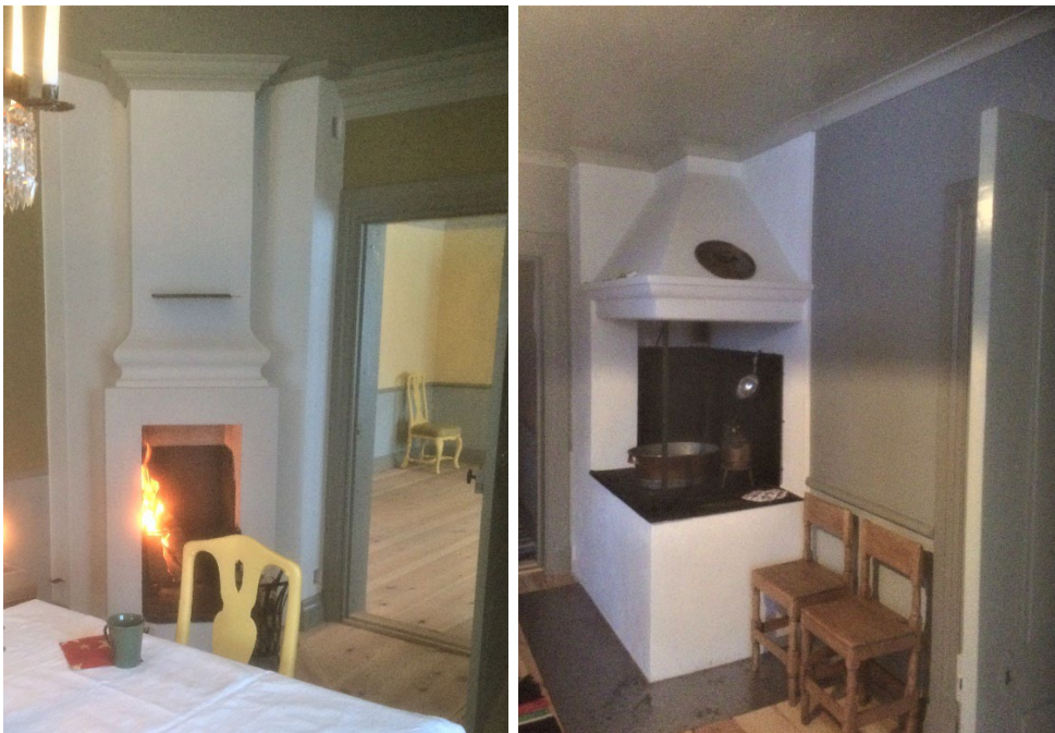
Figur 5. Interiör i mangårdsbyggnaden.