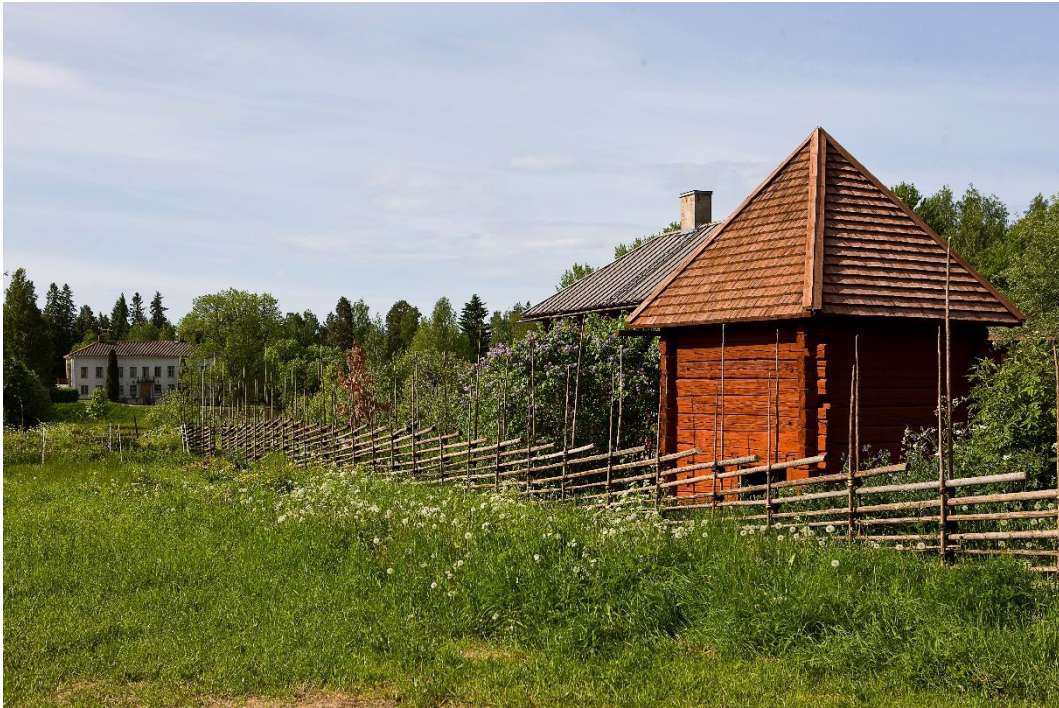
Figur 7. Avtråde uppfört i samma stil som mangården. I fonden Nya Staberg.