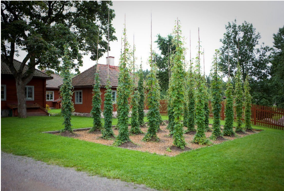
Figur 4. Humlegård.