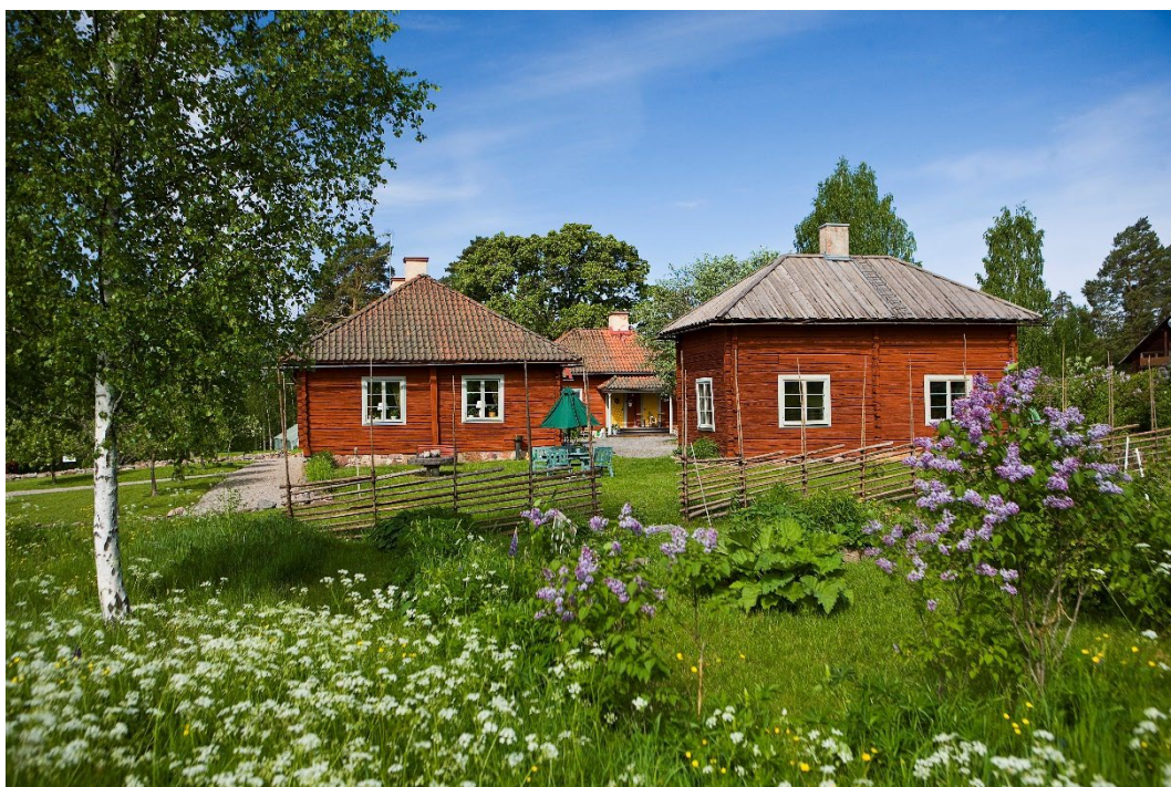
Figur 3. Mangårdsbyggnaden till vänster, till höger en museet med tjärat planktak.

Mangården innehåller sal, vardagsstuga, köskammare och kök. Interiören restaurerades 2018 och återfick 1700-tals prägel. Källaren har gråstensvalv.