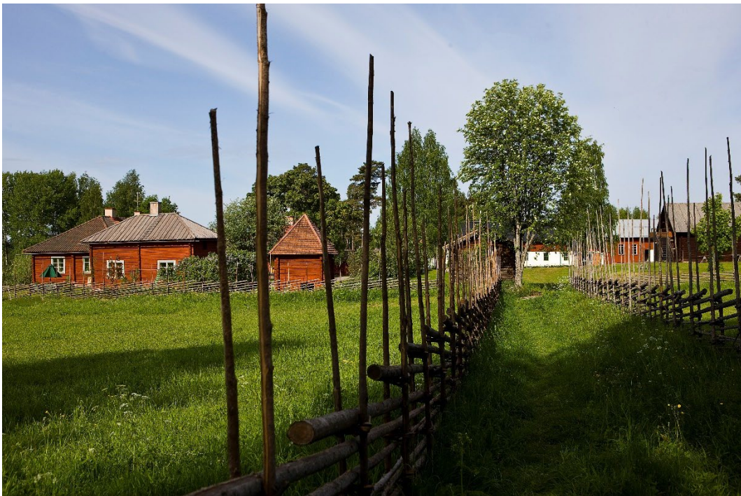
Figur 8. Mangården till vänster i bild.