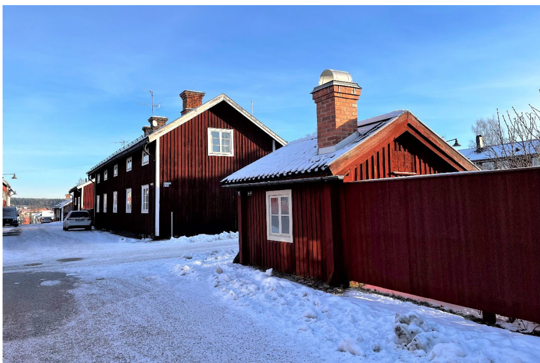
Figur 1. Stugan ligger i korsningen Bondegatan/Bergshauptmansgatan.

Bult Karl-Eriks stuga är en välbevarad gruvarbetarstuga i stadsdelen Elsborg i Falun. Elsborg ingår som en viktig miljö inom världsarvet Falun. På fastigheten finns ytterligare en gruvarbetarstuga som är moderniserad och tillbyggd och fungerar som bostadshus.