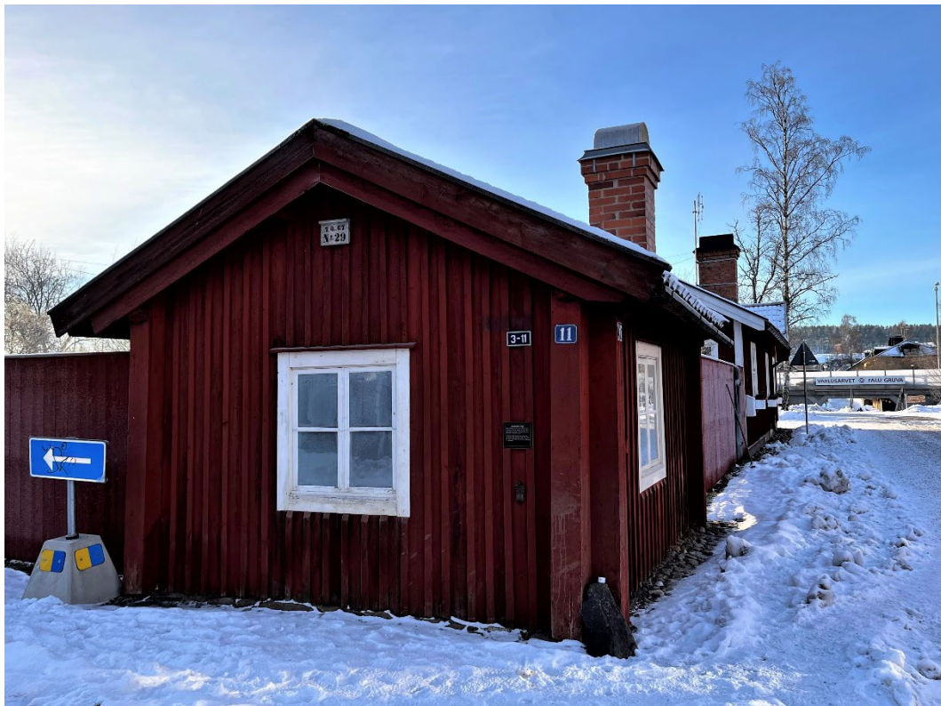
Figur 2. Stugans 9 kvadratmeter är placerade i kanten av tomten för att utnyttja markytan så effektivt som möjligt.

Interiören består av ett rum. Väggarna är lerklinade och dekorationsmålade. Väggarnas nederdel under bröstningslisten är marmorerad, medan de övre väggpartierna är målade i en rosa färg med ett svart mönster. Taklisten är prydd med en enkel blomdekor.