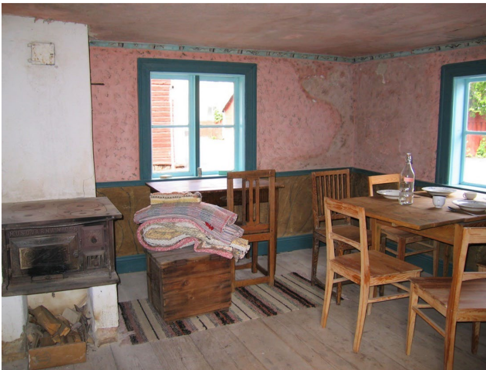
Figur 6. Stugans interiör är välbevarad med intakta dekormålningar.