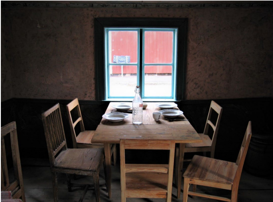
Figur 5. Stugan har huserat hela gruvarbetarfamiljer.