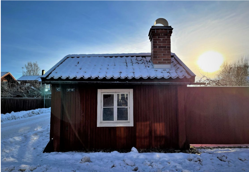
Figur 3. Stugan ligger dikt an mot gatan, likt många andra gruvarbetarstugor.