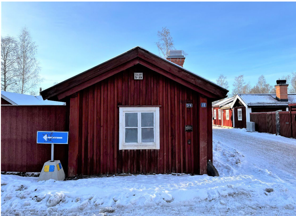
Figur 4. Gaveln mot Bondegatan.