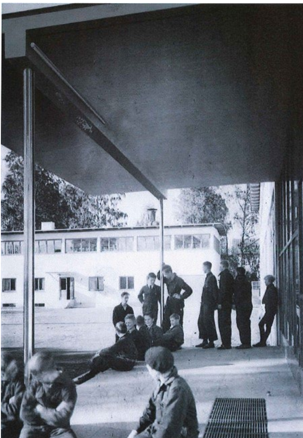
Figur 2. Elever på industriskolan, historiskt foto daterat innan 1962.