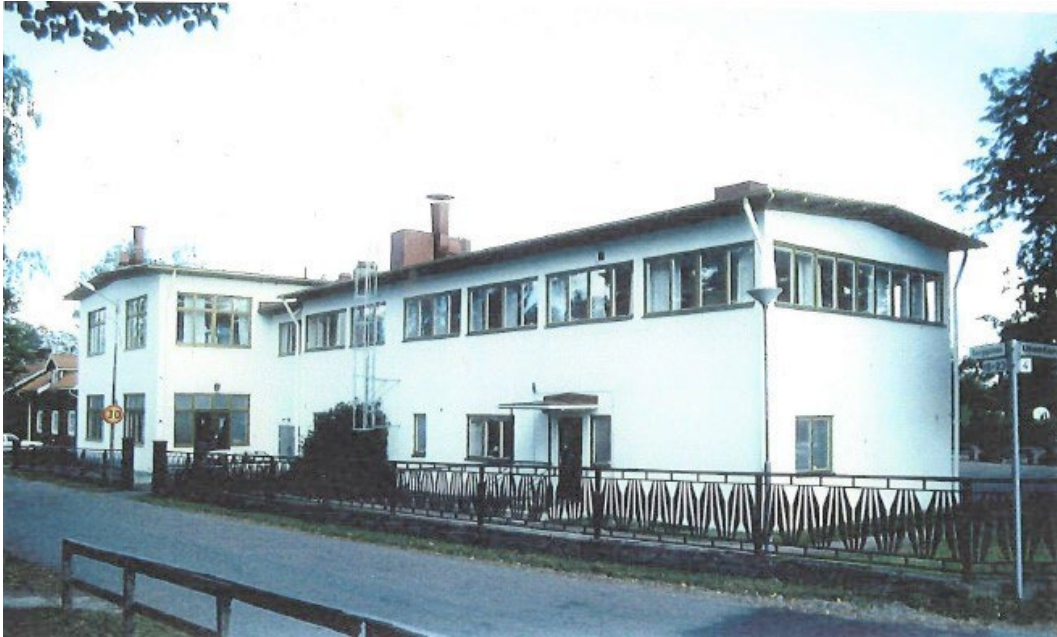
Figur 1. Till vänster i bild skymtar en arbetarbostad, typisk för området Hushagen.

Domnarvets industriskola ligger centralt i Borlänge. Byggnaden ligger i nära anslutning till arbetarbostäderna i Hushagen, där många av järnverkets anställda bodde. Skolans strikta formspråk står i kontrast till omgivande rödmålad trähusbebyggelse.