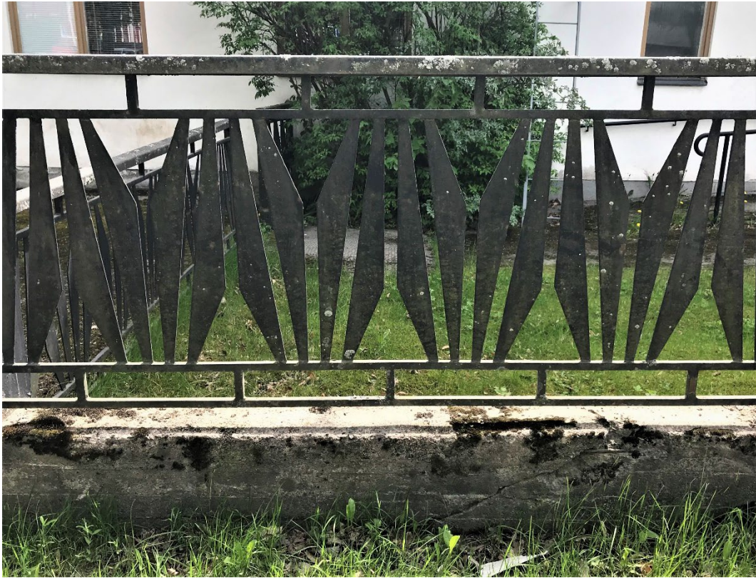
Figur 5. Smidesracket har ägnats avsevärd omsorg i gestaltningen.