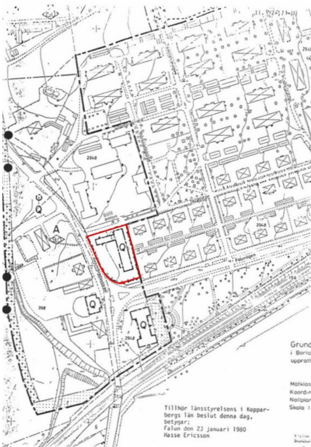
Figur 3. Byggnadsminnets skyddsområde. Ur beslut 1985.10.21.