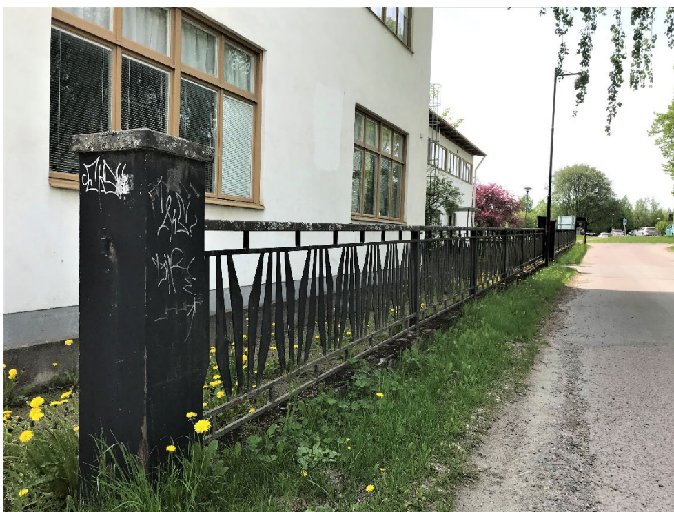
Figur 4. Smidesracket ramar in fastigheten.