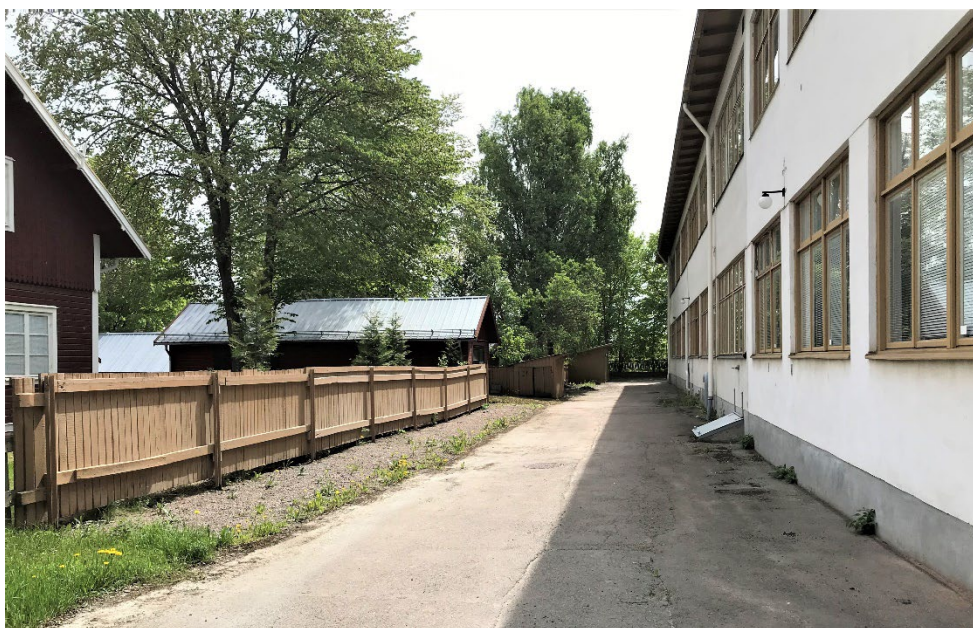
Figur 3. Mötet mellan industriskolans strikta modernism och arbetarbebyggelsens mer traditionella utformning.