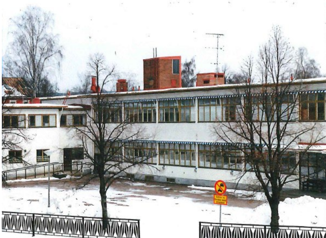
Figur 2. Långa fönsterband för gott om ljusinsläpp är ett återkommande drag i funktionalistiskt präglad bebyggelse.

Industriskolan i Borlänge består av en huvudbyggnad samt en vinkelställd sidobyggnad vilka senare sammanbyggts. Exteriört är skolan i stort sett bevarad i sitt originalskick, men interiört har planlösningen ändrats flera gånger.