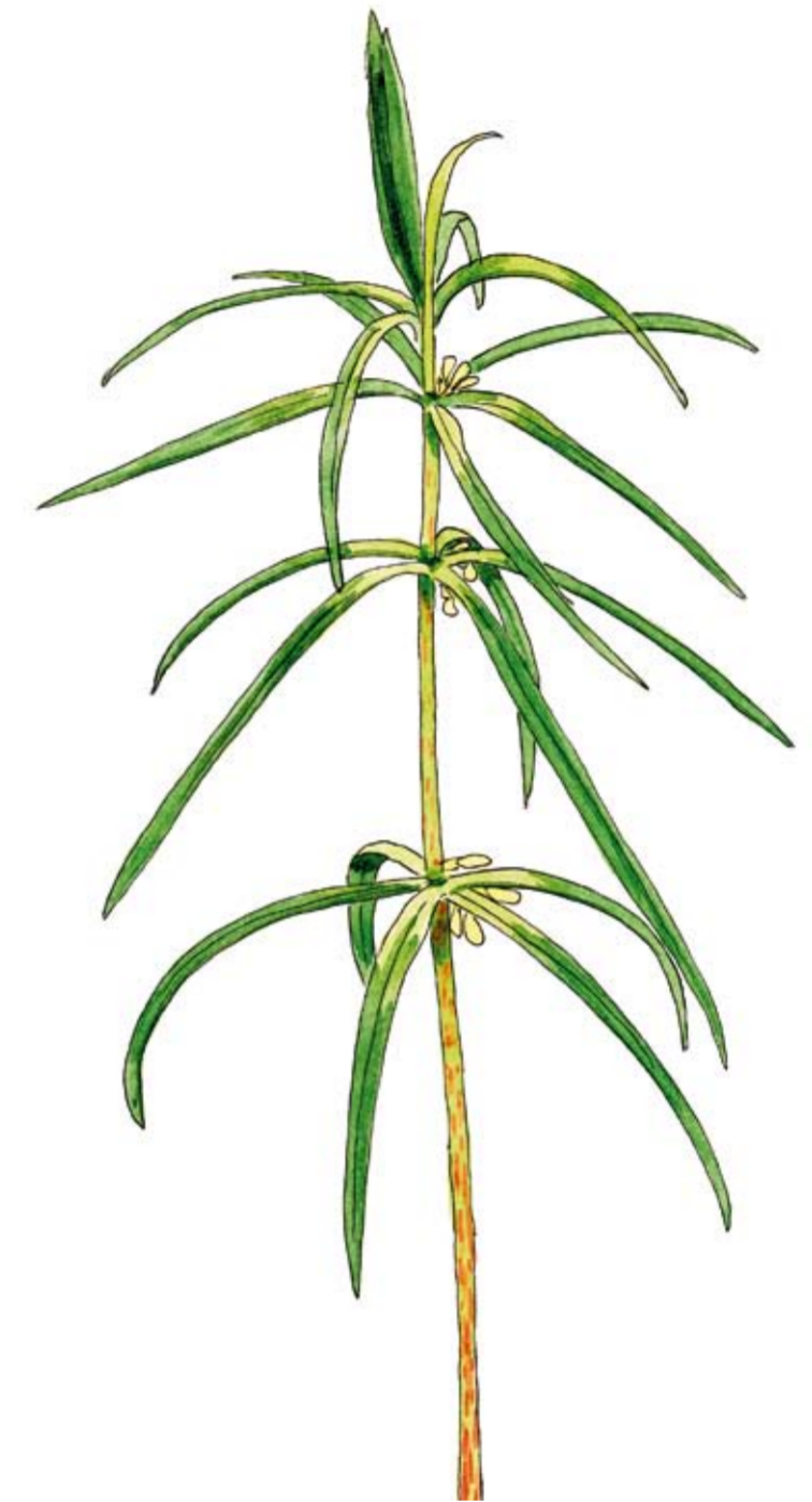
Kransrams, Polygonatum verticillatum Kransrams trivs i fuktiga skogar.